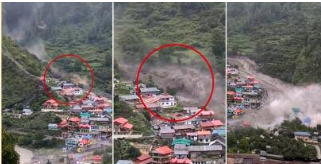
ਉਨ੍ਹਾਂ ਸੋਸ਼ਲ ਮੀਡੀਆ ਹਾਦਸੇ ਦੌਰਾਨ ਪ੍ਰਭਾਵਿਤ ਹੋਏ ਅਕਾਊਂਟ 'ਤੇ ਲਿਖਿਆ ਕਿ ਲੋਕਾਂ ਨਾਲ ਮੈਂ ਹਮਦਰਦੀ ਦਾ ਪ੍ਰਗਟਾਵਾ ਕਰਦਾ ਹਾਂ ਅਤੇ ਸਾਰੇ ਪੀੜਤਾਂ ਦੇ ਸਹੀ ਕੀਤੀ।