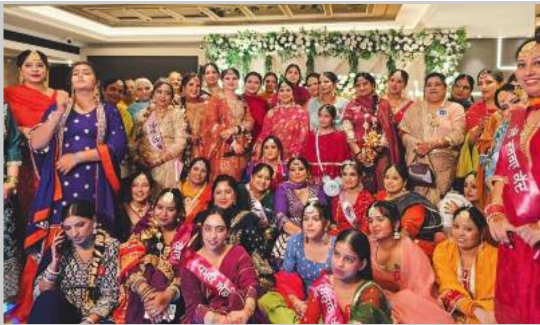
ਤੀਜ ਦਾ ਤਿਉਹਾਰ ਮਨਾਉਣ ਸਮੇਂ ਇਕੱਠੀਆਂ ਹੋਈਆਂ ਮੁਟਿਆਰਾਂ ਤੇ ਕਲੱਬ ਮੈਂਬਰ।