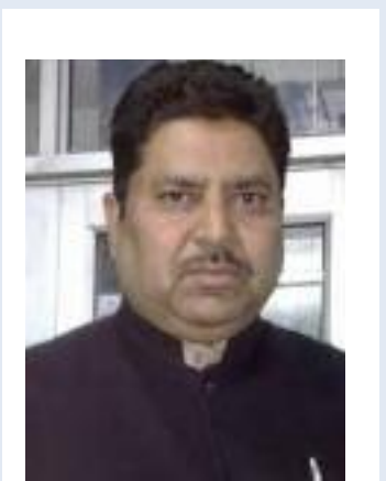
ਪੇਸ਼ਕਸ਼:-ਅਮਰਜੀਤ ਚੰਦਰ ਲੁਧਿਆਣਾ

ਜਲਦੀ ਮੰਦਰ ਹੋ ਕੇ ਆਉਂਦੀ ਹਾਂ। ਲੀ ਚੇਨ ਨੂੰ ਕਿਹਾ। ਛੇਨ ਜਦੋਂ ਘਰ ਪਹੁੰਚਿਆਂ ਤਾਂ ਚਿਨ ਉਸ ਨੂੰ ਦੇਖ ਕੇ ਡਰ ਗਿਆ ਤਾਂ ਰੋਣ ਲੱਗ ਪਿਆ। ਚੇਨ ਤੋਂ ਬੱਚੇ ਦਾ ਰੋਣਾ ਦੇਖਿਆ ਨਹੀ ਜਾ ਰਿਹਾ ਸੀ। ਉਹ ਆਪਣੇ ਬੱਚੇ ਚਿਨ ਦੇ ਕੋਲ ਗਿਆ ਤਾਂ 'ਕਿਹਾ ਕਿ ਬੇਟਾ ਡਰ ਨਾ ਮੈਂ ਤੇਰਾ ਪਿਤਾ ਹੀ ਹਾਂ,' ਚਿਨ ਉਸ ਨੂੰ ਦੇਖ ਕੇ ਰੋਣਾ ਭੁੱਲ ਗਿਆ, ਅਤੇ ਗੁੱਸੇ ਵਿੱਚ ਆ ਕੇ ਬੋਲਿਆ ਕਿ