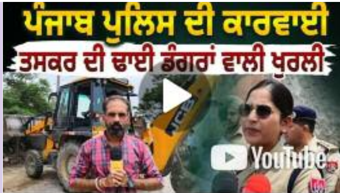
ਪੰਜਾਬ ਪੁਲਿਸ ਦੀ ਕਾਰਵਾਈ, ਤਸਕਰ ਦੀ ਢਾਈ ਡੰਗਰਾਂ ਵਾਲੀ ਖੁਰਲੀ |D5 Channel

ਵਿਰੁੱਧ ਯੁੱਧ ਤਹਿਤ ਅਨੇਕਾਂ ਮੀਟਿੰਗਾਂ ਮੁਹਿੰਮਾਂ ਵਿੱਚੀਆਂ ਹੋਈਆਂ ਹਨ ਜੋ ਚੰਗੀ ਗੱਲ ਹੈ ਕਿਉਂਕਿ ਅਨੇਕਾਂ ਨਸ਼ਾ ਤਸਕਰ ਫੜਨ ਕਾਰਨ ਨਸ਼ੇ ਨੂੰ ਠੱਲ ਤਾਂ ਪਈ ਹੈ ਪਰ ਕਈ ਵਾਰ ਇਸ ਯੁੱਧ ਨਸ਼ਿਆਂ ਵਿਰੁੱਧ ਦੇ ਵਿੱਚੋਂ ਹਾਸ਼ੋਹੀਣੀਆਂ ਜਿਹੀਆਂ ਗੱਲਾਂ ਵੀ ਸਾਹਮਣੇ ਆ ਜਾਂਦੀਆਂ ਹਨ। ਜੀ ਹਾਂ ਬਿਲਕੁਲ ਇਸੇ ਤਰ੍ਹਾਂ ਹੀ ਹੋਇਆ ਪੁਲਿਸ ਜ਼ਿਲਾ ਖੰਨਾ ਅਧੀਨ ਪੈਂਦੇ ਮਾਛੀਵਾੜਾ ਇਲਾਕੇ ਦੇ ਪਿੰਡ ਚੱਕੀ ਦੇ ਵਿੱਚ ਇੱਥੋਂ ਦਾ ਇੱਕ ਨਸ਼ਾ