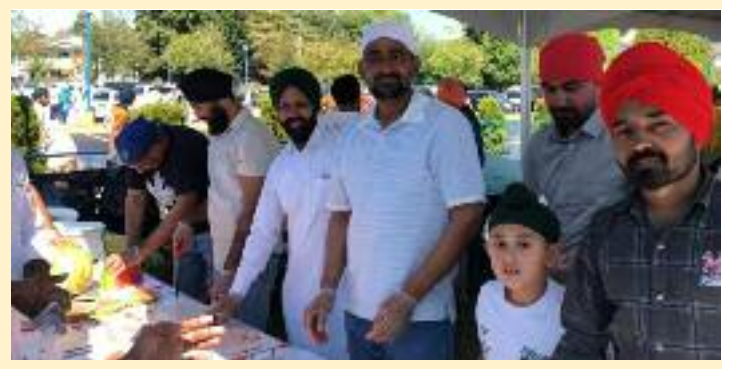
ਨਗਰ ਕੀਰਤਨ ਦੇ ਵੱਖ-ਵੱਖ ਦਿਸ਼ਾ।

ਵੈਨਕੂਵਰ (ਮਲਕੀਤ ਸਿੰਘ) - ਅਗਸਤ 24 ਨੂੰ ਹੋਵੇਗਾ ਰਿਲੀਜ਼ - ਪ੍ਰੋ ਭੋਲਾ ਯਮਲਾ ਇੰਡਕ ਆਰਟਸ ਵੈਲਫੇਅਰ ਕੌਂਸਲ ਵੱਲੋਂ ਕਲਾ ਭਲਾਈ ਕੀਤਾ ਜਾ ਰਹੇ ਨੇ ਵੱਡੇ ਉਪਰਾਲੇ