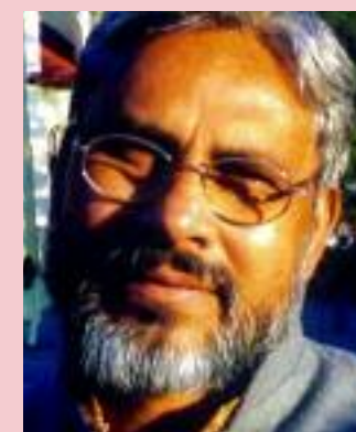
teacher of Delhi University and a former fellow of Indian Institute of

(The author associated with the socialist movement is a former