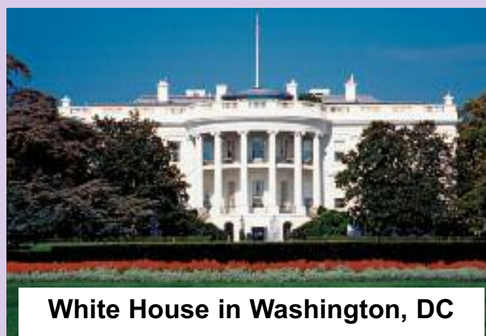
White House in Washington, DC

While US President Donald Trump’s impose a 25 percent tariff on Indian goods from August 1 and imposing a penalty on oil purchases from Russia is not a sudden move, but part of a strategy under which the US wants to incite internal conflict among developing countries and turn them against its own policies. China has already understood that America’s real game is not India vs. China, but India vs. India, that is, to keep India itself entangled in its own