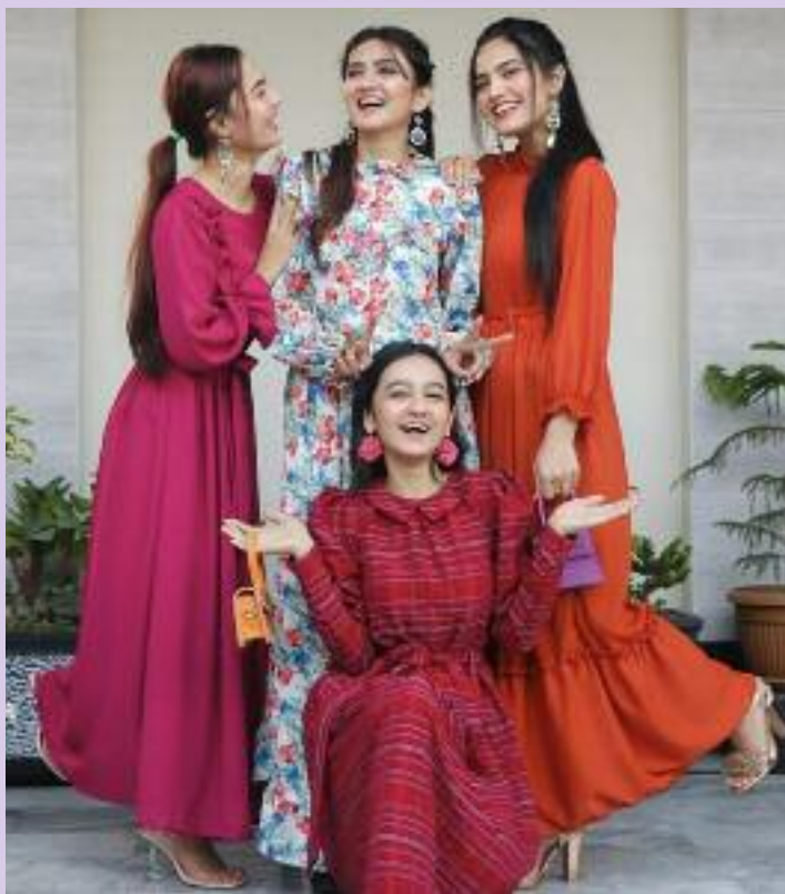
ਰਿਸ਼ਤੇ ਵਿੱਚ ਮਹੱਤਵ ਅਤੇ ਰਿਸ਼ਤੇ ਜੋ ਇਸਨੂੰ ਹੋਰ ਵਿਸ਼ੇਸ਼ ਬਣਾਉਂਦਾ ਦੀ ਸੰਭਾਲ ਦਾ ਪ੍ਰਗਟਾਵਾ ਹੁੰਦਾ ਹੈ, ਹੈ। ਇਹ ਰਿਸ਼ਤਾ ਵਿਆਹ ਤੋਂ

ਬਾਅਦ ਵੀ ਕਈ ਵਾਰ ਦਰਾਈ-ਜਨਾਣੀ ਦੇ ਰੂਪ ਵਿੱਚ ਵੀ ਫਬਦਾ ਹੈ, ਜਿਸ ਵਿੱਚ ਪਿਆਰ ਅਤੇ ਭਰੋਸਾ ਇਕੋ ਜਿਹਾ ਹੁੰਦਾ ਹੈ। ਭੈਣਾਂ ਦੇ ਇਹ ਮਿੱਠੇ ਬੰਧਨ ਸਿਰਫ ਇੱਕ ਉਮਰ ਤੱਕ ਹੀ ਨਹੀਂ ਰਹਿੰਦੇ, ਸਗੋਂ ਬਚਪਨ ਤੋਂ ਬੁਢਾਪੇ ਤੱਕ ਸਦਾ ਕਾਇਮ ਰਹਿੰਦੇ ਹਨ। ਇਨ੍ਹਾਂ ਰਿਸ਼ਤਿਆਂ ਦੀ ਮਹਿਕ ਪੇਕੇ ਤੇ ਸਹੁਰੇ ਘਰ ਦੋਵੇਂ ਥਾਂ ਇੱਕੋ ਤਰ੍ਹਾਂ ਫੈਲਦੀ ਹੈ, ਜੋ ਵਿਆਹ-ਸ਼ਾਦੀ ਜਾਂ ਖੁਸ਼ੀ ਦੇ ਮੌਕਿਆਂ ਨੂੰ ਹੋਰ ਵੀ ਰੌਸ਼ਨ ਕਰ ਦਿੰਦੀ ਹੈ। ਭੈਣਾਂ ਦੇ ਰਿਸ਼ਤੇ ਤੋਂ ਸਾਡੇ ਜੀਵਨ ਨੂੰ ਕਈ ਮਹੱਤਵਪੂਰਨ ਸਿੱਖਿਆਵਾਂ ਮਿਲਦੀਆਂ ਹਨ। ਇਹ ਸਾਡੇ ਲਈ ਮਾਰਗਦਰਸ਼ਨ ਬਣਦੀਆਂ ਹਨ ਅਤੇ ਸਾਨੂੰ ਦਸਦੀਆਂ ਹਨ ਕਿ ਰਿਸ਼ਤਿਆਂ ਨੂੰ ਮੋਹ ਤੇ ਸਨੇਹ ਨਾਲ ਕਿਵੇਂ ਨਿਭਾਇਆ ਜਾ ਸਕਦਾ ਹੈ। ਇਹੀ ਪਿਆਰ ਅਤੇ ਸਮਰਪਣ ਮਾਸੀ ਦੇ ਰਿਸ਼ਤੇ ਦੀ ਨੀਂਹ ਵੀ ਰੱਖਦਾ ਹੈ, ਜੋ ਇਹਨਾਂ ਰਿਸ਼ਤਿਆਂ ਨੂੰ ਹੋਰ ਮਜ਼ਬੂਤ ਅਤੇ ਮਾਣਯੋਗ ਬਣਾ ਦਿੰਦਾ ਹੈ। ਹਰ ਸਾਲ ਅਗਸਤ ਦੇ