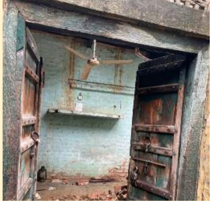
ਹੈ, ਉਹ ਇਸ ਬੁਢਾਪੇ ਦੀ ਉਮਰ ਵਿਚ ਲਈ ਉਸਦੀ ਵੱਧ ਤੋਂ ਵੱਧ 'ਚ ਘਰ ਨਹੀਂ ਬਣਾ ਸਕਦਾ। ਇਸ ਲਈ ਆਰਥਿਕ ਮੱਦਦ ਕੀਤੀ ਜਾਵੇ।