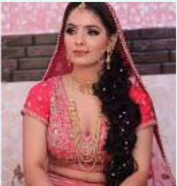
ਤੋਂ ਬਾਅਦ ਉਸਨੂੰ ਫੜ ਲਿਆ ਗਿਆ। ਪੀੜਤ ਮਹਿਲਾ ਦੇ ਛੇ ਸਾਲ

ਬੇਟੇ ਨੇ ਕਿਹਾ, “ਮੇਰੀ ਮੰਮੀ ਉਪਰ ਕੁਝ ਪਾਇਆ, ਫਿਰ ਉਨ੍ਹਾਂ ਨੂੰ ਥੱਪੜ ਮਾਰਿਆ ਤੇ ਲਾਈਟਰ ਨਾਲ ਅੱਗ ਲਾ ਦਿੱਤੀ।” ਇਹ ਘਟਨਾ ਵੀਰਵਾਰ ਰਾਤ ਦੀ ਦੱਸੀ ਜਾਂਦੀ ਹੈ। ਇਸ ਭਿਆਨਕ ਘਟਨਾ ਦੇ ਦੋ ਵੀਡੀਓ ਇੰਟਰਨੈੱਟ ’ਤੇ ਵਾਇਰਲ ਹੋ ਰਹੇ ਹਨ। ਇੱਕ ਵੀਡੀਓ ਵਿੱਚ, ਇੱਕ ਆਦਮੀ ਅਤੇ ਇੱਕ ਔਰਤ ਪੀੜਤਾ ਨਾਲ ਕੁੱਟਮਾਰ ਕਰਦੇ ਅਤੇ ਉਸ ਨੂੰ ਵਾਲਾਂ ਤੋਂ ਫੜ ਕੇ ਘਰ ਤੋਂ