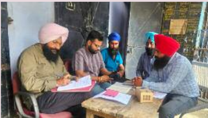
ਰਿਪੋਰਟ ਹੋਏ ਰਿਟੇਲਰਾਂ ਅਤੇ ਡੀਲਰਾਂ ਦੇ ਸਥਾਨਾਂ 'ਤੇ ਮੌਕੇ 'ਤੇ ਪਹੁੰਚ ਕੇ ਗਹਿਨ ਜਾਂਚ ਕਰ ਰਹੀਆਂ ਹਨ। ਜਾਂਚ