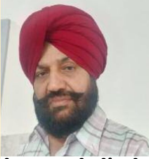
ਲਿਖਤਮ: ਅਮਰਜੀਤ ਸਿੰਘ ਜੀਤ

ਰਾਣੇ ਦੀ ਸ਼ਾਇਰੀ ਦੀ ਗੱਲ ਕਰੀਏ ਤਾਂ ਉਸਦੀ ਸ਼ਾਇਰੀ ਨਿਮਾਣਿਆਂ, ਲਤਾੜਿਆਂ, ਦੱਬਿਆਂ-ਕੁਚਲਿਆਂ, ਮਿਹਨਤਕਸ਼ਾਂ ਤੇ ਗੁਰਬਤ ਦੀ ਜ਼ਿੰਦਗੀ ਭੋਗਦੇ ਲਚਾਰਿਆਂ ਦਾ ਸਹਾਰਾ ਬਣਦੀ ਹੈ। ਹੱਕ ਸੱਚ ਇਨਸਾਫ ਲਈ ਆਵਾਜ਼ ਬੁਲੰਦ ਕਰਦੀ ਹੈ। ਰਾਣਾ ਜਿੱਥੇ ਇਕ ਵੱਡਾ ਸ਼ਾਇਰ ਹੈ ਉੱਥੇ ਉਹ ਇਕ ਕਰਮਯੋਗੀ ਯੋਧਾ ਵੀ ਹੈ, ਉਹ ਬਹੁਜਨ