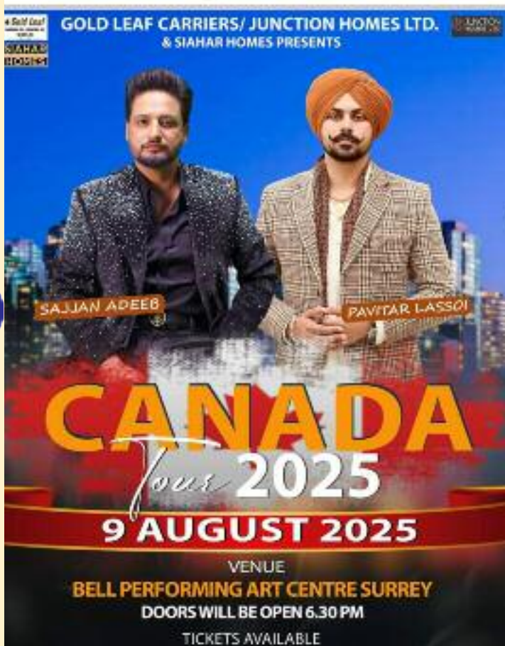
ਪ੍ਰੋਗਰਾਮ ਦਾ ਇੱਕ ਪੋਸਟਰ