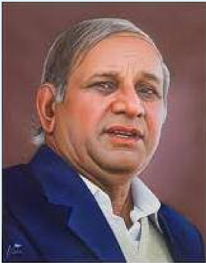
Saheb Kanshi Ram 15/03/1934 - 09/10/2006 Founder - SAMJEE, DOA, SSP

ਦੇ ਮੁਤਾਬਿਕ ਸਾਹਿਬ ਦੇ ਇਲਾਜ ਤੇ 50 ਲੱਖ ਰੁਪਿਆ ਖਰਚ ਹੋ ਚੁੱਕਿਆ ਸੀ। 9 ਅਕਤੂਬਰ, 2006 ਨੂੰ ਜਦੋਂ ਸਾਹਿਬ ਨੇ (8 ਅਕਤੂਬਰ ਦੀ ਰਾਤ ਨੂੰ ) 12.20 ਮਿੰਟ ਤੇ ਆਪਣਾ ਆਖਰੀ ਸਵਾਸ ਲਿਆ ਤਾਂ ਕੁਮਾਰੀ ਮਾਇਆਵਤੀ ਹਿਮਾਯੂੰ ਰੋਡ ਸਥਿਤ ਆਪਣੇ ਨਿਵਾਸ ਤੇ, ਸਾਹਿਬ ਦੇ ਕੋਲ ਹੀ ਸੀ। ਅੰਤਿਮ ਸੰਸਕਾਰ ਤੋਂ ਪਹਿਲਾਂ ਸਾਹਿਬ ਦੇ ਮ੍ਰਿਤਕ ਸਰੀਰ ਨੂੰ