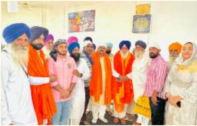
ਕਰਦਿਆ ਕਿਹਾ ਕਿ ਆਪਣੇ ਇਲਾਕੇ ਦੀ ਸੰਗਤ ਵੱਲੋਂ ਦਿੱਤਾ ਸਨਮਾਨ ਹਮੇਸ਼ਾ ਖਾਸ ਹੁੰਦਾ ਹੈ। ਇਸ ਨਾਲ ਹਮੇਸ਼ਾ ਹੌਸਲਾ ਵੱਧਦਾ ਹੈ ਤੇ ਕਾਰਜ ਕਰਨ ਲਈ ਨਵੀਂ ਊਰਜਾ ਮਿਲਦੀ ਹੈ। ਇਸ

ਵੱਲੋਂ ਗੁਰਦੁਆਰਾ ਪਾਤਸ਼ਾਹੀ ਨੌਵੀਂ ਵਿੱਚ ਸਮਾਗਮ ਰੱਖ ਕੇ ਵਿਸ਼ੇਸ਼ ਤੌਰ ਤੇ ਸਨਮਾਨਿਤ ਕੀਤਾ ਗਿਆ। ਇਸ ਮੌਕੇ ਦੋਵੇਂ ਜਿਲਾ ਪ੍ਰਧਾਨ ਨੇ ਕਿਹਾ ਕਿ ਪਾਰਟੀ ਪ੍ਰਧਾਨ ਸੁਖਬੀਰ ਸਿੰਘ ਬਾਦਲ ਵੱਲੋਂ ਉਨ੍ਹਾਂ ਜਿਲੇ ਦੀ ਜ਼ਿੰਮੇਵਾਰੀ ਸੌਂਪੀ ਹੈ, ਜਿਸ ਤੇ ਆਪਣੀ ਜ਼ਿੰਮੇਵਾਰੀ ਨਿਭਾਉਂਦਿਆਂ ਪਾਰਟੀ ਦੀ ਚੜਦੀ ਕਲਾ ਲਈ ਆਪਣੇ ਯਤਨ ਜਾਰੀ ਰੱਖਾਗਾ। ਉਨ੍ਹਾਂ ਵੱਲੋਂ ਸਰਕਲ ਭੀਖੀ ਦੀ ਸਾਰੀ ਸੰਗਤ, ਸੰਸਥਾਵਾਂ ਦਾ ਧੰਨਵਾਦ