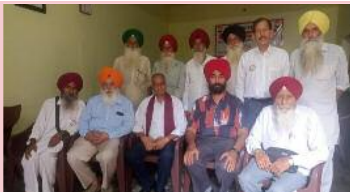
ਸਾਡੀ ਜਥੇਬੰਦੀ ਨੇ ਸਰਕਾਰ ਤੋਂ ਮੰਗ ਕੀਤੀ ਹੈ ਕਿ ਫਰੀਡਮ ਫਾਈਟਰਾਂ ਦੇ ਵਾਰਸਾਂ ਦੀ ਹੱਕੀ ਮੰਗਾਂ ਜਲਦ ਤੋਂ ਜਲਦ ਮੰਨੀਆ ਜਾਣ, ਤੇ ਜਿਲ੍ਹੇ ਸਮੇਤ ਦੇਸ਼ ਦੇ ਸਮੂਹ ਟੋਲ ਪਲਾਜ਼ਿਆ ਤੋਂ ਸਾਡੇ ਪਰਿਵਾਰਾਂ ਨੂੰ ਛੋਟ ਦਿੱਤੀ