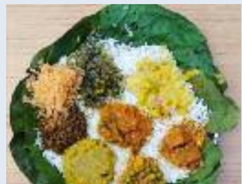
ਇੱਥੇ ਧਾਮ ਦੇ ਅਨੇਕ ਰੂਪ ਮੌਜੂਦ ਹਨ, ਜਿਵੇਂ ਕਾਂਗੜੀ ਧਾਮ, ਮੌਡਿਆਲੀ ਧਾਮ, ਚੰਬਿਆਲੀ ਧਾਮ ਅਤੇ ਬਿਲਾਸਪੁਰੀ ਧਾਮ। ਪਰ ਇਨ੍ਹਾਂ ਵਿੱਚੋਂ ਕਾਂਗੜੀ ਧਾਮ ਆਪਣੀ ਲਾਜਵਾਬ ਮਹਿਕ ਅਤੇ ਰਿਵਾਇਤੀ ਵਿਧੀ ਕਰਕੇ ਵੱਖਰੀ ਪਛਾਣ ਬਣਾਉਂਦੀ ਹੈ।

ਹਨ। ਆਮ ਤੌਰ 'ਤੇ ਧਾਮ ਵਾਸਤੇ ਅਸਥਾਈ ਰਸੋਈ ਮੁੱਖ ਘਰ ਦੇ ਬਾਹਰ ਬਣਾਈ ਜਾਂਦੀ ਹੈ। ਇਸ ਰਸੋਈ ਦੇ ਵੱਖੇ ਵਿਚ ਬਾਂਸ ਅਤੇ ਛੱਤ ਲਈ ਸਟੀਲ ਦੀਆਂ ਚਾਦਰਾਂ ਵਰਤੀਆਂ ਜਾਂਦੀਆਂ ਹਨ। ਜ਼ਮੀਨ 'ਚ ਤਕਰੀਬਨ ਇੱਕ ਫੁੱਟ ਡੂੰਘਾ-ਚੌੜਾ ਤੇ 8 ਤੋਂ 10 ਫੁੱਟ ਲੰਮਾ ਟੋਆ ਪੁੱਟਿਆ ਜਾਂਦਾ ਹੈ, ਜਿਸ ਨੂੰ ਤੀਣ ਕਿਹਾ ਜਾਂਦਾ ਹੈ ਅਤੇ ਇਸ ਦੇ ਉਪਰ ਸੰਪੂਰਨ ਪੁਜਾ ਵਿਧੀ ਨਾਲ ਸਾਰੇ ਪਕਵਾਨਾਂ ਦੀ ਇਕ ਰਾਤ ਪਹਿਲਾਂ ਹੀ ਤਿਆਰੀ ਸ਼ੁਰੂ ਹੁੰਦੀ ਹੈ। ਜਦੋਂ ਇਹ ਭੋਜਨ ਨਿਮਰਤਾ ਅਤੇ ਪ੍ਰੇਮ ਨਾਲ ਪਰੋਸਿਆ ਜਾਂਦਾ ਹੈ ਉਦੋਂ ਤਕ ਇਹ ਸਾਰੀ ਪਰਕ੍ਰਿਆ ਇਕ ਅਧਿਆਤਮਿਕ ਤਸਵੀਰ ਦੀ ਸ਼ਕਲ ਲੈ ਲੈਂਦੀ ਹੈ। ਧਾਮ ਖਾਸ ਤੌਰ 'ਤੇ ਜ਼ਮੀਨ 'ਤੇ ਬੈਠ ਕੇ ਖਾਧਾ ਜਾਂਦਾ ਹੈ, ਜੋ ਨਿਮਰਤਾ ਅਤੇ ਪਰੰਪਰਾਵਾਂ ਨਾਲ ਜੋੜਨ ਵਾਲੀ ਰਿਵਾਇਤ ਹੈ। ਖਾਣਾ 'ਪਤਲੂ' ਨਾਮ ਦੀਆਂ ਪੱਤਿਆਂ ਦੀਆਂ ਥਾਲੀਆਂ ਵਿੱਚ ਪਰੋਸਿਆ ਜਾਂਦਾ ਹੈ, ਜੋ ਕਿ ਕਾਂਗੜੀ ਲੋਕ-ਭਾਸ਼ਾ ਦੀ ਇਕ ਅਣਮੁੱਲੀ ਵਿਰਾਸਤ ਹੈ। ਧਾਮ ਵਿੱਚ ਚਾਵਲ, ਮਧਰਾ (ਦਹੀਂ ਨਾਲ ਬਣੇ ਵਿਅੰਜਨ), ਰਾਜਮਾ, ਕੜੀ, ਮਾਹ ਦੀ ਦਾਲ, ਚਣੇ ਦਾ ਖੱਟਾ ਤੇ ਆਖਿਰ