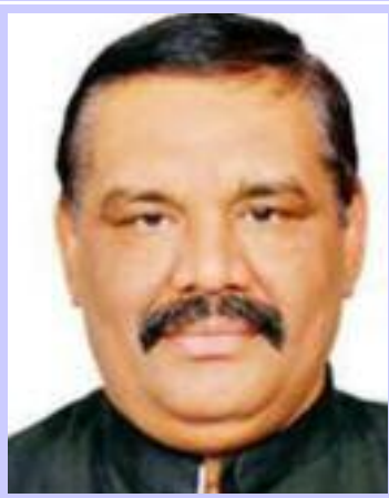
ਕੇਜਰੀਵਾਲ ਨੇ ਚੋਣਾਂ ਤੋਂ ਪਹਿਲਾਂ ਐਲਾਨ ਕੀਤਾ ਸੀ ਕਿ ਜੇਕਰ ਪੰਜਾਬ ਵਿੱਚ ਸਰਕਾਰ ਬਣੀ ਤਾਂ ਉਪ-ਮੁੱਖ ਮੰਤਰੀ ਦਲਿਤ ਸਮਾਜ ਵਿੱਚੋਂ ਹੋਵੇਗਾ, ਪਰ ਸਰਕਾਰ ਬਣਨ ਤੋਂ ਬਾਅਦ ਉਹਨਾਂ ਨੇ ਇਹ ਵਾਅਦਾ ਪੂਰਾ ਨਹੀਂ ਕੀਤਾ। ਸਾਢੇ ਤਿੰਨ ਸਾਲ ਬੀਤ ਗਏ, ਪਰ ਅਜੇ ਤੱਕ

ਅਪਰਾਧ ਦੀ ਰੋਕਥਾਮ ਐਕਟ, 2025" ਵਿੱਚ ਗੁਰੂ ਰਵਿਦਾਸ ਜੀ ਦੀ ਮੂਰਤੀ ਅਤੇ ਪਵਿੱਤਰ ਗ੍ਰੰਥ ਅੰਮ੍ਰਿਤਵਾਣੀ, ਭਗਵਾਨ ਵਾਲਮੀਕੀ ਜੀ ਦੀ ਮੂਰਤੀ, ਸਤਿਗੁਰੂ ਕਬੀਰ ਜੀ ਦੀ ਮੂਰਤੀ ਅਤੇ ਸੰਤ ਨਾਭਾ ਦਾਸ ਦੀਆਂ ਮੂਰਤੀ ਦੀ ਬੇਅਦਬੀ ਦੀ ਸਜ਼ਾ ਦਾ ਪ੍ਰਾਵਧਾਨ ਨਾ ਰੱਖ ਕੇ ਦਲਿਤ ਸਮਾਜ ਪ੍ਰਤੀ ਨਫਰਤ ਭਰੀ ਮਾਨਸਿਕਤਾ ਸਾਫ ਦਿਖਾਈ ਦਿੱਤੀ ਹੈ। ਕੇਜਰੀਵਾਲ ਦੀ ਆਮ ਆਦਮੀ ਪਾਰਟੀ ਦੀ ਦਲਿਤ-ਵਿਰੋਧੀ ਮਾਨਸਿਕਤਾ ਮਾਰਚ 2022 ਵਿੱਚ ਹੀ ਸਾਹ-ਮਣੇ ਆ ਗਈ ਸੀ। ਪੰਜਾਬ ਦੀ ਲਗਭਗ 31% ਦਲਿਤ ਆਬਾਦੀ ਦੇ ਵੋਟਾਂ ਲਈ ਅਰਵਿੰਦ