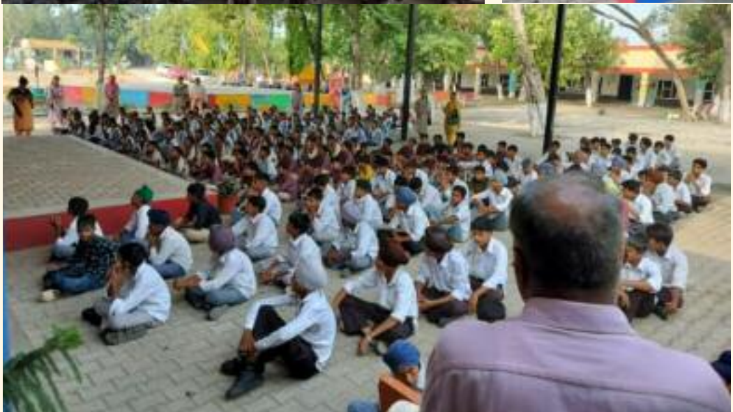
ਅਪੀਲ ਕੀਤੀ। ਇਸ ਸਮੇਂ ਵਿਗਿਆਨਕ ਵਿਚਾਰਾਂ ਚੇਤਨਾ ਪੁਸਤਕਾਂ ਵੀ ਦਿੱਤੀਆਂ ਵਿਦਿਆਰਥੀਆਂ ਨੂੰ ਪਰਖ ਪ੍ਰੀਖਿਆ ਲਈ ਸਿਲੇਬਸ ਗਈਆਂ। ਇਸ ਸਮਾਗਮ ਵਿੱਚ