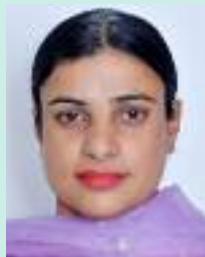
ਸਮਾਜ ਵੀਕਲੀ ਨਿਊਜ਼

ਅੱਜ ਦੀ ਕੁੜੀ ਸਿਰਫ ਇਕ ਰੋਟੀ ਬਣਾਉਣ ਵਾਲੀ ਹੀ ਨਹੀਂ, ਉਹ ਘਰ ਦੀ ਰੋਸ਼ਨੀ, ਤੇ ਸਮਾਜ ਦੀ ਇਨਕਲਾਬੀ ਹੈ। ਸਵੇਰ ਦੀ ਸ਼ੁਰੂਆਤ ਚੁਲ੍ਹੇ ਦੀ ਅੱਗ ਨਾਲ ਕਰਦੀ ਹੈ, ਬੱਚਿਆਂ ਦਾ ਯੂਨੀਫਾਰਮ 'ਚ ਉਹਦਾ ਪਿਆਰ ਸਿਲਿਆ ਹੁੰਦਾ ਹੈ। ਉਹ ਸਬਕ ਵੀ ਯਾਦ ਕਰਾਉਂਦੀ ਹੈ, ਰਸੋਈ ਵੀ ਸੰਭਾਲਦੀ ਹੈ, ਆਪਣੀ ਨੀਂਦ, ਆਪਣੇ ਅਰਮਾਨ, ਕਈ ਵਾਰ ਖਾਮੋਸ਼ੀ ਨਾਲ ਕੁਰਬਾਨ ਕਰ ਜਾਂਦੀ ਹੈ। ਜਦ ਬੱਚੇ ਸਕੂਲ ਜਾਂਦੇ ਨੇ, ਉਹ ਆਪਣੀ ਕਿਤਾਬਾਂ ਦੀ ਦੁਨੀਆ 'ਚ ਦਾਖਲ ਹੁੰਦੀ ਹੈ। ਰਾਤ ਦੀ ਖਾਮੋਸ਼ੀ ਵਿੱਚ ਪੜ੍ਹਾਈ ਕਰਦੀ, ਆਪਣੇ ਸੁਪਨਿਆਂ ਨੂੰ ਨਵੇਂ ਪੰਖ ਲਾਉਂਦੀ ਹੈ। ਉਹ ਇਕੋ ਸਮੇਂ 'ਮਾਂ', 'ਵਿਦਿਆਰਥਣ', ਨੌਕਰੀ ਕਾਰਨ ਵਾਲੀ, ਤੇ 'ਘਰ ਦੀ ਬੇਸ' ਬਣ ਜਾਂਦੀ ਹੈ। ਹਰ ਰੋਜ਼ ਉਹ ਆਪਣਾ ਆਪ ਭੁਲਾ ਕੇ, ਪਰਿਵਾਰ ਲਈ, ਭਵਿੱਖ ਲਈ, ਤੇ ਆਪਣੇ ਆਪ ਲਈ ਲੜਦੀ ਹੈ। ਉਹ ਥੱਕਦੀ ਤਾਂ ਹੈ, ਪਰ ਰੁੱਕਦੀ ਨਹੀਂ। ਉਹ ਰੋਦੀ ਵੀ ਕਈ ਵਾਰੀ, ਪਰ ਦਿਖਾਉਂਦੀ ਨਹੀਂ। ਉਹ ਬਾਹਰੋਂ ਸ਼ਰੀਫ ਹੋ ਸਕਦੀ ਹੈ, ਪਰ ਅੰਦਰੋਂ ਲੋਹੇ ਵਾਂਗ ਮਜ਼ਬੂਤ। ਉਹ ਦੀ ਕਦਰ ਨਾ ਕਰਨਾ, ਇੱਕ ਸੰਘਰਸ਼ ਨੂੰ ਅਣਡਿੱਠਾ ਕਰਨਾ ਹੈ। ਉਹ ਸਿਰਫ "ਘਰ ਦੀ ਔਰਤ" ਨਹੀਂ, ਉਹ ਤਾਂ ਇਕ ਸੰਪੂਰਨ ਸੰਸਾਰ ਹੈ। ਇਹ ਲਿਖਤ ਹਰੇਕ ਉਸ ਕੁੜੀ ਨੂੰ ਸਮਰਪਿਤ ਹੈ, ਜੋ ਚੁੱਪਚਾਪ ਸੰਘਰਸ਼ ਕਰ ਕੇ ਵੀ ਇਕ ਨਵਾਂ ਸਵੇਰਾ ਲਿਆਉਣ ਦਾ ਜਜ਼ਬਾ ਰੱਖਦੀ ਹੈ।