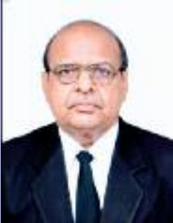
ਮਿੱਤਰ ਸੈਨ ਮੀਤ

ਨਾਲੇ ਚਾਰ ਪੈਸੇ ਜੋੜੇ, ਨਾਲੇ ਪੀਆਂ ਪੁੱਤਾਂ ਨੂੰ ਪੜਾ ਲਿਖਾ ਕੇ ਚੰਗੇ ਅਹੁਦਿਆਂ ਤੇ ਪਹੁੰਚਾਇਆ। ਪੰਜਾਬੀ ਭਾਸ਼ਾ ਪਸਾਰ ਭਾਈਚਾਰਾ ਨੇ ਪ੍ਰੋਗਰਾਮ ਭਾਵੇਂ ਕਨੇਡਾ ਵਿੱਚ ਰੱਖਣਾ ਹੋਵੇ ਭਾਵੇਂ ਪੰਜਾਬ ਵਿੱਚ, ਪ੍ਰਬੰਧਕਾਂ ਨੂੰ ਮਾਲੀ ਸਹਾਇਤਾ ਲਈ ਟੋਕ ਗਰਚਾ ਸਾਹਿਬ ਤੇ ਹੀ ਰੱਖਣੀ ਪੈਂਦੀ ਹੈ। ਹਾਂ ਬਾਅਦ ਸੰਸਥਾ ਭਾਵੇਂ 50 ਹਜ਼ਾਰ ਹੋਵੇ ਅਤੇ ਭਾਵੇਂ ਲੱਖ, ਗਰਚਾ ਸਾਹਿਬ ਕਦੇ ਮੱਥੇ ਵੱਟ ਨਹੀਂ ਪਾਉਂਦੇ। ਉਨ੍ਹਾਂ ਦੀ ਇਸੇ ਖੁੱਲ ਦਿਲੀ ਕਾਰਨ, ਭਾਈਚਾਰੇ ਵਾਲੇ ਗਰਚਾ ਸਾਹਿਬ ਨੂੰ ਸੰਸਥਾ ਦਾ ਸ਼ਾਹੂਕਾਰ ਕਹਿ ਕੇ ਹੀ ਬੁਲਾਉਂਦੇ ਹਨ।