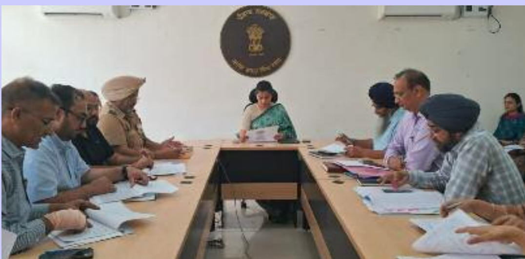
ਕੀਤਾ। ਉਨ੍ਹਾਂ ਸਿਹਤ ਵਿਭਾਗ ਨੂੰ ਕਿਸੇ ਘਰ ਜਾਂ ਅਦਾਰੇ ਵਿੱਚ ਪਹਿਲੀ ਵਾਰ ਡੇਗੂ ਦਾ ਲਾਰਵਾ ਮਿਲਣ 'ਤੇ ਚੇਤਾਵਨੀ ਨੋਟਿਸ ਜਾਰੀ ਕਰਨ ਲਈ ਕਿਹਾ। ਉਨ੍ਹਾਂ ਨਾਲ ਹੀ ਅਰਬਨ ਬਾਡੀ ਤੇ ਪੰਚਾਇਤ ਵਿਭਾਗ ਨੂੰ ਹਦਾਇਤ ਕੀਤੀ ਕਿ ਜੇਕਰ ਕਿਸੇ ਘਰ ਜਾਂ ਅਦਾਰੇ ਵਿੱਚ ਦੂਜੀ ਵਾਰ ਡੇਗੂ ਦਾ ਲਾਰਵਾ ਮਿਲਦਾ

ਜੀਵਾਣੂਆਂ ਅਤੇ ਦੂਸ਼ਿਤ ਪਾਣੀ ਕਾਰਨ ਹੋਣ ਵਾਲੀਆਂ ਬਿਮਾਰੀਆਂ ਦੀ ਰੋਕਥਾਮ ਲਈ ਮੁਸ਼ਤੈਦ ਰਹਿਣ ਦੀ ਹਦਾਇਤ ਕੀਤੀ। ਉਨ੍ਹਾਂ ਕਿਹਾ ਕਿ ਜੀਵਾਣੂਆਂ ਅਤੇ ਦੂਸ਼ਿਤ ਪਾਣੀ ਕਾਰਨ ਹੋਣ ਵਾਲੀਆਂ ਬਿਮਾਰੀਆਂ ਦੀ ਰੋਕਥਾਮ ਲਈ ਜ਼ਿਲ੍ਹੇ ਅੰਦਰ ਸਾਰੇ ਸਹਿਯੋਗੀ ਵਿਭਾਗ ਮਿਲ ਕੇ ਕੰਮ ਕਰਨ। ਉਨ੍ਹਾਂ ਨੇ ਕਿਹਾ ਕਿ ਜੀਵਾਣੂਆਂ ਨਾਲ ਡੇਗੂ, ਮਲੇਰੀਆ ਤੇ ਚਿਕਨਗੁਣੀਆਂ ਅਤੇ ਦੂਸ਼ਿਤ ਪਾਣੀ ਨਾਲ ਦਸਤ, ਉਲਟੀਆਂ, ਹੈਜ਼ਾ, ਪੀਲੀਆ ਵਰਗੀਆਂ ਬਿਮਾਰੀਆਂ ਦੇ ਪ੍ਰਸਾਰ ਨੂੰ ਰੋਕਣ ਲਈ ਅੰਤਰ ਵਿਭਾਗੀ ਸਹਿਯੋਗ ਬਹੁਤ ਜ਼ਰੂਰਤ ਹੈ। ਉਨ੍ਹਾਂ ਇਹ ਵੀ ਕਿਹਾ ਕਿ ਡੇਗੂ ਦੀ ਰੋਕਥਾਮ ਲਈ ਹਰ ਸੁੱਕਰਵਾਰ ਡੇਗੂ 'ਤੇ ਵਾਰ ਮੁਹਿੰਮ ਤਹਿਤ ਘਰ-ਘਰ ਸਰਵੇ ਕਰਕੇ ਲਾਰਵਾ ਖਤਮ ਕੀਤਾ ਜਾਵੇ ਤੇ ਆਮ ਲੋਕਾਂ ਨੂੰ ਲਾਰਵੇ ਦੀ ਪਛਾਣ ਬਾਰੇ ਜਾਗਰੂਕ