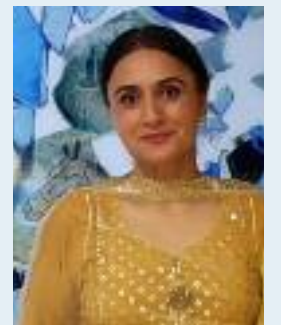
ਸਮਾਜ ਵੀਕਲੀ ਨਿਊਜ਼

ਗੱਲ ਸੁਣ, ਪੰਛੀ ਭੋਲਿਆ, ਬੁਲੰਦ ਉਡਾਰਾਂ ਮਾਰ। ਤੇਰਾ ਮੋਹ ਪਿਆ ਏਕਣ ਅੰਦਰ, ਜਿਵੇਂ ਸੱਜਣ, ਬੇਲੀ, ਯਾਰ। ਰੱਜ ਮਾਣ ਵੇ ਸੁੱਖਾਂ ਲੱਧਿਆ ਔਧ, ਮੌਜ ਘੜੀ ਦਿਨ-ਚਾਰ ਪਰ ਯਾਦ ਰੱਖੀਂ ਤੂੰ ਸੋਹਣਿਆ ਇਸ ਧਰਤ ਨਾਲ ਹੋਏ ਕਰਾਰ ਰੰਗ, ਰੰਗਤ, ਛਬ ਰੂਪ ਨੂੰ, ਨਿਹਾਰਾਂ, ਤੇ ਬਲਿਹਾਰ। ਤੈਨੂੰ ਕਿਸ ਖਸਲਤ ਤਰਾਸ਼ਿਆ, ਤੇਰਾ ਕਿਹੜਾ ਘਾੜੁਣਹਾਰ? ਹਵਸ ਨਾ, ਤਮਾਹ, ਨਾ ਲੋਭ, ਰੋਹ, ਤੈਨੂੰ, ਨਾ ਹਉਮੈ, ਨਾ ਖਾਰ। ਜਿੱਡਾ ਪਰਾਂ 'ਚ ਹੌਂਸਲਾ, ਪ੍ਰਬਲ ਨੂਰਾਨੀ ਆਕਾਰ। ਤੂੰ ਝਿਲਮਲ ਚਾਨਣ ਜੇਹੜਾ, ਤੇਰਾ ਨੂਰ ਅੰਬਰ ਤੋਂ ਪਾਰ। ਉਸ ਪਾਰ, ਵੇ ਜੰਨਤ ਪਰੀਆਂ, ਵੱਸਣ ਬਹਿਸਤ ਦਰਬਾਰ। ਚਹਚਹਾਟ ਰੂਹਾਂ ਟੁੰਬਦੀ, ਸੁਰ, ਹੂਕ, ਰੂਹਾਨੀ ਸਾਰ। ਤੇਰਾ ਇਸ਼ਕ ਵੇ ਸੁੱਚਾ ਅਮਰਤਾ, ਤੈਨੂੰ ਦੇਖ ਚੜੇ ਖੁਮਾਰ। ਤੂੰ ਪੂਰਨ, ਤ੍ਰਿਪਤ, ਸੁਹਾਵੜਾ, ਯੁੱਗ-ਯੁੱਗ ਵੱਸੋ ਕਲਾਕਾਰ। ਮਸਰੂਰ ਰਹੇ ਇਹ ਵਣ-ਬੇਲਾ, ਜੰਮ ਸੁਖਦ ਵੱਸੋ ਸੰਸਾਰ।