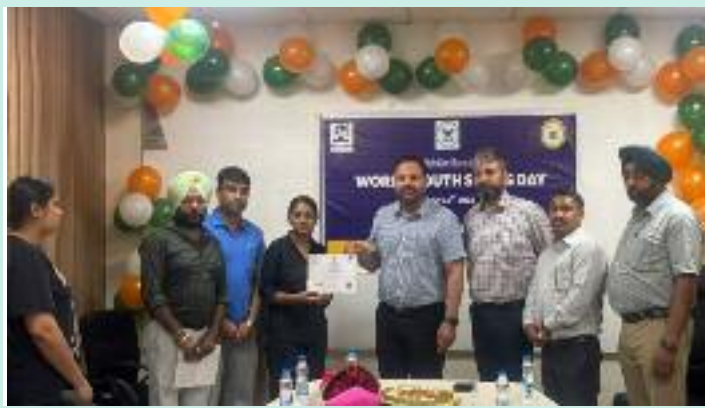
ਸਿਖਲਾਈ ਪ੍ਰੋਗਰਾਮ ਦੌਰਾਨ ਨੌਜਵਾਨਾਂ ਨੂੰ ਮੁਫਤ ਵਰਦੀਆਂ ਕਾਪੀਆਂ ਕਿਤਾਬਾਂ ਅਤੇ ਹੋਰ

ਸ਼ਹੀਦ ਭਗਤ ਸਿੰਘ ਨਗਰ ਦੇ ਕੇ.ਸੀ ਟਾਵਰ ਵਿਖੇ ਚੀਨ ਦਿਆਲ ਉਪਾਧਿਆ ਗ੍ਰਾਮੀਨ ਕੌਸ਼ਲ ਯੋਜਨਾ ਸਕੀਮ ਅਧੀਨ ਟ੍ਰੇਨਿੰਗ ਪਾਰਟਨਰ ਸ਼ਹੀਦ ਭਗਤ ਸਿੰਘ ਚੈਰੀਟੇਬਲ ਐਜੂਕੇਸ਼ਨ ਸੋਸਾਇਟੀ ਵੱਲੋਂ ਵੇਅਰਹਾਊਸ ਐਸੋਸੀਏਟ (ਲੌਜਿਸਟਿਕ ਸੈਕਟਰ) ਵਿੱਚ ਮੁਫਤ ਹੁਨਰ ਸਿਖਲਾਈ ਪ੍ਰਾਪਤ ਉਮੀਦਵਾਰਾਂ ਨੂੰ ਕੌਰਸ ਪੂਰਾ ਕਰਨ ਉਪਰੰਤ ਹੁਨਰ ਪ੍ਰਮਾਣਤਾ ਸਰਟੀਫਿਕੇਟ ਵੰਡੇ ਗਏ। ਪੰਜ ਮਹੀਨੇ ਦੇ ਇਸ ਮੁਫਤ ਹੁਨਰ