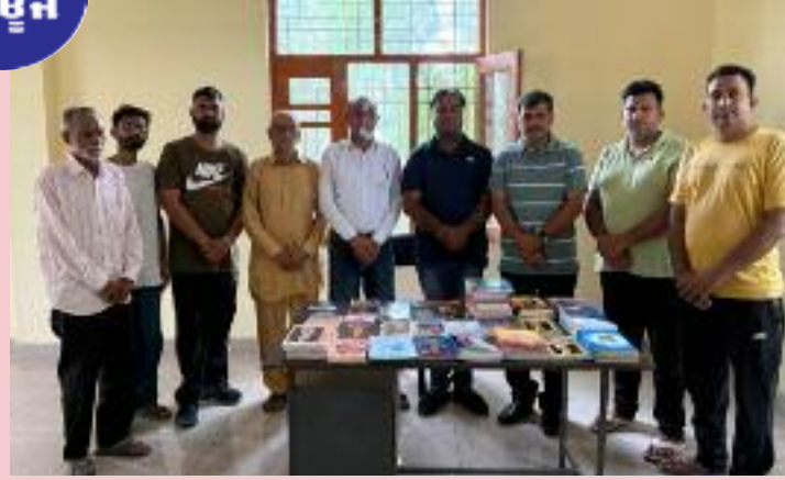
ਲਰਨਿੰਗ ਸੈਂਟਰ ਗੜ੍ਹਾ ਦੇ ਜਲਦ ਹੀ ਲਾਇਬ੍ਰੇਰੀ ਨੂੰ ਹੋਰ ਅਹੁਦੇਦਾਰਾਂ ਨੇ ਕਿਹਾ ਕਿ ਉਹ ਕਿਤਾਬਾਂ ਵੀ ਭੇਂਟ ਕਰਨਗੇ।