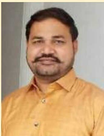
ਜਿਨ੍ਹਾਂ ਨੂੰ ਸਮਾਜ ਨੇ ਬਹੁਤ ਪਸੰਦ ਕੀਤਾ ਹੈ। ਉਨ੍ਹਾਂ ਦੀਆਂ

ਸਮਾਜ ਨੂੰ ਜਾਗਰੂਕ ਕਰਨ ਵਿੱਚ ਵੀ ਨਾਮਣਾ ਖੱਟਦੇ ਹਨ। ਉਹ ਵਿਦਿਆਰਥੀਆਂ ਨੂੰ ਆਪਣੇ ਬੱਚਿਆਂ ਵਾਂਗ ਪਿਆਰ ਕਰਦੇ ਅਤੇ ਪੜ੍ਹਾਉਂਦੇ ਹਨ। ਪੜ੍ਹਾਉਣ ਦੇ ਨਾਲ-ਨਾਲ ਉਹ ਸਮਾਜ-ਸੇਵਾ ਦੇ ਖੇਤਰ ਵਿੱਚ ਵੀ ਨਾਮਵਰ ਸ਼ਖਸੀਅਤ ਹਨ। ਉਹ ਸਮਾਜ ਨੂੰ ਆਪਣੀਆਂ ਲਿਖਤਾਂ ਰਾਹੀਂ ਹਮੇਸ਼ਾ ਵਧੀਆ ਸੇਧ ਦਿੰਦੇ ਹਨ। ਹੁਣ ਤੱਕ ਉਹ ਸੱਤ ਪੁਸਤਕਾਂ ਲਿਖ ਚੁੱਕੇ ਹਨ