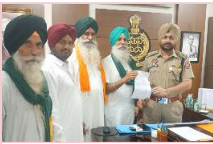
ਬੀਕੇਯੂ ਦੁਆਬਾ ਦਾ ਵਫ਼ਦ ਮੰਗ ਪੱਤਰ ਸੌਂਪਦਾ ਹੋਇਆ। ਨਗਦੀ ਚੋਰਾ ਵੱਲੋਂ ਚੋਰੀ ਕੀਤੀ ਖਾਲਸਾ ਤੇ 5/ 6 ਤੋਲੇ ਸੋਨਾ ਅਤੇ ਗਈ। ਇਸੇ ਤਰ੍ਹਾਂ ਪਿੰਡ ਅਵਾਣ 2 ਲੱਖ 50 ਹਜ਼ਾਰ ਰੁਪਏ ਦੀ

ਦੀਆਂ ਵਾਰਦਾਤਾਂ ਨੂੰ ਲੈ ਕੇ ਲੋਕਾਂ ਵਿੱਚ ਭਾਰੀ ਦਹਿਸ਼ਤ ਦਾ ਮਹੌਲਾ ਹੈ। ਵਫ਼ਦ ਨੇ ਆਖਿਆ ਕਿ ਪੁਲਿਸ ਪ੍ਰਸ਼ਾਸਨ ਵੱਲੋਂ ਇਨ੍ਹਾਂ ਚੋਰੀਆਂ ਨੂੰ ਲੈ ਕੇ ਸੰਤੋਸ਼ ਜਨਕ ਕਾਰਵਾਈ ਅਮਲ ਵਿੱਚ ਨਹੀਂ ਲਿਆਈ ਜਿਸ ਕਰਕੇ ਲੋਕਾਂ ਵਿੱਚ ਭਾਰੀ ਰੋਸ ਹੈ। ਵਫ਼ਦ ਵੱਲੋਂ ਮਾਣਯੋਗ ਐਸ ਐਸ ਪੀ ਦੇ ਫਿਰਮਾ ਹਿੱਤ ਲਿਆਉਂਦਿਆਂ ਇਹ ਵੀ ਦੱਸਿਆ ਕਿ ਮਈ 28 ਅਤੇ 29 ਦੀ ਰਾਤ ਨੂੰ ਪਿੰਡ ਪਛਾਤੀਆਂ ਦੇ ਗੁਰਮੇਲ ਸਿੰਘ ਦੇ ਘਰੇ 12 / 13 ਤੋਲੇ ਸੋਨਾ 2 ਲੱਖ