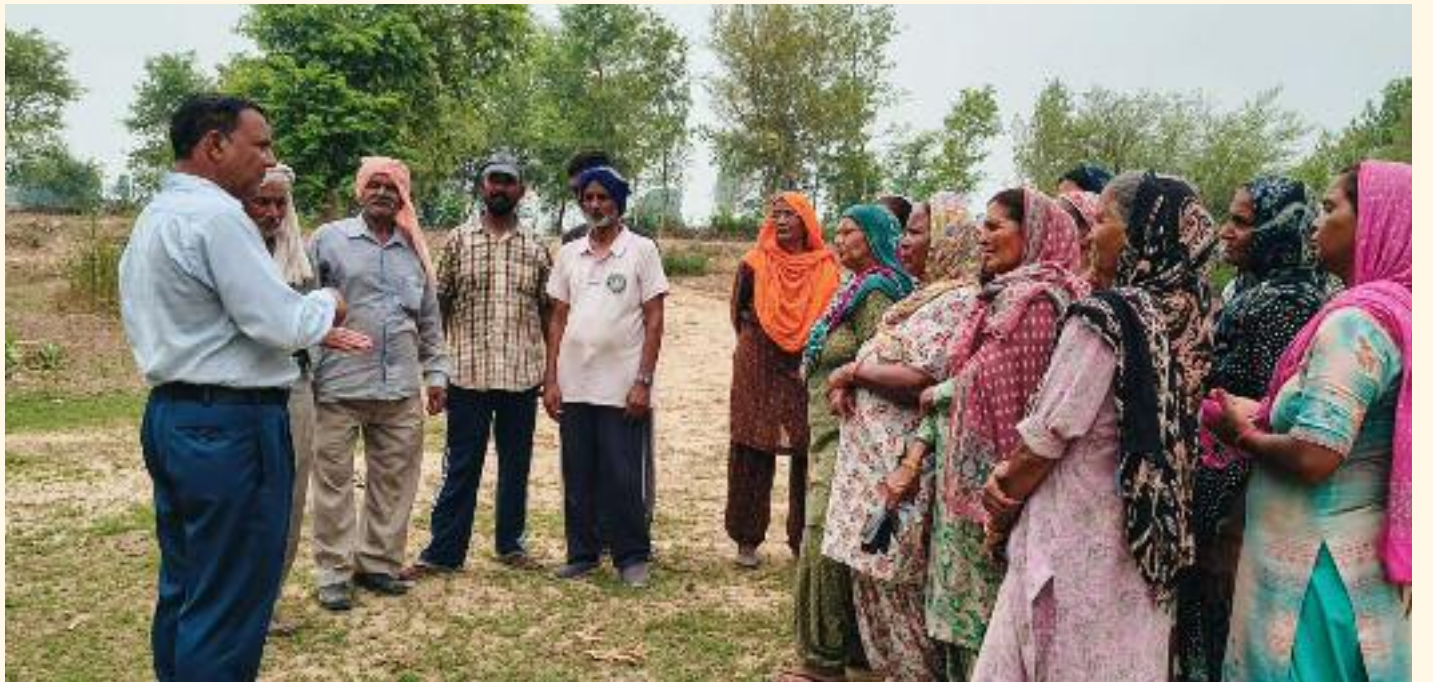
ਸਰਕਾਰਾਂ ਮਨਰੇਗਾ ਨੂੰ ਸੁਚੱਜੇ ਢੰਗ ਨਾਲ ਲਾਗੂ ਕਰਨ ਦੀ ਬਜਾਏ ਇਸ ਨੂੰ ਖਤਮ ਕਰਨ ਦੀ ਨੀਅਤ ਅਤੇ ਨੀਤੀ ਤੇ ਚੱਲ ਰਹੀਆਂ ਹਨ ਅਤੇ ਇਸ ਨੂੰ ਸਹਿਣ ਨਹੀਂ ਕੀਤਾ ਜਾਵੇਗਾ। ਉਨ੍ਹਾਂ ਪੁਰਜ਼ੋਰ ਮੰਗ ਕੀਤੀ ਕਿ ਮਨਰੇਗਾ ਨੂੰ ਰੂਬਰੂ ਲਾਗੂ ਕੀਤਾ ਜਾਵੇ ਇਸ ਦੇ ਬਜਾਏ ਵਿੱਚ ਵੀ ਲੋੜੀਂਦਾ ਵਾਧਾ ਕੀਤਾ ਜਾਵੇ।