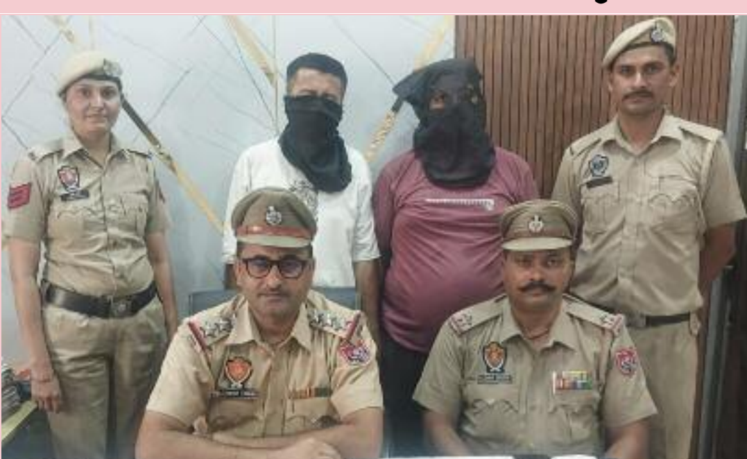
ਹੈਰੋਇਨ ਨੂੰ ਬ੍ਰਾਮਦ ਕਰਕੇ ਇਸ ਸਬੰਧੀ ਪੁਲਿਸ ਨੇ ਹੋਰ ਵਿੱਚ ਪੇਸ਼ ਕਰਕੇ ਰਿਮਾਂਡ ਹਾਸਿਲ ਐਨ.ਡੀ.ਪੀ.ਐਸ ਐਕਟ ਤਹਿਤ ਕੀਤਾ ਜਾਵੇਗਾ ਅਤੇ ਹੋਰ ਡੂੰਘਾਈ ਉਕਤ ਕਬਿਤ ਦੋਸ਼ੀਆਂ ਨੂੰ ਅਦਾਲਤ ਨਾਲ ਪੁੱਛਗਿੱਛ ਕੀਤੀ ਜਾਵੇਗੀ।