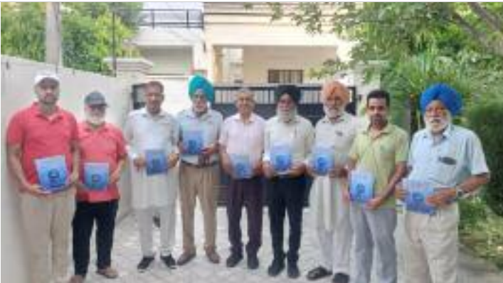
ਸਕੂਲਾਂ ਕੋਲ ਪਹੁੰਚ ਕਰਨ ਦਾ ਮੈਗਜ਼ੀਨ ਅੰਕ ਜੁਲਾਈ - ਅਗਸਤ ਫ਼ੈਸਲਾ ਕੀਤਾ ਗਿਆ। ਤਰਕਸ਼ੀਲ ਦੀ ਵੰਡ ਕੀਤੀ ਗਈ। ਮੀਟਿੰਗ