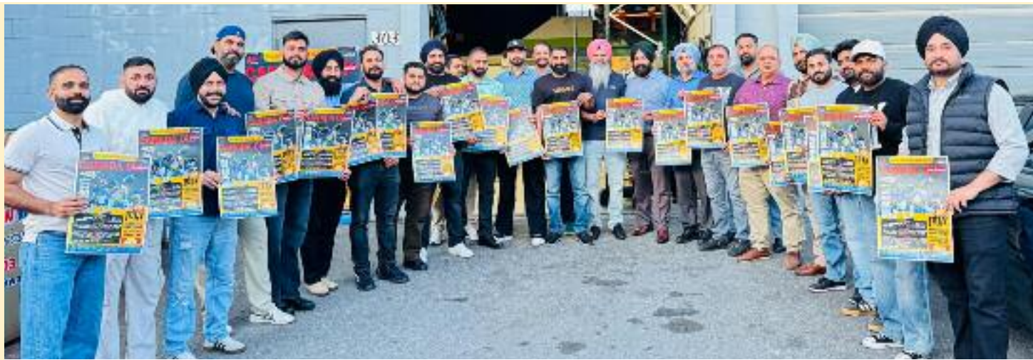
ਵੈਸਟ ਕੋਸਟ ਫੀਲਡ ਹਾਕੀ ਸੁਸਾਇਟੀ ਦੇ ਮੈਂਬਰ ਕੈਨੇਡਾ ਕੱਪ ਦਾ ਪੋਸਟਰ ਜਾਰੀ ਕਰਦੇ ਹੋਏ।