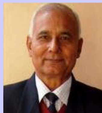
SR Darapuri, National President, All India People's Front

– The Uniform Civil Code (UCC), a long-standing BJP promise, is promoted as a way to unify personal laws