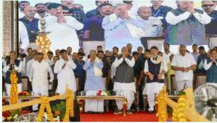
ਸੰਵਿਧਾਨ 'ਚ ਤਬਦੀਲੀ ਨਹੀਂ ਕਰਨ ਦੇਣਗੇ। ਜੇ ਤੁਸੀਂ (ਲੋਕ) ਉਨ੍ਹਾਂ ਨੂੰ ਸੰਵਿਧਾਨ ਬਦਲਣ ਦੇਵੋਗੇ ਤਾਂ ਤੁਹਾਡੇ ਕੋਲ ਕੋਈ

ਜਾ ਰਹੀ ਹੈ। ਖੜਗੇ ਨੇ ਕਰਨਾਟਕ ਸਰਕਾਰ ਵੱਲੋਂ ਕਰਵਾਏ ਗਏ ਸੰਮੇਲਨ ਦੌਰਾਨ ਮੈਸੂਰੂ ਲਈ 2500 ਕਰੋੜ ਰੁਪਏ ਤੋਂ ਵੱਧ ਦੇ ਵਿਕਾਸ ਕਾਰਜਾਂ ਦਾ ਉਦਘਾਟਨ ਕੀਤਾ ਤੇ ਨੀਂਹ ਪੱਥਰ ਰੱਖਿਆ। ਖੜਗੇ ਨੇ ਚਿਤਾਵਨੀ ਦਿੰਦਿਆਂ ਕਿਹਾ, 'ਭਾਜਪਾ ਤੇ ਆਰਐੱਸਐੱਸ ਸੰਵਿਧਾਨ 'ਚ ਸੋਧ ਕਰਨ ਜਾਂ ਉਸ ਨੂੰ ਮੁੜ ਤੋਂ ਲਿਖਣ ਦੀ ਗੱਲ ਕਰ ਰਹੇ ਹਨ। ਤੁਸੀਂ ਭਾਵੇਂ ਜਿੰਨੀ ਮਰਜ਼ੀ ਕੋਸ਼ਿਸ਼ ਕਰ ਲਵੋ, ਇਸ ਦੇਸ਼ ਦੇ ਲੋਕ ਤੁਹਾਨੂੰ