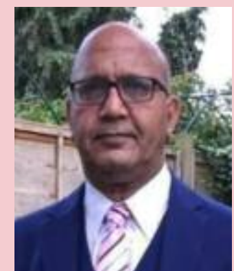
Bal Ram Sampla Geopolitics