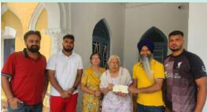
ਗਰਾਊਂਡ ਵਿੱਚ ਪਾਣੀ ਦੀ ਲਗਾਤਾਰ ਉਪਲੱਬਧਤਾ ਯਕੀਨੀ ਬਣਾਵੇਗਾ।