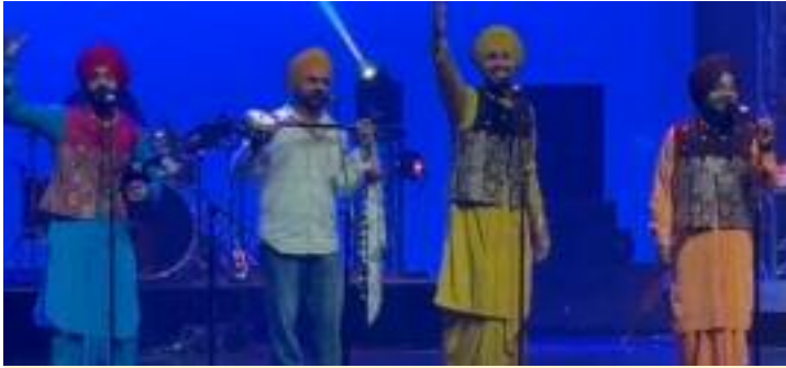
ਰੰਗਾਰੰਗ ਪ੍ਰੋਗਰਾਮ ਦੀਆਂ ਵੱਖ ਵੱਖ ਤਸਵੀਰਾਂ।

ਜਿਗਰੀ ਰਿਕਾਰਡਸ ਵੱਲੋਂ ਆਯੋਜਿਤ ਰੰਗਾ ਰੰਗ ਪ੍ਰੋਗਰਾਮ ਚ ਵੱਡੀ ਗਿਣਤੀ ਚ ਦਰਸ਼ਕਾਂ ਨੇ ਆਨੰਦ ਮਾਣਿਆ