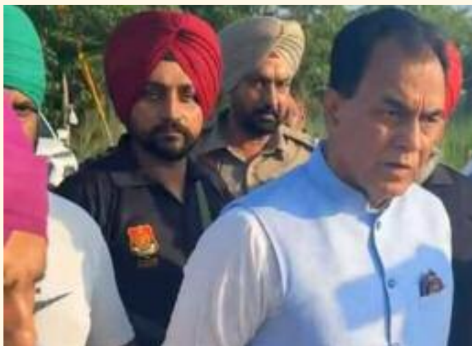
ਪੰਜਾਬ ਸਰਕਾਰ ਤੱਕ ਇਸ ਦੀ ਜਾਣਕਾਰੀ ਪਹੁੰਚਾ ਕੇ ਲੋਕਾਂ ਨੂੰ ਮਦਦ ਦਿਵਾਉਣ ਦੀ ਹਰ ਸੰਭਵ ਕੋਸ਼ਿਸ਼ ਕਰਨਗੇ। ਡਾ.