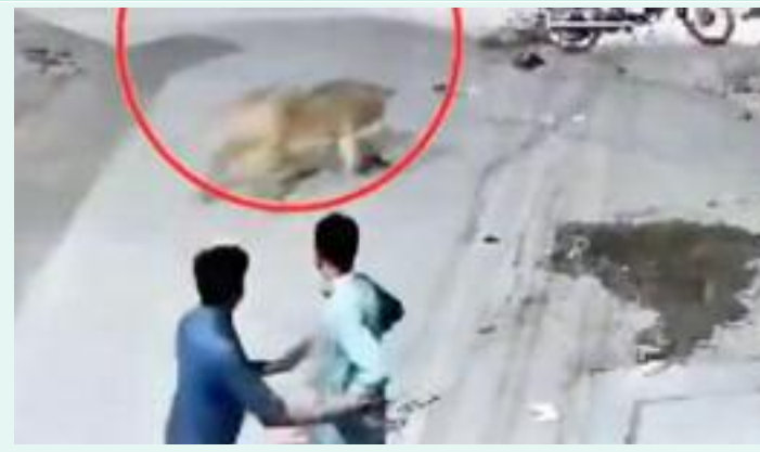
ਹੱਥਾਂ 'ਤੇ ਸੱਟਾਂ ਲੱਗੀਆਂ ਬੱਚਿਆਂ ਦੇ ਪਿਤਾ ਨੇ ਹਨ। ਪੁਲਿਸ ਅਨੁਸਾਰ, ਦੱਸਿਆ ਕਿ ਸ਼ੇਰ ਦਾ ਮਾਲਕ