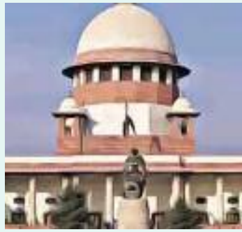
ਮੁਆਵਜ਼ੇ ਦੀ ਮੰਗ ਕਰਨ ਵਾਲੀ ਪਟੀਸ਼ਨ 'ਤੇ ਵਿਚਾਰ ਕਰਨ ਤੋਂ ਇਨਕਾਰ ਕਰ ਦਿਤਾ ਸੀ। ਪਰਿਵਾਰ ਦੀ ਮੁਆਵਜ਼ੇ ਦੀ ਮੰਗ

ਸੁਪਰੀਮ ਕੋਰਟ ਨੇ ਇੱਕ ਵਿਅਕਤੀ ਦੀ ਪਤਨੀ, ਪੁੱਤਰ ਅਤੇ ਮਾਪਿਆਂ ਦੁਆਰਾ ਮੰਗੇ ਗਏ 80 ਲੱਖ ਰੁਪਏ ਦਾ ਮੁਆਵਜ਼ਾ ਦੇਣ ਤੋਂ ਇਨਕਾਰ ਕਰ ਦਿਤਾ। ਵਿਅਕਤੀ ਦੀ ਮੌਤ ਤੇਜ਼ ਰਫ਼ਤਾਰ ਨਾਲ ਕਾਰ ਚਲਾਉਂਦੇ ਸਮੇਂ ਹੋਈ। ਅਪੀਲਕਰਤਾਵਾਂ ਨੇ ਕਰਨਾਟਕ ਹਾਈ ਕੋਰਟ ਦੇ ਹੁਕਮਾਂ ਵਿਰੁੱਧ ਸੁਪਰੀਮ ਕੋਰਟ ਦਾ ਰੁਖ਼ ਕੀਤਾ ਸੀ। ਪਿਛਲੇ ਸਾਲ ਨਵੰਬਰ ਵਿੱਚ, ਹਾਈ ਕੋਰਟ ਨੇ ਮ੍ਰਿਤਕ ਦੇ ਕਾਨੂੰਨੀ ਵਾਰਸਾਂ ਦੁਆਰਾ