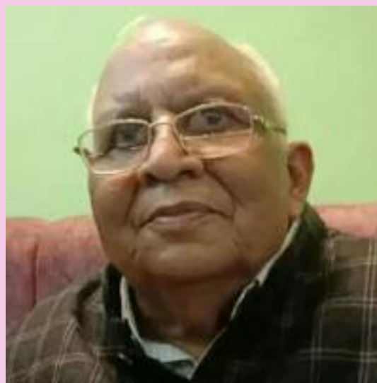
ਕੀਤਾ ਕਿ ਇਲਾਜ ਆਮ ਆਦਮੀ ਦੀ ਪਹੁੰਚ ਵਿੱਚ ਹੋਣਾ ਚਾਹੀਦਾ ਹੈ।