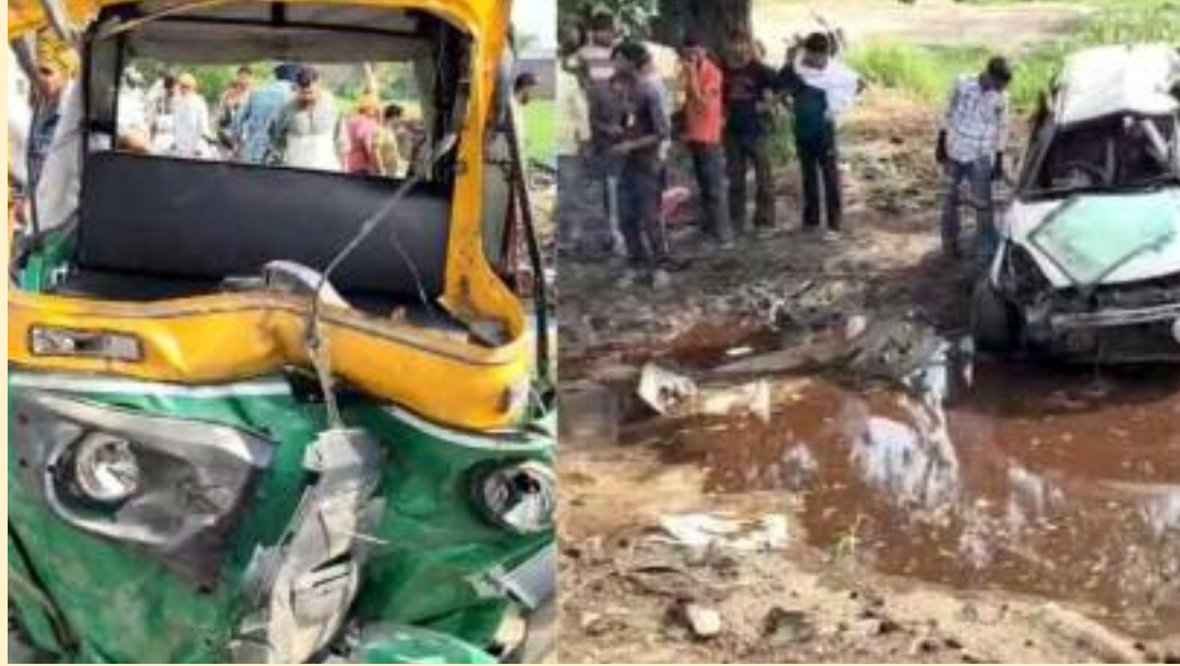
ਸਨ ਜਿਨਾਂ ਵਿੱਚੋਂ ਚਾਰ ਦੀ ਮੌਤ ਰੂਪ ਜ਼ਖਮੀਆਂ ਜਿਨਾਂ ਨੂੰ ਦਾਖਲ ਕਰਵਾਇਆ ਗਿਆ ਹੈ। ਹੋ ਚੁੱਕੀ ਹੈ ਤੇ ਬਾਕੀ ਗੰਭੀਰ ਇਲਾਜ ਦੇ ਲਈ ਹਸਪਤਾਲ ਵੀ ਉੱਥੇ ਉਹਨਾਂ ਦੱਸਿਆ ਕਿ

ਅੰਮ੍ਰਿਤਸਰ: ਅੰਮ੍ਰਿਤਸਰ ਅੱਜ ਅਨੁਸਾਰ ਇਹ ਹਾਦਸਾ ਆਟੋ ਦੁਪਹਿਰ ਤੋਂ ਬਾਅਦ ਅੰਮ੍ਰਿਤਸਰ ਤਰਨ ਤਰਨ ਰੋਡ 'ਤੇ ਟਾਹਲਾ ਸਾਹਿਬ ਗੁਰਦੁਆਰੇ ਦੇ ਨੇੜੇ ਇੱਕ ਕਾਰ ਤੇ ਆਟੋ ਦੀ ਭਿਆਨਕ ਟੱਕਰ ਹੋਣ ਦਾ ਮਾਮਲਾ ਸਾਹਮਣੇ ਆਇਆ ਜਿਸ ਦੇ ਚਲਦੇ ਆਟੋ ਵਿੱਚ ਸਵਾਰ ਚਾਰ ਲੋਕਾਂ ਦੀ ਮੌਤ ਹੋ ਗਈ ਤੇ ਬਾਕੀ ਗੰਭੀਰ ਰੂਪ ਜ਼ਖਮੀ ਹੋ ਗਏ ਦੱਸੇ ਜਾ ਰਹੇ ਹਨ। ਪ੍ਰਾਪਤ ਜਾਣਕਾਰੀ ਅਨੁਸਾਰ ਆਟੋ ਤੇ ਕਾਰ ਵਿਚਾਲੇ ਹੋਈ ਟੱਕਰ 'ਚ 5 ਵਿਅਕਤੀਆਂ ਦੀ ਮੌਤ ਅਤੇ 1 ਵਿਅਕਤੀ ਜ਼ਖਮੀ ਦੱਸਿਆ ਜਾ ਰਿਹਾ ਹੈ। ਜਾਣਕਾਰੀ ਦੇ