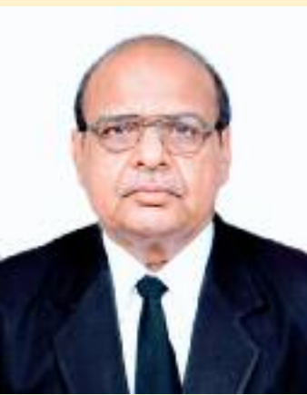
ਮਿੱਤਰ ਸੈਨ ਮੀਤ

2014 ਅਤੇ 2016-2019) ਬੋਰਡ ਦੀ ਇੱਕ ਵੀ ਮੀਟਿੰਗ ਨਹੀਂ ਹੋਈ। ਦਸੰਬਰ 2020 ਵਿਚ ਹੋਈ ਮੀਟਿੰਗ ਵਿਚ ਪ੍ਰਮੁੱਖ ਸਕੱਤਰ ਉਚੇਰੀ ਸਿੱਖਿਆ ਹਾਜ਼ਰ ਨਹੀਂ ਹੋਏ। ਇਨ੍ਹਾਂ ਨਿਯਮਾਂ ਅਨੁਸਾਰ ਸਲਾਹਕਾਰ ਬੋਰਡ ਦੇ ਮੈਂਬਰਾਂ ਦੀ ਜ਼ਿੰਮੇਵਾਰੀ, ਸਾਹਿਤ ਅਕਾਦਮੀ ਦਿੱਲੀ ਦੇ ਸਲਾਹਕਾਰ ਬੋਰਡ ਵਾਂਗ, ਭਾਸ਼ਾ ਵਿਭਾਗ ਵੱਲੋਂ ਦਿੱਤੇ ਜਾਂਦੇ ਸ਼੍ਰੋਮਣੀ ਪੁਰਸਕਾਰਾਂ ਲਈ ਯੋਗ ਉਮੀਦਵਾਰਾਂ ਦੇ ਨਾਂ ਕੇਵਲ ਸੁਝਾਉਣਾ ਹੈ। ਚੋਣ ਪ੍ਰਕ੍ਰਿਆ ਵਿਚ ਹਿੱਸਾ ਲੈਣਾ ਨਹੀਂ। ਇਹ ਨਿਯਮ ਤਾਂ ਬੋਰਡ ਦੇ ਮੈਂਬਰ ਨੂੰ ਕਿਸੇ ਉਮੀਦਵਾਰ ਦੇ ਹੱਕ ਵਿਚ ਪ੍ਰਚਾਰ ਕਰਨ ਤੱਕ ਦੀ ਇਜਾਜ਼ਤ ਨਹੀਂ ਦਿੰਦੇ। ਪ੍ਰਚਾਰ ਕਰਦਾ ਫੜੇ ਜਾਣ ਤੇ ਮੈਂਬਰ ਨੂੰ ਪਹਿਲਾਂ ਮੈਂਬਰੀ ਤੋਂ ਮੁਅੱਤਲ ਕਰਨ ਅਤੇ ਫੇਰ ਦੋਸ਼ ਸਿੱਧ ਹੋਣ ਤੇ ਬਰਖਾਸਤ ਕਰਨ ਤੱਕ ਦੀ ਵਿਵਸਥਾ ਕਰਦੇ ਹਨ। ਦੂਜੇ ਪਾਸੇ ਇਨ੍ਹਾਂ ਦਿਨੀਂ ਭਾਸ਼ਾ ਵਿਭਾਗ ਵੱਲੋਂ ਪੁਰਸਕਾਰਾਂ ਲਈ ਸੁਝਾਏ ਉਮੀਦਵਾਰਾਂ ਵਿਚੋਂ ਤਿੰਨ-ਤਿੰਨ ਨਾਂ ਛਾਂਟ ਕੇ ਪੈਨਲ ਬਣਾਉਣ ਦੀ ਜ਼ਿੰਮੇਵਾਰੀ ਜਿਸ ਸਕਰੀਨਿੰਗ ਕਮੇਟੀ ਨੂੰ ਦਿੱਤੀ ਜਾਂਦੀ ਹੈ ਉਸ ਕਮੇਟੀ ਦੇ ਸਾਰੇ ਮੈਂਬਰ ਸਲਾਹਕਾਰ ਬੋਰਡ ਦੇ ਮੈਂਬਰ ਹੁੰਦੇ ਹਨ। ਇੱਥੇ ਹੀ ਬਸ ਨਹੀਂ। ਪੈਨਲਾਂ ਵਿਚੋਂ ਜਾਂ ਪੈਨਲਾਂ ਤੋਂ ਬਾਹਰ ਵੀ, ਪੁਰਸਕਾਰ ਦੇ ਹੱਕੀ ਇੱਕ ਉਮੀਦਵਾਰ ਦੀ ਚੋਣ ਵੀ ਸਲਾਹਕਾਰ ਬੋਰਡ ਵੱਲੋਂ ਹੀ ਕੀਤੀ ਜਾਂਦੀ ਹੈ। ਹਰ ਵਾਰ ਇਸ ਨਿਯਮ ਦੀ ਘੋਰ ਉਲੰਘਣਾ ਹੁੰਦੀ ਹੈ। ਉਲਟਾ ਸਲਾਹਕਾਰ ਬੋਰਡ ਦਾ, ਪੁਰਸਕਾਰਾਂ ਦੀ ਚੋਣ ਤੇ ਏਕਾ-ਅਧਿਕਾਰ ਹੋ ਗਿਆ ਹੈ। ਇਸ ਸਮੇਂ ਸਲਾਹਕਾਰ ਬੋਰਡ ਦਾ ਇੱਕੋ-ਇੱਕ ਕੰਮ ਪੁਰਸਕਾਰਾਂ ਲਈ ਉਮੀਦਵਾਰਾਂ ਦੀ ਚੋਣ ਕਰਨਾ ਰਹਿ ਗਿਆ ਹੈ। ਇਨ੍ਹਾਂ ਨਿਯਮਾਂ ਵਿਚ ਦਰਜ ਬਾਕੀ ਦੇ ਪੰਜ ਉਦੇਸ਼ਾਂ ਨੂੰ ਪੂਰੀ ਤਰ੍ਹਾਂ ਭੁਲਾ ਦਿੱਤਾ ਗਿਆ ਹੈ। ਭਾਸ਼ਾ ਵਿਭਾਗ ਵੱਲੋਂ ਹਰ ਸਾਲ, ਉਸ ਸਾਲ ਵਿਚ ਪ੍ਰਕਾਸ਼ਤ ਹੋਈਆਂ ਕੁਝ ਪੁਸਤਕਾਂ ਨੂੰ ਸਰਵੋਤਮ ਪੁਸਤਕ ਪੁਰਸਕਾਰ ਦਿੱਤਾ ਜਾਂਦਾ ਹੈ। ਇਨ੍ਹਾਂ ਨਿਯਮਾਂ ਅਨੁਸਾਰ, ਇਨ੍ਹਾਂ ਪੁਸਤਕਾਂ ਦਾ ਮੁਲਾਂਕਣ ਸਲਾਹਕਾਰ ਬੋਰਡ ਵੱਲੋਂ ਹੋਣਾ ਚਾਹੀਦਾ ਹੈ।