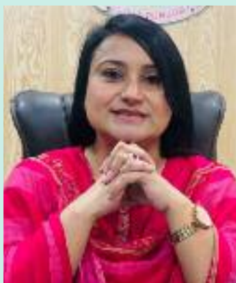
ਤੱਕ 42 ਬਾਲ ਵਿਆਹਾਂ ਨੂੰ ਸਮੇਂ

ਹੈ। ਉਨ੍ਹਾਂ ਕਿਹਾ ਕਿ ਸਰਕਾਰ ਦੀ ਚੋਕਸੀ ਅਤੇ ਪ੍ਰਭਾਵਸ਼ਾਲੀ ਰਣਨੀਤੀਆਂ ਸਦਕਾ ਸੂਬੇ ਭਰ ਵਿਚ ਬਾਲ ਵਿਆਹ ਵਰਗੇ ਅਣਮਨੁੱਖੀ ਅਮਲਾਂ ਨੂੰ ਰੋਕਣਾ ਸੰਭਵ ਹੋਇਆ ਹੈ। ਜ਼ਿਲ੍ਹਾ ਯੋਜਨਾ ਕਮੇਟੀ ਦੀ ਚੇਅਰਪਰਸਨ ਕਰਮਜੀਤ ਕੌਰ ਨੇ ਕਿਹਾ ਕਿ ਸਮਾਜਿਕ ਸੁਰੱਖਿਆ ਅਤੇ ਇਸਤਰੀ ਤੇ ਬਾਲ ਵਿਕਾਸ ਮੰਤਰੀ ਡਾ. ਬਲਜੀਤ ਕੌਰ ਦੀ ਅਗਵਾਈ ਹੇਠ ਵਿਭਾਗ ਵੱਲੋਂ ਜਨਵਰੀ 2024 ਤੋਂ ਦਸੰਬਰ 2024 ਤੱਕ 42 ਬਾਲ ਵਿਆਹਾਂ ਨੂੰ ਸਮੇਂ