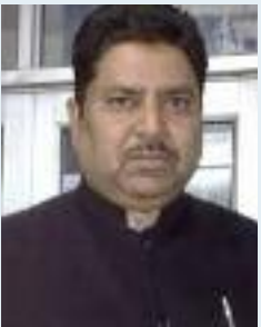
ਪੇਸ਼ਕਸ਼:-ਅਮਰਜੀਤ ਚੰਦਰ ਲੁਧਿਆਣਾ

ਬਾਹਰ ਜਾਣ ਲੱਗਾ ਤਾਂ ਲਾਲਟੈਣ ਦੀ ਰੌਸ਼ਨੀ ਵਿੱਚ ਉਸ ਦਾ ਪ੍ਰਫਾਵਾਂ ਕੰਧ ਤੇ ਦਿਖਾਈ ਦਿੱਤਾ। ਜਦੋਂ ਚਿਨ ਨੇ ਪ੍ਰਫਾਵਾਂ ਦੇਖਿਆ ਤਾਂ ਉਹ ਗੋਢਿਆਂ ਭਾਰ ਬੈਠ ਗਿਆ ਅਤੇ ਕਿਹਾ, 'ਸੁਭ ਰਾਤ ਮੇਰੇ ਪਿਤਾ ਜੀ।' ਚੇਨ ਇਹ ਸੱਭ ਸਮਝ ਗਿਆ ਸੀ ਕਿ ਦੂਸਰਾ ਪਿਤਾ ਸਿਰਫ਼ ਇਕ ਪ੍ਰਫਾਵਾਂ ਹੀ ਹੈ। ਲੀ ਨੇ ਸ਼ਾਇਦ ਚਿਨ ਨੂੰ ਖੁਸ਼ ਕਰਨ ਲਈ ਐਸਾ ਕੀਤਾ ਹੋਵੇ। ਉਸ ਨੇ ਆਪਣੀ ਠੋਡੀ ਨੂੰ ਛਾਤੀ ਨਾਲ ਦਬਾ ਲਿਆ ਤਾਂ ਫੁੱਟ-ਫੁੱਟ ਕੇ ਰੋਣ ਲੱਗਾ। ਉਸ ਨੇ ਹੈਰਾਨ ਚਿਨ ਨੂੰ ਦੱਸਿਆ ਕਿ ਉਹ ਉਸ ਦਾ ਪਿਤਾ ਹੀ ਹੈ ਜਿਹੜਾ ਵਿਦੇਸ਼ ਗਿਆ ਹੋਇਆ ਸੀ। ਬੱਚੇ ਨੂੰ ਹੌਸਲਾ ਦੇਣ ਲਈ ਲਾਲਟੈਣ ਦੇ ਸਾਹਮਣੇ ਉਹੀ ਗੱਲ ਦੁਹਰਾਈ। ਫਿਰ ਪਿਓ-ਪੁੱਤਰ ਇਕ ਦੂਜੇ ਨੂੰ ਗਲੇ ਲਗਾ ਕੇ ਕਾਫੀ ਦੇਰ ਤੱਕ ਲੀ ਨੂੰ ਯਾਦ ਕਰਕੇ ਰੋਂਦੇ ਰਹੇ। ਚੇਨ ਨੇ ਆਪਣੀ ਥੋੜੀ ਜਿਹੀ ਬਚਤ ਨਾਲ ਉਸੇ ਨਦੀ ਦੇ ਕੰਢੇ ਇਕ ਚੱਟਾਨ ਉੱਤੇ ਇਕ ਮੰਦਰ ਬਣਵਾਇਆ। ਹਰ ਰੋਜ਼ ਸ਼ਾਮ ਨੂੰ ਉਹ ਅਤੇ ਚਿਨ ਉਥੇ ਬੈਠਦੇ ਅਤੇ ਲੀ ਨੂੰ ਬਹੁਤ ਯਾਦ ਕਰਦੇ। ਉਹ ਸੋਚਦੇ ਹਨ ਕਿ ਲੀ ਉਥੇ ਹੈ। ਜਿਵੇਂ ਹੀ ਉਹ ਉਥੇ ਪਹੁੰਚਦੇ ਸਨ ਤਾਂ ਉਥੇ ਹੌਸਦੀ-ਹਸਾਉਂਦੀ ਉਹਨਾਂ ਦੇ ਕੋਲ ਆ ਕੇ ਬੈਠ ਜਾਂਦੀ।