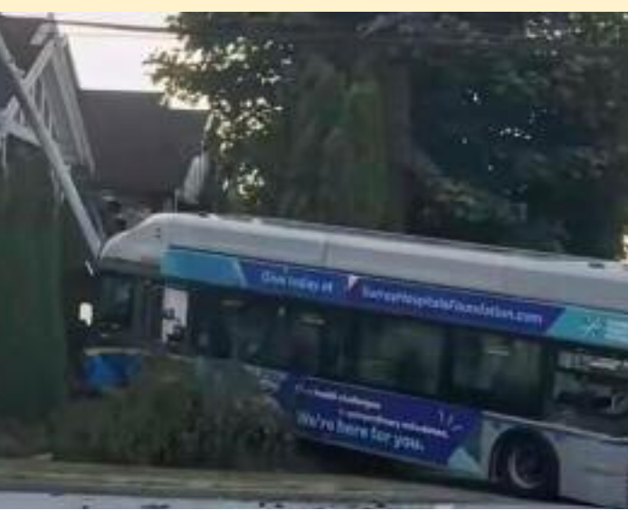
ਹਾਦਸੇ ਦੌਰਾਨ ਘਰ ਮੋਹਰਲੇ ਬਗੀਚੇ ਚ ਫਸੀ ਬਸ।

ਵੈਨਕੂਵਰ, ਜੁਲਾਈ (ਮਲਕੀਤ ਸਿੰਘ) - ਪੰਜਾਬੀਆਂ ਦੀ ਸੰਘਣੀ ਵੱਸੋਂ ਵਾਲੇ ਸਰੀ ਸ਼ਹਿਰ ਦੀ 132 ਸਟਰੀਟ ਅਤੇ 88 ਡਰਾਈਵਰ ਵੱਲੋਂ ਇੱਕ ਐਵਨਿਊ ਦੇ ਚੌਕ ਨੇੜੇ ਇੱਕ ਪਿੱਕ ਅੱਪ ਟਰੱਕ ਨਾਲ ਹਲਕੀ ਟੱਕਰ ਮਗਰੋਂ ਬੇਕਾਬੂ ਹੋਈ ਬੱਸ ਘਰ ਦੇ ਮੁੱਖ ਦਰਵਾਜ਼ੇ ਦੇ ਬਾਹਰਵਾਰ ਬਗੀਚੇ ਚ ਜਾ ਫਸੀ। ਇਸ ਹਾਦਸੇ ਸਮੇਂ ਇਸ