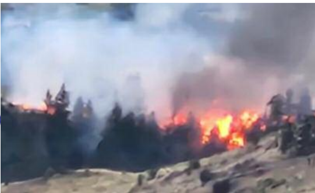
ਕੈਪਸਨ ਜੰਗਲਾਂ ਚ ਲੱਗੀ ਭਿਆਨਕ ਅੱਗ ਦੀ ਇੱਕ ਤਸਵੀਰ

ਵੈਨਕੂਵਰ, ਜੁਲਾਈ (ਮਲਕੀਤ ਸਿੰਘ) - ਕੈਨੇਡਾ ਦੇ ਬ੍ਰਿਟਿਸ਼ ਕੋਲੰਬੀਆ ਸੂਬੇ ਦੇ ਲੈਟਨ ਇਲਾਕੇ ਦੇ ਜੰਗਲੀ ਖੇਤਰ ਚ ਲੱਗੀ ਭਿਆਨਕ ਅੱਗ ਦਾ ਪ੍ਰਕੋਪ ਵੱਧ ਜਾਣ ਕਾਰਨ ਉੱਥੇ ਐਮਰਜੈਂਸੀ ਹਾਲਾਤਾਂ ਦਾ ਐਲਾਨ ਕਰ ਦਿੱਤਾ ਗਿਆ ਹੈ ਅਤੇ ਸਥਾਨਕ ਲੋਕਾਂ ਨੂੰ ਉੱਥੋਂ ਤੁਰੰਤ ਸੁਰੱਖਿਤ ਥਾਵਾਂ ਤੇ ਚਲੇ ਜਾਣ ਦੀ ਸਲਾਹ ਜਾਰੀ ਕੀਤੀ ਗਈ ਹੈ। ਤੇਜ਼ੀ ਨਾਲ ਫੈਲੀ ਇਸ ਭਿਆਨਕ ਅੱਗ ਦੇ ਕਾਬੂ ਪਾਉਣ ਲਈ ਸੰਬੰਧਿਤ ਅਧਿਕਾਰੀਆਂ ਵੱਲੋਂ ਬਚਾਅ ਕਾਰਜ ਲਗਾਤਾਰ ਜਾਰੀ ਹਨ।