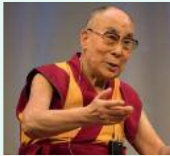
"ਮੈਂ ਪੁਸ਼ਟੀ ਕਰਦਾ ਹਾਂ ਕਿ ਦਲਾਈ ਲਾਮਾ ਦੀ ਸੰਸਥਾ ਜਾਰੀ ਰਹੇਗੀ ਅਤੇ ਮੈਂ ਦੁਹਰਾਉਂਦਾ ਹਾਂ ਕਿ ਗਡੋਨ

ਉਨ੍ਹਾਂ ਦੇ ਦਫਤਰ ਦੁਆਰਾ ਜਾਰੀ ਕੀਤੇ ਗਏ, ਦਲਾਈ ਲਾਮਾ ਨੇ ਕਿਹਾ ਕਿ ਗਡੋਨ ਫੋਡਰਾਂਗ ਟਰੱਸਟ ਨੂੰ ਭਵਿੱਖ ਦੇ ਦਲਾਈ ਲਾਮਾ ਨੂੰ ਮਾਨਤਾ ਦੇਣ ਦਾ ਪੂਰਾ ਅਧਿਕਾਰ ਹੈ। ਚੌਦਵੇਂ ਦਲਾਈ ਲਾਮਾ - ਤੇਨਜ਼ਿਨ ਗਿਆਤਸੋ, ਜਿਸ ਨੂੰ ਲਹਾਮਾ ਬੋਂਡੂਪ ਵੀ ਕਿਹਾ ਜਾਂਦਾ ਹੈ - ਦੇ 90ਵੇਂ ਜਨਮਦਿਨ ਲਈ ਜਸ਼ਨ 30 ਜੂਨ ਨੂੰ ਧਰਮਸ਼ਾਲਾ ਦੇ ਨੇੜੇ ਮੈਕਲਿਓਡਗੰਜ ਵਿੱਚ ਸੁਗਲਗਾਂਗ ਦੇ ਮੁੱਖ ਮੰਦਰ ਵਿੱਚ ਸ਼ੁਰੂ ਹੋਏ।