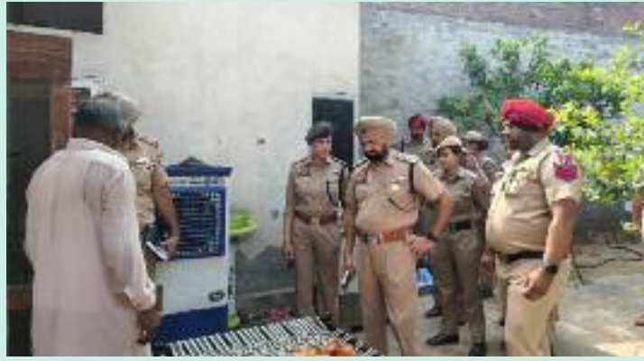
ਖ਼ਤਮ ਕਰਨ ਲਈ ਯੁੱਧ ਨਸ਼ਿਆਂ ਹੈ। ਉਨ੍ਹਾਂ ਕਿਹਾ ਕਿ ਨਸ਼ਿਆਂ ਨੂੰ ਵਿਰੁੱਧ ਮੁਹਿੰਮ ਸ਼ੁਰੂ ਕੀਤੀ ਗਈ ਪੁਲਿਸ ਇੱਕਲਿਆਂ ਖ਼ਤਮ ਨਹੀਂ