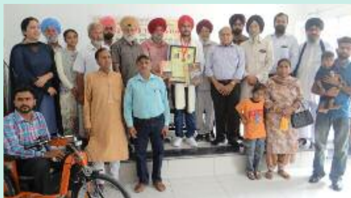
ਵੱਡਾ ਹੁੰਗਾਰਾ ਮਿਲ ਰਿਹਾ ਹੈ। ਤੂੰਗਾਂ ਦੀਆਂ ਇਹਨਾਂ