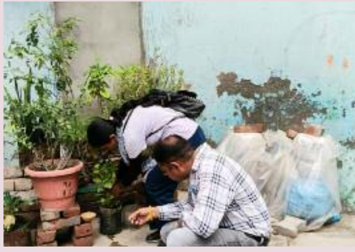
ਦੇ ਕੰਟੇਨਰ ਨੂੰ ਪਾਣੀ/ਮੀਂਹ ਦੇ ਪਾਣੀ ਆਦਿ ਨਾਲ ਨਾ ਭਰਿਆ ਜਾਵੇ ਅਤੇ