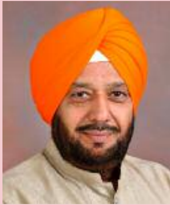
ਨਹਿਰੂ ਦਾ ਜੀਵਨ ਪੜ੍ਹੀਏ। ਉਹਨਾਂ ਕਿਹਾ ਕਿ ਸਿਆਸੀ ਨੇਤਾ ਦਾ ਜੀਵਨ ਸਮਾਜ ਲਈ ਮਿਸਾਲ