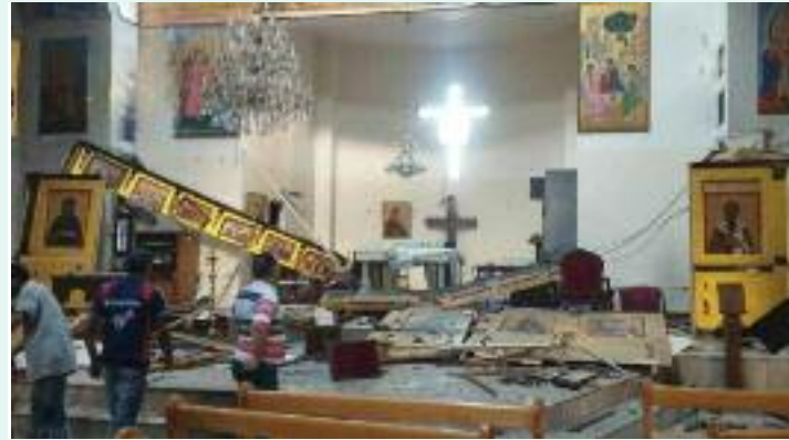
ਹੈਲਮੇਟਸ ਨੇ ਘਟਨਾ ਵਾਲੀ ਕੀਤੀ, ਜਿਸ ਵਿਚ ਚਰਚ ਦੇ ਥਾਂ ਤੋਂ ਲਾਈਵ ਸਟ੍ਰੀਮ ਅੰਦਰੋਂ ਤਬਾਹੀ ਦੇ ਦ੍ਰਿਸ਼

ਇਕ ਸੁਰੱਖਿਆ ਸੂਤਰ ਨੇ ਅਪਣਾ ਨਾਂ ਗੁਪਤ ਰੱਖਣ ਦੀ ਸ਼ਰਤ ਉੱਤੇ ਦਸਿਆ ਕਿ ਹਮਲੇ 'ਚ ਦੋ ਵਿਅਕਤੀ ਸ਼ਾਮਲ ਸਨ, ਜਿਨ੍ਹਾਂ ਵਿਚੋਂ ਇਕ ਨੇ ਖੁਦ ਨੂੰ ਉਡਾ ਲਿਆ ਸੀ। ਸੀਰੀਆ ਦੀ ਸਰਕਾਰੀ ਸਮਾਚਾਰ ਏਜੰਸੀ ਨੇ ਸਿਹਤ ਮੰਤਰਾਲੇ ਦੇ ਹਵਾਲੇ ਨਾਲ ਮ੍ਰਿਤਕਾਂ ਦੀ ਗਿਣਤੀ 9 ਦੱਸੀ ਹੈ ਅਤੇ 13 ਜ਼ਖਮੀ ਹੋਏ ਹਨ। ਸੀਰੀਆ ਦੇ ਸਿਵਲ ਡਿਫੈਂਸ ਵ੍ਹਾਈਟ