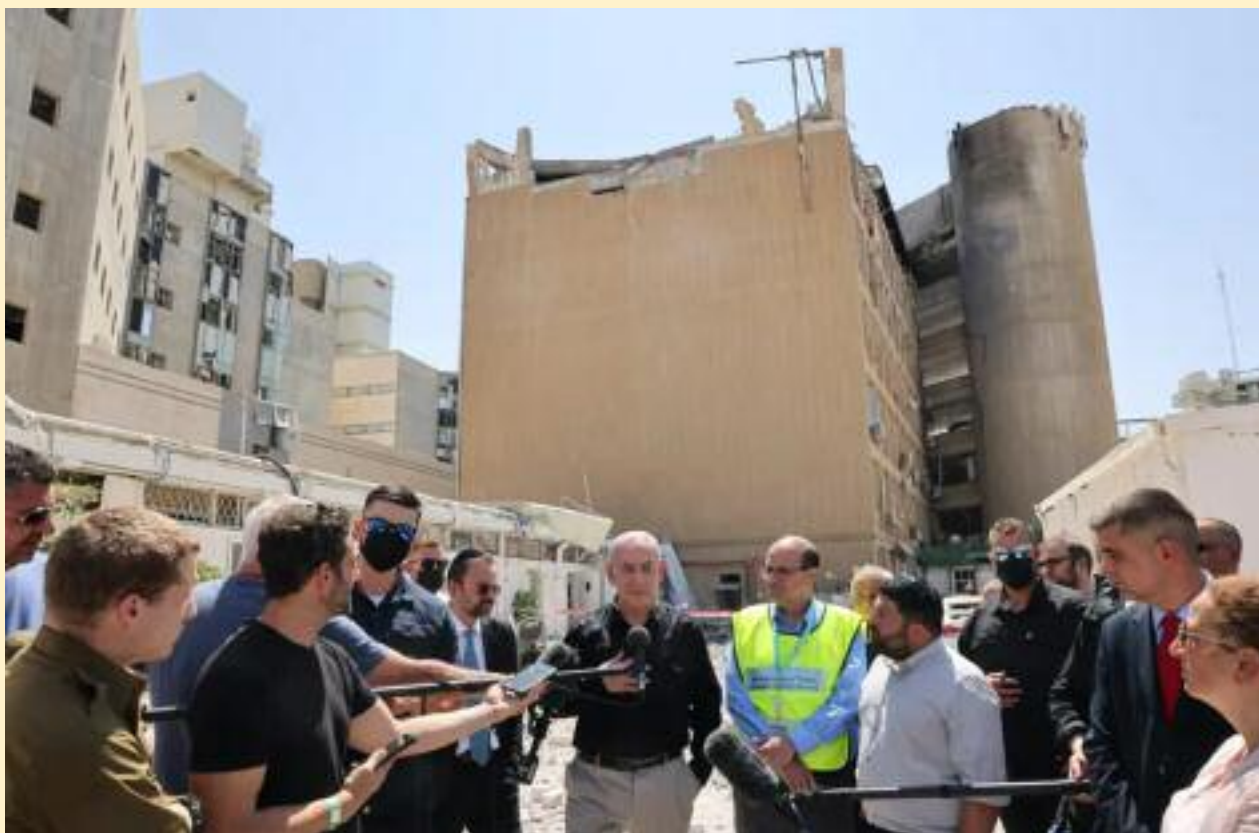
ਬੋਲਣ ਵਿੱਚ ਨਹੀਂ ਬਲਕਿ ਕਰ ਕੇ ਦਿਖਾਉਣ ਵਿੱਚ ਯਕੀਨ ਰੱਖਦਾ ਹਾਂ।" ਉਨ੍ਹਾਂ ਕਿਹਾ, "ਜੰਗ ਦੌਰਾਨ,

ਯੇਰੋਸ਼ਲਮ। ਇਜ਼ਰਾਇਲੀ ਪ੍ਰਧਾਨ ਮੰਤਰੀ ਬੈਂਜਾਮਿਨ ਨੇਤਨਯਾਹੂ ਨੇ ਵੀਰਵਾਰ ਨੂੰ ਕਿਹਾ ਕਿ ਇਜ਼ਰਾਇਲੀ ਹਮਲਿਆਂ ਤੋਂ 'ਕੋਈ ਵੀ ਬੱਚ ਨਹੀਂ' ਸਕਦਾ। ਨੇਤਨਯਾਹੂ ਨੇ ਇਸ਼ਾਰਾ ਕੀਤਾ ਕਿ ਇਰਾਨ ਦੇ ਸੁਪਰੀਮ ਆਗੂ ਅਯਾਤੁੱਲਾ ਅਲੀ ਖਮੇਨੀ ਵੀ 'ਨਿਸ਼ਾਨੇ' ਉੱਤੇ ਹੋ ਸਕਦੇ ਹਨ। ਇਜ਼ਰਾਇਲੀ ਪ੍ਰਧਾਨ ਮੰਤਰੀ ਨੇ ਇਹ ਟਿੱਪਣੀਆਂ ਮੁਲਕ ਦੇ ਦੱਖਣੀ ਸ਼ਹਿਰ ਬੀਰਸ਼ੇਬਾ ਵਿੱਚ ਸੋਰੋਕਾ ਮੈਡੀਕਲ ਸੈਂਟਰ ਦੀ ਫੇਰੀ ਮੌਕੇ ਪੱਤਰਕਾਰਾਂ ਦੇ ਇਕ ਸਵਾਲ ਨੂੰ ਲੈ ਕੇ ਕੀਤੀਆਂ। ਇਰਾਨ ਨੇ ਵੀਰਵਾਰ ਸਵੇਰੇ ਮਿਜ਼ਾਈਲ ਹਮਲੇ ਕਰਕੇ ਮੈਡੀਕਲ ਸੈਂਟਰ ਨੂੰ ਨਿਸ਼ਾਨਾ ਬਣਾਇਆ। ਯਹੂਦੀ ਮੁਲਕ ਵੱਲੋਂ ਸ਼ੁੱਕਰਵਾਰ ਨੂੰ ਸ਼ੁਰੂ ਕੀਤੇ Operaitoni Risng iLon ਮਗਰੋਂ ਇਰਾਨ ਹੁਣ ਤੱਕ ਇਜ਼ਰਾਈਲ 'ਤੇ ਚਾਰ ਸੌ ਤੋਂ ਵਧ ਬੈਲਸਟਿਕ ਮਿਜ਼ਾਈਲਾਂ ਤੇ ਹਜ਼ਾਰ ਤੋਂ ਵਧ ਡਰੋਨ ਦਾਗ ਚੁੱਕਾ ਹੈ। ਨੇਤਨਯਾਹੂ ਨੇ ਕਿਹਾ, "ਮੈਂ ਹਦਾਇਤਾਂ ਦਿੱਤੀਆਂ ਹਨ ਕਿ ਕਿਸੇ ਨੂੰ ਵੀ ਬਖਸ਼ਿਆ ਨਾ ਜਾਵੇ। ਮੈਂ