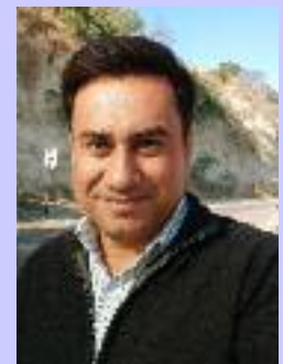
ਦੀਦਾਵਰ ਲੋਕਾਈਨਾਮਾ ਸੰਪਰਕ : ਸਰੂਪ ਨਗਰ ਰਾਓਵਾਲੀ, ਦੋਆਬਾ.

ਬਜ਼ੁਰਗਾਂ ਤੇ ਖੁਦ ਮੈਂ ਵੀ ਜਜਮਾਨਾਂ ਨੂੰ ਇਹ ਕਹਿੰਦਾ ਰਿਹਾ ਕਿ ਜਿਥੋਂ ਜੇਲੂ ਦੀ ਰੋਟੀ ਮਿਲੇ, ਖਾ ਲਿਆ ਕਰੋ, ਇਵੇਂ ਅਪਰਾਧ ਕੀਤਾ ਹੋਣ ਉੱਤੇ ਵੀ ਕੈਦ ਨਹੀਂ ਬੋਲਦੀ..! ਭਾਵੇਂ ਕੁਸ਼ ਕੀਤਾ ਹੋਵੇ ਪਰ ਏਸ ਵਹਿਮ ਤਹਿਤ ਏਨਾ ਕਾਰੋਬਾਰ ਚੱਲਦਾ ਹੋਵੇਗਾ, ਇਹ ਨਹੀਂ ਸੀ ਪਤਾ. ਚੱਲ ਸਾਡੀ ਚਿੱਕੀ ਨੂੰ ਵੀ ਇਹ ਖ਼ਬਰ ਆਖ ਸੁਣਾ. ਓਹਨੂੰ ਵੀ ਪੱਕਾ ਚੈਨ ਪਵੇ. ਮਥਰੇ, ਇਹ ਸਭ ਸੁਣ ਕੇ ਧੀ ਦੇ ਸੁਖਾਲੇ ਭਵਿੱਖ ਦੇ ਸੁਪਨਿਆਂ ਵਿਚ ਗੁਆਚਦੀ ਜਾ ਰਹੀ ਸੀ..!