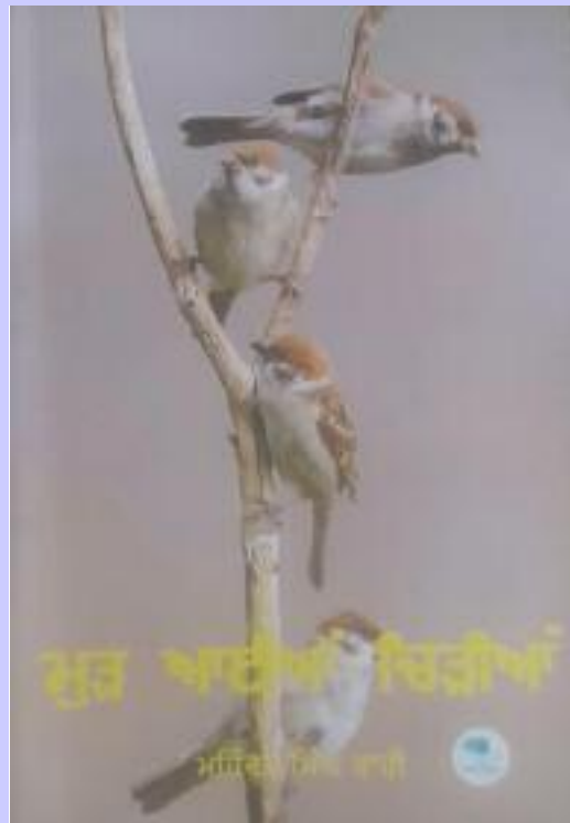
ਅਤੇ ਬੱਡਬਰ ਦੇ ਫਾਰਮਾਂ ਵਿੱਚ ਨਰ ਮਾਦੇ ਆਦਿ ਦੀ ਗਿਣਤੀ ਦੇ ਚਾਰਟ ਵੀ ਸ਼ਾਮਲ ਕੀਤੇ ਹਨ। ਪੁਸਤਕ ਵਿੱਚ ਸਪੇਨ, ਯੂਨਾਨ ਅਤੇ ਉੱਤਰੀ ਅਫਰੀਕਾ ਦੇ ਕੁਝ ਭਾਗਾਂ ਵਿੱਚ