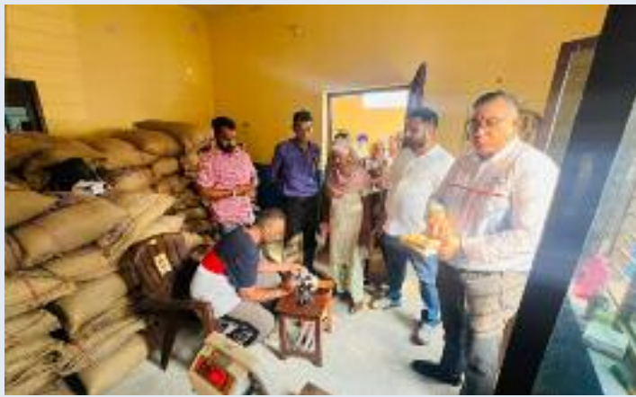
ਦੱਸਿਆ ਕਿ ਸਰਕਾਰ ਅਪ੍ਰੈਲ ਤੋਂ ਜੂਨ ਤੱਕ ਤਿੰਨ ਮਹੀਨਿਆਂ ਦੀ ਮਿਆਦ ਲਈ ਕਣਕ ਵੰਡ ਯੋਜਨਾ