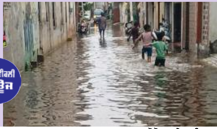
ਪ੍ਰਾਇਮਰੀ ਸਕੂਲ ਵਿੱਚ ਖੜੇ ਪਾਣੀ ਦਾ ਦ੍ਰਿਸ਼।