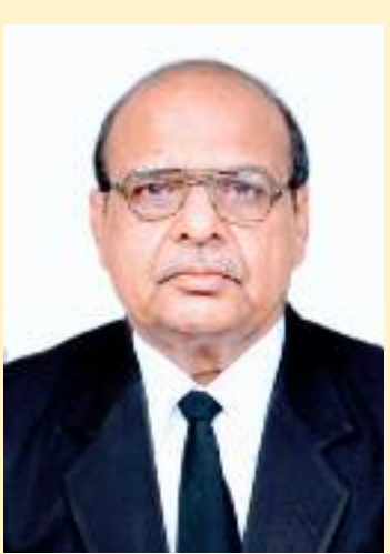
ਮਿੱਤਰ ਸੈਨ ਮੀਤ offices of the State Government public sector

ਫੈਸਲੇ ਹੁੰਦੇ ਹਨ। ਪੰਜਾਬੀ ਪਾਠ ਨੂੰ ਮਹੱਤਤਾ ਨਹੀਂ ਦਿੱਤੀ ਜਾਂਦੀ। ਅੰਗਰੇਜ਼ੀ ਪਾਠ ਦੇ ਅਧਾਰ ਤੇ ਮੁਕਦਮੇ ਦਾ ਫੈਸਲਾ ਕਰਦੇ ਸਮੇਂ ਅਦਾਲਤ ਕਹਿੰਦੀ ਹੈ ਕਿ ਕਾਨੂੰਨ ਅਨੁਸਾਰ ਕੇਵਲ ਦਫ਼ਤਰੀ ਚਿੱਠੀ ਪੱਤਰ ਹੀ ਪੰਜਾਬੀ ਵਿੱਚ ਹੋਣਾ ਜ਼ਰੂਰੀ ਹੈ ਨਾ ਕਿ ਸਾਰਾ ਦਫ਼ਤਰੀ ਕੰਮਕਾਜ। -- ਇੰਝ ਇੱਕ ਘਟੀਆ ਅਨੁਵਾਦ ਕਾਰਨ ਅਸੀਂ ਜਿੱਤੀ ਬਾਜ਼ੀ ਹਾਰ ਰਹੇ ਹਾਂ। ਹਵਾਲੇ: ਅੰਗਰੇਜ਼ੀ ਪਾਠ ਵਿੱਚ ਧਾਰਾ 3-ਬੀ Seciton 3-B : "... In all