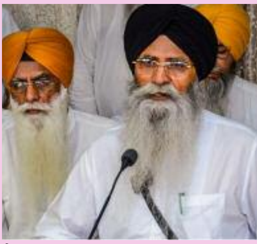
ਉਨ੍ਹਾਂ ਕਿਹਾ ਕਿ ਉਸਾਰੀ ਕਾਰਜ ਜੰਗੀ ਪੱਧਰ 'ਤੇ ਜਾਰੀ ਹਨ, ਉਥੇ ਸਫਲ ਆਪ੍ਰੋਜੈਕਟ ਹੋ ਰਹੇ ਹਨ। ਇਹ ਸਾਰੇ ਕਾਰਜ ਸਿੱਖਾਂ ਦੇ ਭਲੇ ਲਈ ਹਨ।