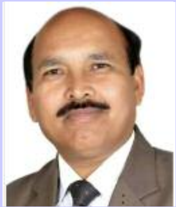
ਸਮਾਜ ਅਤੇ , ਭਾਰਤ ਵਿਰੋਧੀ

ਤਾਕਤਾਂ ਐਸੀ ਸਮਾਜ ਅਤੇ ਆਗੂ ਨੇ ਕਿਹਾ ਕਿ ਪੰਜਾਬ ਸਿੱਖ ਭਾਈਚਾਰੇ ਅੰਦਰ ਗੁਰੂਆਂ, ਪੀਰਾਂ, ਵਿਦਵਾਨਾਂ, ਨਫਰਤ ਦੇ ਬੀਜ ਬੀਜ ਕੇ ਯੋਧਿਆਂ ਦੀ ਧਰਤੀ ਹੈ ਜਿਨ੍ਹਾਂ ਆਪਸੀ ਭਾਈਚਾਰਕ ਸਾਂਝ ਨੇ ਦੇਸ਼ ਵਾਸੀਆਂ ਨੂੰ ਜਿਥੇ ਅਤੇ ਏਕਤਾ,ਅਮਨ ਸ਼ਾਂਤੀ ਦੇ ਸ਼ਾਂਤੀ ਅਤੇ ਮਾਹੌਲ ਨੂੰ ਲਾਂਬੂ ਲਗਾਉਣ ਦੀ ਭਾਈਚਾਰਕ ਸਾਂਝ ਬਣਾਕੇ ਕੋਸ਼ਿਸ਼ ਕਰ ਰਹੇ ਹਨ, ਰਹਿਣ ਦਾ ਰਸਤਾ ਦੱਸਿਆ ਹੈ ਇਸ ਕਰਕੇ ਪੰਜਾਬ ਵਾਸੀਆਂ ਨੂੰ ਅਜਿਹੀਆਂ ਲਾਂਬੂ ਲਾਉਣ ਵਾਲੀਆਂ ਤਾਕਤਾਂ ਤੋਂ ਸਾਵਧਾਨ ਰਹਿਣਾ ਚਾਹੀਦਾ ਹੈ। ਬਸਪਾ ਆਗੂ ਨੇ ਕਿਹਾ ਕਿ ਸਰਕਾਰਾਂ ਵਿੱਚ ਬੈਠੇ ਸਵਾਰਥੀ ਤੇ ਲਾਲਚੀ ਲੋਕਾਂ ਦੀਆਂ ਨਾਕਾਮੀਆਂ ਨੇ ਬਾਬਾ ਸਾਹਿਬ ਜੀ ਦਾ ਅਪਮਾਨ ਕਰਕੇ ਕੋੜਾਂ ਦਲਿਤਾਂ, ਗਰੀਬਾਂ ਦੀਆਂ ਧਾਰਮਿਕ, ਸਮਾਜਿਕ ਤੇ ਰਾਜਨੀਤਕ ਭਾਵਨਾਵਾਂ ਨੂੰ ਕੁਚਲ ਕੇ ਰੱਖ ਦਿੱਤਾ ਹੈ, ਜਿਸਨੂੰ ਬਹੁਜਨ ਸਮਾਜ ਪਾਰਟੀ ਬਰਦਾਸ਼ਤ ਨਹੀਂ ਕਰੇਗੀ।