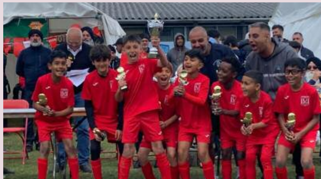
FC KHALSA LEICESTER WINNERS UNDER 9 WALSALL TOURNAMENT 2025

ਵਾਲਸਾਲ (ਸਮਾਜ ਵੀਕਲੀ)- ਇਸ ਸਾਲ ਦਾ ਪਹਿਲਾ ਫੁੱਟਬਾਲ ਟੂਰਨਾਮੈਂਟ ਐਸਟਨ ਯੂਨੀਵਰਸਿਟੀ ਪਲੇਇੰਗ ਫੀਲਡਜ਼, ਬਰਮਿੰਘਮ ਰੋਡ, ਵਾਲਸਾਲ ਵਿਖੇ ਸਨਿ-ਚਰਵਾਰ 24 ਮਈ ਅਤੇ ਐਤਵਾਰ 25 ਮਈ ਨੂੰ ਸਵੇਰੇ 8.00 ਵਜੇ ਤੋਂ ਸ਼ਾਮ ਦੇ 6.00 ਵਜੇ ਵਾਲਸਾਲ ਏਸ਼ੀਅਨ ਸਪੋਰਟਸ ਅਸੋਸੀਏਸ਼ਨ ਅਤੇ ਖਾਲਸਾ ਫੁੱਟਬਾਲ ਫੈਡਰੇਸ਼ਨ ਦੇ ਸਿਹਯੋਗ ਨਾਲ ਕਰਵਾਇਆ ਗਿਆ ਜਿਸ ਵਿੱਚ ਤਕਰੀਬਨ 70 ਟੀਮਾਂ ਨੇ ਭਾਗ ਲਿਆ ਅਤੇ ਹਜ਼ਾਰਾਂ ਹੀ ਫੁੱਟਬਾਲ ਖੇਡ ਪ੍ਰੇਮੀਆਂ ਨੇ ਅਨੰਦ ਮਾਣਿਆ। ਪਰ ਮੀਅਰ ਡਿਵਿਯਨ ਦਾ ਫਾਈਨਲ ਲੈਸਟਰ ਦੀਆਂ ਜਾਣੀਆਂ