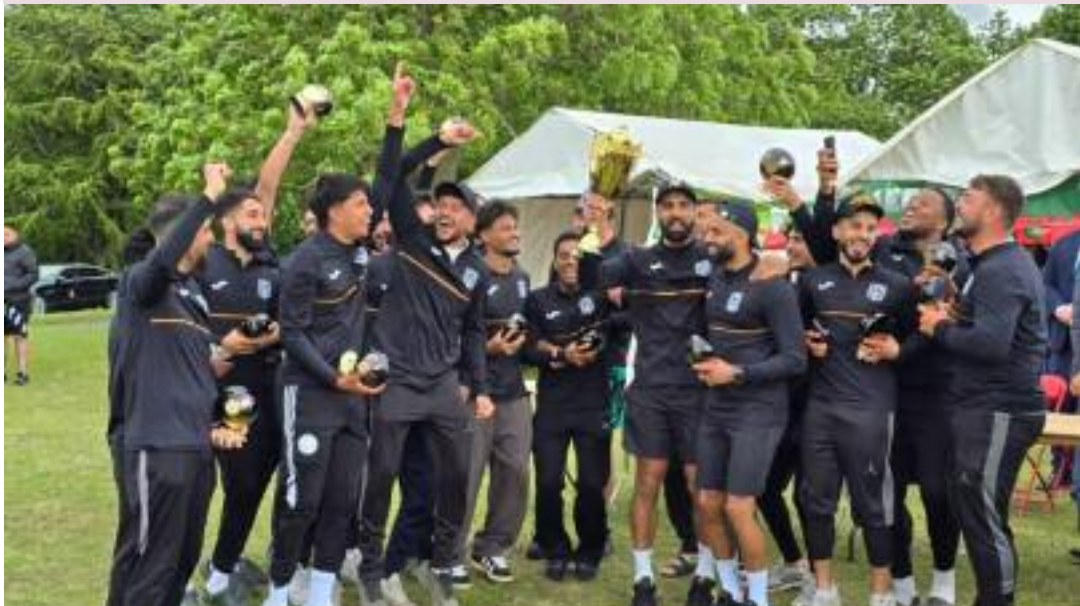
FC KHALSA LEICESTER WINNERS OF WALSALL FOOTBALL TOURNAMENT 2025