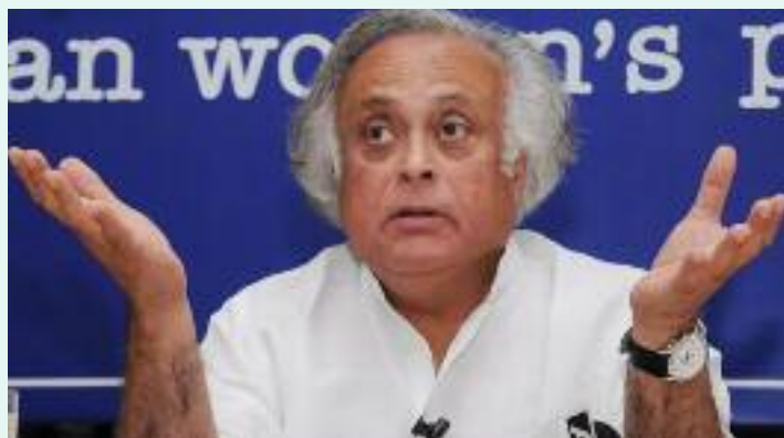
ਉਨ੍ਹਾਂ ਬੀਤੇ ਦਿਨ ਕਿਹਾ, "ਅੱਜ, ਭਾਜਪਾ ਪ੍ਰਧਾਨ ਜੇ. ਪੀ. ਨੱਡਾ ਨੂੰ +11 ਸਾਲ ਦੇ ਚੱਕੀ ਦੇ ਪੱਥਰ (ਮੀਲ ਪੱਥਰ ਨਹੀਂ) ਨੂੰ ਉਜਾਗਰ

ਉਨ੍ਹਾਂ ਨੂੰ ਸਵਾਲ-ਜਵਾਬ ਕਰ ਸਕਣ। ਕਾਂਗਰਸ ਦੇ ਜਨਰਲ ਸਕੱਤਰ ਇੰਦਰਜ ਸੰਚਾਰ ਜੈਰਾਮ ਰਮੇਸ਼ ਨੇ ਕਿਹਾ ਕਿ ਪਾਰਟੀ ਨੇ ਪ੍ਰਧਾਨ ਮੰਤਰੀ ਨੂੰ ਉਨ੍ਹਾਂ ਦੇ 11 ਸਾਲ ਦਕ ਕਾਰਜਕਾਲ ਦੇ ਪੂਰੇ ਹੋਣ 'ਤੇ ਆਪਣੀ ਪਹਿਲੀ 'ਅਣਲਿਖਤ ਤੇ ਅਗਾਊਂ ਪਟਕਥਾ ਰਹਿਤ' ਪ੍ਰੈਸ ਕਾਨਫਰੰਸ ਕਰਨ ਦੀ ਚੁਣੌਤੀ ਦਿੱਤੀ ਹੈ। ਭਾਵ ਅਜਿਹੀ ਪ੍ਰੈਸ ਕਾਨਫਰੰਸ ਜਿਸ ਦੇ ਸਵਾਲ ਤੇ ਜਵਾਬ ਪਹਿਲਾਂ ਤਿਆਰ ਨਾ ਕੀਤੇ ਗਏ ਹੋਣ।