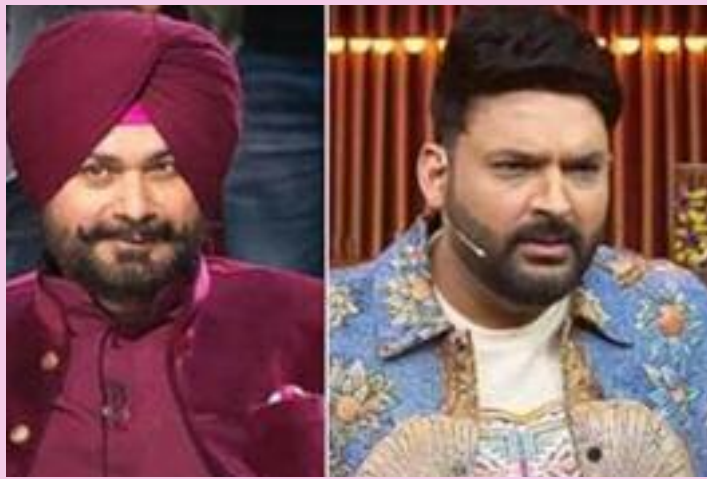
ਸ਼ਨੀਵਾਰ ਰਾਤ 8 ਵਜੇ ਸ਼ੁਰੂ ਹੋ ਰਿਹਾ ਹੈ। ਨਵਜੋਤ ਸਿੰਘ ਸਿੱਧੂ ਨੇ ਹਾਲ ਹੀ ਵਿੱਚ ਆਪਣੇ ਸੋਸ਼ਲ ਮੀਡੀਆ ਅਕਾਊਂਟ 'ਤੇ ਇੱਕ ਵੀਡੀਓ ਸਾਂਝਾ ਕਰਕੇ ਆਪਣੀ ਵਾਪਸੀ ਦੀ ਪੁਸ਼ਟੀ ਕੀਤੀ।

ਚੰਡੀਗੜ੍ਹ। ਪੰਜਾਬ ਕਾਂਗਰਸ ਦੇ ਨੇਤਾ ਅਤੇ ਸਾਬਕਾ ਕ੍ਰਿਕਟਰ ਨਵਜੋਤ ਸਿੰਘ ਸਿੱਧੂ 5 ਸਾਲਾਂ ਦੇ ਲੰਬੇ ਵਕਫ਼ੇ ਤੋਂ ਬਾਅਦ ਦ ਗ੍ਰੇਟ ਇੰਡੀਅਨ ਕਪਿਲ ਸ਼ਰਮਾ ਸ਼ੋਅ ਵਿੱਚ ਵਾਪਿਸ ਆ ਰਹੇ ਹਨ। ਸ਼ੋਅ ਦਾ ਤੀਜਾ ਸੀਜ਼ਨ 21 ਜੂਨ, 2025 ਨੂੰ ਨੈੱਟਫਲਿਕਸ 'ਤੇ ਪ੍ਰੀਮੀਅਰ ਹੋਵੇਗਾ। ਜਿਸ ਵਿੱਚ ਕਪਿਲ ਸ਼ਰਮਾ ਅਤੇ ਨਵਜੋਤ ਸਿੰਘ ਸਿੱਧੂ ਦੀ ਜੋੜੀ ਇਕੱਠੇ ਦਿਖਾਈ ਦੇਵੇਗੀ। ਦੱਸ ਦੇਈਏ ਕਿ ਨੈੱਟਫਲਿਕਸ ਨੇ ਆਪਣੇ ਸੋਸ਼ਲ ਮੀਡੀਆ ਪੇਜ 'ਤੇ ਇਹ ਜਾਣਕਾਰੀ ਦਿੱਤੀ ਹੈ। 'ਦ ਗ੍ਰੇਟ ਇੰਡੀਅਨ ਕਪਿਲ ਸ਼ੋਅ' ਦਾ ਨਵਾਂ ਸੀਜ਼ਨ ਜੇ 21 ਜੂਨ ਤੋਂ ਹਰ