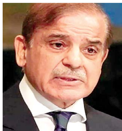
ਬਾਰੇ ਕੈਬਨਿਟ ਕਮੇਟੀ ਨੇ ਸਿੰਧੂ ਜਲ ਸੰਧੀ ਨੂੰ

ਸਰਕਾਰੀ ਸੂਤਰਾਂ ਅਨੁਸਾਰ, ਪਾਕਿਸਤਾਨ ਦੇ ਜਲ ਸਰੋਤ ਮੰਤਰਾਲੇ ਵੱਲੋਂ ਹੁਣ ਤੱਕ ਚਾਰ ਪੱਤਰ ਭੇਜੇ ਜਾ ਚੁੱਕੇ ਹਨ ਅਤੇ ਇਨ੍ਹਾਂ ਸਾਰਿਆਂ ਵਿੱਚ ਸਮਝੌਤੇ ਨੂੰ ਬਹਾਲ ਕਰਨ ਦੀ ਬੇਨਤੀ ਸੀ। ਚੌਥੀ ਚਿੱਠੀ ਇਸ ਹਫਤੇ ਆਈ। ਲਗਭਗ ਸਾਰਿਆਂ ਵਿੱਚ, ਪਾਕਿਸਤਾਨ ਨੇ ਸਿੱਕਾਇਤ ਕੀਤੀ ਹੈ ਕਿ ਇਸ ਨਾਲ ਉਸਦੇ ਦੇਸ਼ ਵਿੱਚ ਸਮੱਸਿਆਵਾਂ ਵਧੀਆਂ ਹਨ। ਸੂਤਰਾਂ ਦਾ ਕਹਿਣਾ ਹੈ ਕਿ ਜਲ ਸਕਤੀ ਮੰਤਰਾਲੇ ਨੇ ਇਹ ਪੱਤਰ ਵਿਦੇਸ਼ ਮੰਤਰਾਲੇ ਨੂੰ ਭੇਜੇ ਹਨ। 22 ਅਪ੍ਰੈਲ ਨੂੰ ਪਹਿਲਗਾਮ ਵਿੱਚ ਹੋਏ ਭਿਆਨਕ ਪਾਕਿਸਤਾਨ-ਪ੍ਰਯੋਜਿਤ ਅੱਤਵਾਦੀ ਹਮਲੇ ਤੋਂ ਬਾਅਦ, ਸੁਰੱਖਿਆ