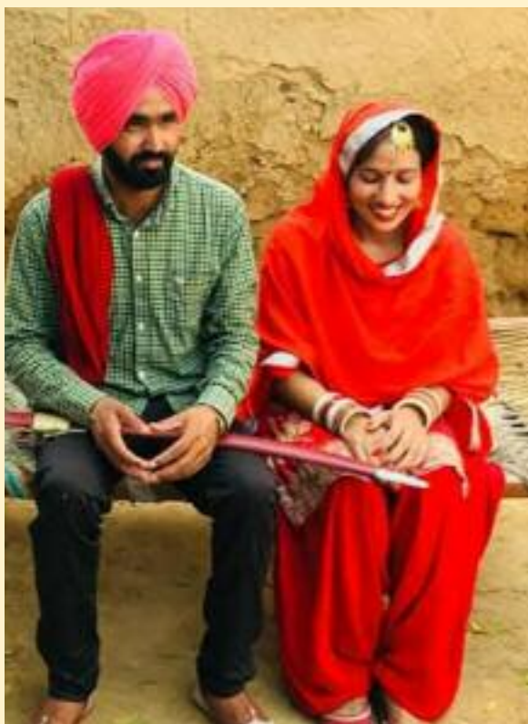
ਬੇਅੰਤ ਗਿੱਲ (ਭਲੂਰ)

'ਗਿੱਲ' ਚੁਰਾਅ ਕੇ ਸੁਪਨੇ ਮੇਰੀਆਂ ਚੀੜਾਂ ਦੇ, ਉਲਟਾ ਆਖੇ ਤੋੜੇ ਨੇ ਤੂੰ ਨਾਤੇ ਸੱਕੇ ਸੱਕੇ ।