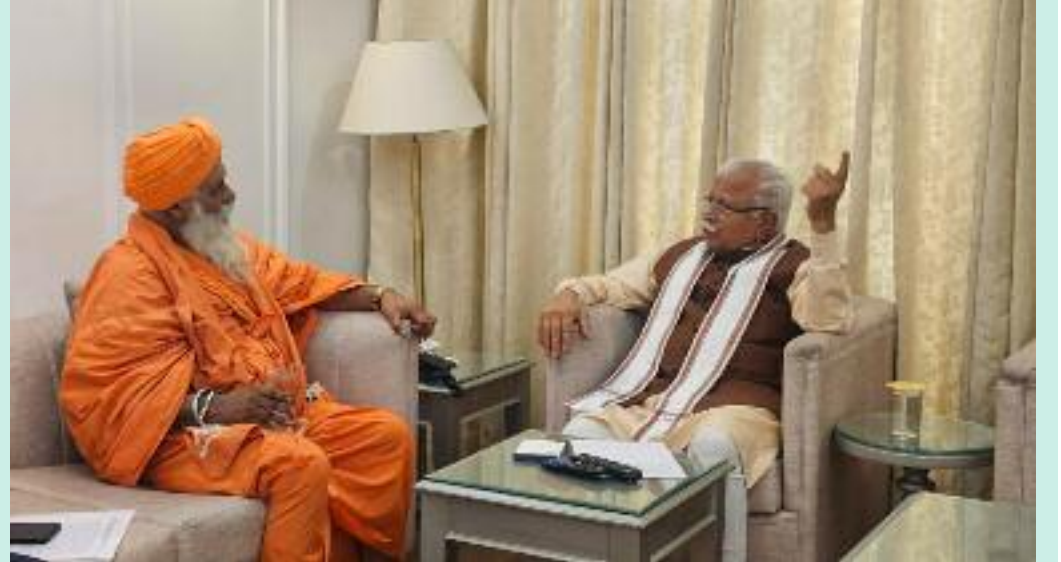
ਕੇਂਦਰੀ ਮੰਤਰੀ ਮਨੋਹਰ ਲਾਲ ਖੱਟਰ ਨਾਲ ਮੁਲਾਕਾਤ ਦੌਰਾਨ ਸੰਤ ਬਲਬੀਰ ਸਿੰਘ ਸੀਚੇਵਾਲ।

ਵੱਖ-ਵੱਖ ਸਕੀਮਾਂ ਰਾਹੀਂ ਸੁਲਤਾਨਪੁਰ ਲੋਧੀ ਦੀ ਬਦਲੀ ਜਾਵੇਗੀ ਨੁਹਾਰ