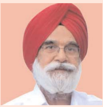
ਪੰਜਾਬੀ ਅਨੁਵਾਦ: ਰਵਿੰਦਰ ਸਿੰਘ ਸੋਢੀ

ਦੋ ਖੜੇ ਅੰਗੂਠੇ ਦੇ ਨਿਸ਼ਾਨ ਭੇਜ ਦਿੱਤੇ। ਹੌਲੀ-ਹੌਲੀ ਉਹ ਦੋਵੇਂ ਪਹਿਲਾਂ ਤਾਂ ਇਕ ਦੂਜੇ ਦੇ ਖਿਆਲਾਂ ਵਿਚ ਆਉਣ ਲੱਗੇ ਅਤੇ ਫੇਰ ਦਿਲ ਅੰਦਰ। ਇਹ ਕਿਸੇ ਨੂੰ ਵੀ ਨਹੀਂ ਸੀ ਪਤਾ ਕਿ ਇਕ ਦੂਜੇ ਨੂੰ ਦਿਲ ਦੇਣ ਦੀ ਸ਼ੁਰੂਆਤ ਕਿਸ ਵੱਲੋਂ ਹੋਈ ਸੀ, ਪਰ ਇਹ ਦੋਹਾਂ ਨੂੰ ਹੀ ਸਪਸ਼ਟ ਹੋ ਗਿਆ ਸੀ ਕਿ ਉਹ ਦੋਵੇਂ ਹੀ ਇਕ ਦੂਜੇ ਦੀ ਅੰਦਰੂਨੀ ਦੁਨੀਆਂ 'ਚ ਦਾਖਲ ਹੋ ਰਹੇ ਹਨ।