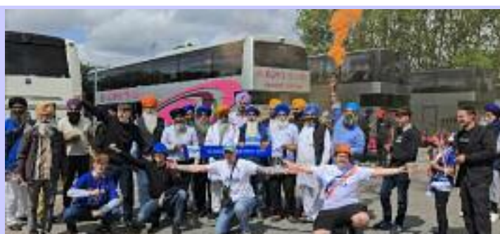
ਜੂਨ 1984 ਚ ਵਾਪਰੇ ਘੁਲੂਘਾਰੇ ਦੇ ਸਬੰਧ ਚ ਰੋਸ ਪ੍ਰਦਰਸ਼ਨ ਚ ਸ਼ਾਮਿਲ ਹੋਣ ਲਈ ਲੰਡਨ ਰਵਾਨਾ ਹੁੰਦੀਆਂ ਹੋਈਆਂ ਸਿੱਖ ਸੰਗਤਾਂ ਨਾਲ ਮਿਲ ਕੇ ਇਨਸਾਫ ਦੀ ਮੰਗ ਕਰਦੇ ਹੋਏ ਬ੍ਰਿਟਿਸ਼ ਲੋਕ (ਗੋਰੇ) ਅਤੇ ਹਾਜ਼ਿਰ ਵੱਡੀ ਗਿਣਤੀ ਚ ਸਿੱਖ ਸੰਗਤਾਂ।

ਤਰਾਫਲਗਰ ਸੁਕੇਅਰ ਪੁੱਜੀਆਂ। ਇਸ ਸਬੰਧ ਚ ਇੰਗਲੈਂਡ ਦੇ ਵੱਖ ਵੱਖ ਸ਼ਹਿਰਾਂ ਲੈਸਟਰ, ਬਰਮਿੰਘਮ, ਵੁਲਵਰਹੈਪਟਨ, ਕੁਵੈਂਟਰੀ, ਮਾਨਚੈਸਟਰ, ਨੌਟਿੰਘਮ, ਨੌਰਥਹੈਪਟਨ, ਡਰਬੀ, ਸਮੇਦਿਕ, ਸਮੇਤ ਵੱਖ ਵੱਖ ਸ਼ਹਿਰਾਂ ਦੇ ਗੁਰੂ ਘਰਾਂ ਤੋਂ ਵੱਡੀ ਗਿਣਤੀ ਚ ਸਿੱਖ ਸੰਗਤਾਂ ਬੱਸਾਂ ਅਤੇ ਹੋਰ ਵਾਹਨਾਂ ਤੇ ਸਵਾਰ ਹੋ ਕੇ ਲੰਡਨ ਦੇ ਤਰਾਫਲਗਰ ਸੁਕੇਅਰ ਪੁੱਜੀਆਂ। ਇੰਗਲੈਂਡ ਦੇ ਸ਼ਹਿਰ ਲੈਸਟਰ ਤੋਂ ਬੋਨ, ਗੁਰਦੁਆਰਾ ਸ੍ਰੀ ਗੁਰੂ ਤੇਗ