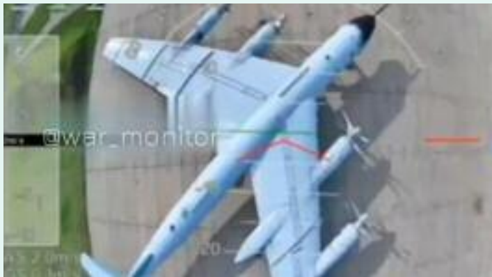
ਦਿੱਤਾ ਗਿਆ। ਪਹਿਲੀ ਵਾਰ, ਇਹ ਵੀ ਅਧਿਕਾਰਤ ਤੌਰ 'ਤੇ ਪੁਸ਼ਟੀ ਕੀਤੀ ਗਈ ਹੈ ਕਿ ਕੁਝ ਡਰੋਨ ਹਮਲੇ ਏਅਰਬੋਸ

ਰੱਖਿਆ ਮੰਤਰਾਲੇ ਨੇ ਯੂਕਰੇਨ 'ਤੇ ਮੁਰਮਾਂਸਕ, ਇਰਕੁਤਸਕ, ਇਵਾਨੋਵੋ, ਰਿਆਜ਼ਾਨ ਅਤੇ ਅਮੂਰ ਖੇਤਰਾਂ ਵਿੱਚ ਸਥਿਤ ਹਵਾਈ ਅੱਡਿਆਂ 'ਤੇ (ਫਸਟ ਪਰਸਨ ਵਿਊ) ਡਰੋਨਾਂ ਨਾਲ ਅੱਤਵਾਦੀ ਹਮਲੇ ਕਰਨ ਦਾ ਦੋਸ਼ ਲਗਾਇਆ। ਮੰਤਰਾਲੇ ਨੇ ਕਿਹਾ ਕਿ ਇਵਾਨੋਵੋ, ਰਿਆਜ਼ਾਨ ਅਤੇ ਅਮੂਰ ਖੇਤਰਾਂ ਵਿੱਚ ਫੌਜੀ ਏਅਰਬੋਸਾਂ 'ਤੇ ਸਾਰੇ ਅੱਤਵਾਦੀ ਹਮਲਿਆਂ ਨੂੰ ਨਾਕਾਮ ਕਰ