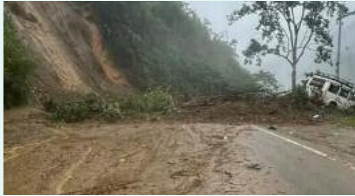
ਬਚਾਅ ਕਾਰਜ ਤੁਰੰਤ ਸ਼ੁਰੂ ਹੋ ਗਏ ਸਨ ਪਰ ਤੇਜ਼ ਮੀਂਹ, ਜ਼ਮੀਨ ਖਿਸਕਣ ਕਾਰਨ ਅਤੇ ਰਾਤ ਭਰ ਦਿਖਾਈ ਦੇਣ ਦੀ