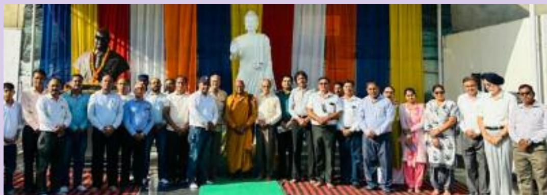
Some glimpses of the Buddha Purnima event