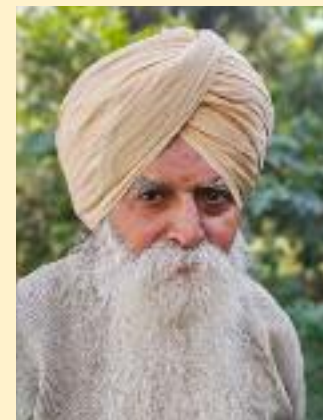
ਸਾਹਿਬ ਦੀ ਫੋਟੋ ਨਿਊਜ਼