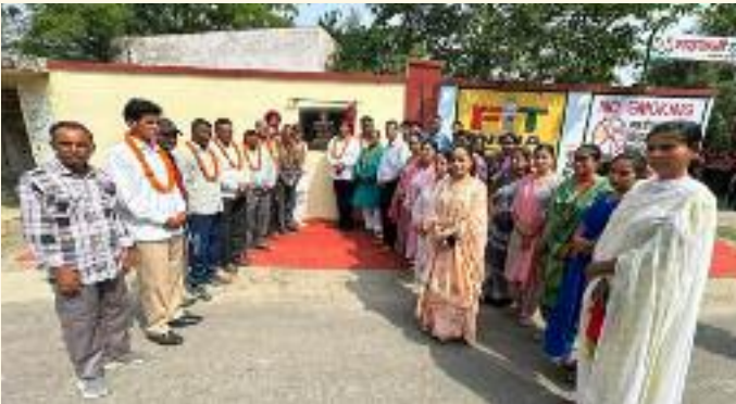
ਉਨ੍ਹਾਂ ਕਿਹਾ ਕਿ ਸਕੂਲਾਂ ਇੱਕ ਗੰਭੀਰ ਚਿੰਤਾ ਦਾ ਵਿਸ਼ਾ ਹੈ, ਜਿਸ ਨੂੰ ਸਰਕਾਰ ਪਹਿਲ ਦੇ ਚਾਰਦੀਵਾਰੀ ਦੀ ਅਣਹੋਂਦ