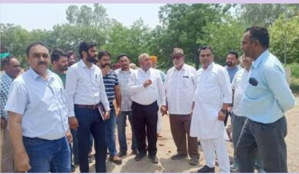
ਮੀਟਿੰਗ ਨੂੰ ਸੰਬੋਧਨ ਕਰਦਿਆਂ ਚੇਅਰਮੈਨ ਨੇ ਗਰੁੱਪਲਾਵਾਂ ਦੇ ਸੰਚਾਲਨ, ਸਰਕਾਰੀ ਨੀਤੀਆਂ ਅਤੇ ਭਵਿੱਖ ਦੀਆਂ ਯੋਜਨਾਵਾਂ ਬਾਰੇ ਚਰਚਾ ਕੀਤੀ। ਉਨ੍ਹਾਂ ਜ਼ਿਲ੍ਹਾ ਪ੍ਰਸ਼ਾਸਨ ਨੂੰ ਗਰੁੱਪ ਸੈੱਸ ਤੋਂ ਪ੍ਰਾਪਤ ਹੋਣ ਵਾਲੇ ਮਾਲੀਏ ਦੀ ਸਹੀ ਵਰਤੋਂ ਕਰਨ ਦੇ ਨਿਰਦੇਸ਼ ਦਿੱਤੇ। ਇਸ ਤੋਂ ਇਲਾਵਾ ਸਬੰਧਤ ਵਿਭਾਗਾਂ ਦੇ ਅਧਿਕਾਰੀਆਂ ਨੇ ਵੀ ਆਪਣੇ ਵਿਚਾਰ ਪੇਸ਼ ਕੀਤੇ ਅਤੇ ਗਰੁੱਪ ਆਸ਼ਰਮ ਵਿੱਚ ਲੋੜੀਂਦੇ ਸੁਧਾਰਾਂ ਬਾਰੇ ਚਰਚਾ ਕੀਤੀ। ਕਮਿਸ਼ਨ ਦੇ ਚੇਅਰਮੈਨ ਨੇ ਸਮਾਜ ਦੇ ਹਰੇਕ ਨਾਗਰਿਕ ਨੂੰ ਗਰੁੱਪ ਸੇਵਾ ਵਿੱਚ

ਸਰਗਰਮ ਭੂਮਿਕਾ ਨਿਭਾਉਣ ਦੀ ਅਪੀਲ ਕੀਤੀ। ਉਨ੍ਹਾਂ ਕਿਹਾ ਕਿ ਗਰੁੱਪਲਾਵਾਂ ਨੂੰ ਮਜ਼ਬੂਤ ਕਰਨ ਲਈ ਪ੍ਰਸ਼ਾਸਨ ਦੇ ਨਾਲ-ਨਾਲ ਆਮ ਲੋਕਾਂ ਦਾ ਸਹਿਯੋਗ ਜ਼ਰੂਰੀ ਹੈ। ਉਨ੍ਹਾਂ ਦਾਨੀ ਸੱਜਣਾਂ ਅਤੇ ਪਸ਼ੂ ਪ੍ਰੇਮੀਆਂ ਨੂੰ ਅਪੀਲ ਕੀਤੀ ਕਿ ਉਹ ਗਰੁੱਪਲਾ ਵਿੱਚ ਯੋਗਦਾਨ ਪਾਉਣ ਤਾਂ ਜੋ ਗਾਵਾਂ ਦੀ ਦੇਖ-ਭਾਲ ਵਿੱਚ ਕੋਈ ਕਮੀ ਨਾ ਰਹੇ। ਪੰਜਾਬ ਗਰੁੱਪਸੇਵਾ ਕਮਿਸ਼ਨ ਲਗਾਤਾਰ ਯਤਨਸ਼ੀਲ ਹੈ ਕਿ ਸੂਬੇ ਦੀਆਂ ਗਰੁੱਪਲਾਵਾਂ ਨੂੰ ਬਿਹਤਰ ਬਣਾਉਣ ਅਤੇ ਜਾਨਵਰਾਂ ਨੂੰ ਸਹੀ ਦੇਖ-ਭਾਲ ਮਿਲੇ। ਕਮਿਸ਼ਨ ਇਸ ਦਿਸ਼ਾ ਵਿੱਚ ਸਰਗਰਮੀ ਨਾਲ ਕੰਮ ਕਰ ਰਿਹਾ ਹੈ ਅਤੇ ਭਵਿੱਖ ਵਿੱਚ ਵੀ ਸੁਧਾਰਾਂ ਲਈ ਤਿਆਰ ਰਹੇਗਾ।