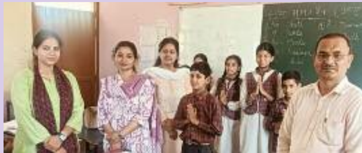
ਅਤੇ ਦੂਜਿਆਂ ਨੂੰ ਉਨ੍ਹਾਂ ਦੀ ਭਲਾਈ ਵਰਤੇ ਜਾਣ ਵਾਲੇ ਸ਼ਬਦਾਂ ਬਾਰੇ ਪੁੱਛਣ ਬਾਰੇ ਜਾਣਕਾਰੀ ਦਿੱਤੀ ਅਤੇ ਤੇਲਗੂ ਭਾਸ਼ਾ ਵਿੱਚ ਗਿਣਤੀ ਲਈ ਅਸੀਂ ਕਿਤੇ ਬਾਹਰ ਜਾਂਦੇ ਹਾਂ, ਜੇਕਰ

ਕੀਤਾ ਗਿਆ। ਅਧਿਆਪਕਾਂ ਨੇ ਬੱਚਿਆਂ ਨੂੰ ਦੱਸਿਆ ਕਿ ਜਿਸ ਤਰ੍ਹਾਂ ਅਸੀਂ ਆਪਣੀ ਭਾਸ਼ਾ ਨੂੰ ਲਗਾਤਾਰ ਪੜ੍ਹਦੇ ਅਤੇ ਬੋਲਦੇ ਹਾਂ। ਇਸ ਤਰ੍ਹਾਂ ਸਾਨੂੰ ਦੇਸ਼ ਦੇ ਹੋਰ ਹਿੱਸਿਆਂ ਵਿੱਚ ਪ੍ਰਚਲਿਤ ਭਾਸ਼ਾਵਾਂ ਦਾ ਗਿਆਨ ਹੋਣਾ ਚਾਹੀਦਾ ਹੈ। ਉਨ੍ਹਾਂ ਕਿਹਾ ਕਿ ਤੇਲਗੂ ਦੱਖਣੀ ਭਾਰਤ ਵਿੱਚ ਬੋਲੀ ਜਾਣ ਵਾਲੀ ਇੱਕ ਪ੍ਰਮੁੱਖ ਭਾਸ਼ਾ ਹੈ। ਉਨ੍ਹਾਂ ਬੱਚਿਆਂ ਨੂੰ ਤੇਲਗੂ ਭਾਸ਼ਾ ਵਿੱਚ ਕਿਸੇ ਨੂੰ ਮਿਲਣ 'ਤੇ ਨਮਸਕਾਰ ਕਰਨ