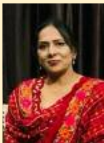
ਅਮਨ ਚਿੱਲੋਂ ਕਸੇਲ ਬਾਬਾ ਬਕਾਲਾ ਸਾਹਿਬ