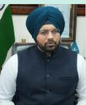
ਡਿਪਟੀ ਕਮਿਸ਼ਨਰ ਅੱਪੀਆ ਸਟੇਟਮੈਂਟ ਦੀ ਤਸਦੀਕ, ਜਾਇਦਾਦ ਦੇ ਰਿਕਾਰਡ ਦੀ ਤਸਦੀਕ, ਰਜਿਸਟਰਡ ਅਤੇ ਗੈਰ-ਰਜਿਸਟਰਡ ਦਸਤਾਵੇਜ਼ਾਂ ਦੀਆਂ ਪ੍ਰਮਾਣਿਕ ਕਾਪੀਆਂ (ਕਾਪੀਆਂ ਪ੍ਰਦਾਨ ਕਰਨਾ), ਫਰਦ ਦੀ

1076 'ਤੇ ਕਾਲ ਕਰਕੇ ਇਨ੍ਹਾਂ ਸੇਵਾਵਾਂ ਦਾ ਲਾਭ ਲੈ ਸਕਦੇ ਹਨ। ਇੱਕ ਨਾਗਰਿਕ ਇੱਕ ਸਮੇਂ ਵਿੱਚ ਵੱਧ ਤੋਂ ਵੱਧ ਚਾਰ ਸੇਵਾਵਾਂ ਪ੍ਰਾਪਤ ਕਰ ਸਕਦਾ ਹੈ। ਉਨ੍ਹਾਂ ਦੱਸਿਆ ਕਿ ਸਿਵਲ ਸੇਵਾਵਾਂ ਵਿੱਚ ਕੋਈ ਵੀ ਪੈਦਾ ਨਹੀਂ ਹੋਇਆ। ਏ. ਸੀ. ਸਰਟੀਫਿਕੇਟ, ਜਨਮ ਸਰਟੀਫਿਕੇਟ ਵਿੱਚ ਨਾਮ ਜੋੜਨਾ, ਮੌਤ ਸਰਟੀਫਿਕੇਟ ਦੀਆਂ ਕਾਪੀਆਂ, ਜਨਮ ਸਰਟੀਫਿਕੇਟ ਵਿੱਚ ਐਂਟਰੀ ਵਿੱਚ ਸੋਧ, ਮੌਤ/ਐਨ. ਏ. ਸੀ. ਸਰਟੀਫਿਕੇਟ ਜਾਰੀ ਕਰਨਾ, ਜਨਮ ਸਰਟੀਫਿਕੇਟ ਦੀਆਂ ਕਈ ਕਾਪੀਆਂ, ਜਨਮ ਸਰਟੀਫਿਕੇਟ ਦੀ ਦੇਰੀ ਨਾਲ ਰਜਿਸਟ੍ਰੇਸ਼ਨ, ਮੌਤ ਸਰਟੀਫਿਕੇਟ ਦੀ ਦੇਰ ਨਾਲ ਰਜਿਸਟ੍ਰੇਸ਼ਨ, ਮੌਤ ਸਰਟੀਫਿਕੇਟ (ਸਿਹਤ), ਆਮਦਨ