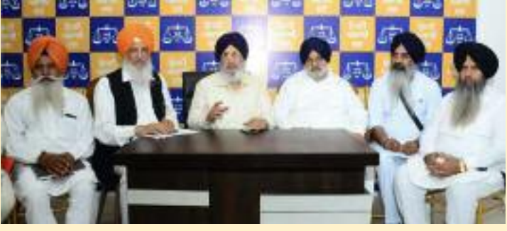
ਮਾਫੀਆ, ਸ਼ਰਾਬ ਮਾਫੀਆ ਅਤੇ ਗੈਂਗਸਟਰਾਂ ਦੇ ਹਵਾਲੇ ਕਰ ਦਿੱਤਾ ਹੈ। ਪੰਜਾਬ ਅੰਦਰ ਲਾਅ ਐਂਡ ਆਰਡਰ ਦੀ ਸਥਿਤੀ ਖਤਮ ਹੋ ਚੁੱਕੀ। ਭਗਵੰਤ ਮਾਨ