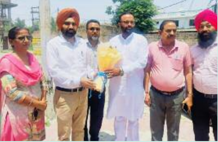
ਬੁਨਿਆਦੀ ਢਾਂਚੇ ਦੇ ਵਿਕਾਸ ਦੀ ਯੋਜਨਾਂ ਬਿਆਨ ਕੀਤੀ। ਅਤੇ ਵਿਸਥਾਰ ਸਬੰਧੀ ਭਵਿੱਖ ਉਹਨਾਂ ਨੇ ਕਿਹਾ ਕਿ ਇਸ ਵਾਰ

ਸਕੂਲ ਮੰਗਾ ਰੋਡਾ, ਬਲਾਕ ਕਪੂਰਥਲਾ-1 (ਜ਼ਿਲ੍ਹਾ ਕਪੂਰਥਲਾ) ਵਿਖੇ ਬਿਲਡਿੰਗ ਦੇ ਬੁਨਿਆਦੀ ਢਾਂਚੇ ਦੀ ਉਸਾਰੀ ਅਤੇ ਚਾਰ ਦੀਵਾਰੀ ਦੀ ਮੁਰੰਮਤ ਦਾ ਕੰਮ ਮੁਕੰਮਲ ਹੋਣ ਉਪਰੰਤ ਲੋਕ ਅਰਪਿਤ ਕੀਤਾ ਗਿਆ। ਇਸ ਮੌਕੇ ਉਹਨਾਂ ਨੇ ਇੱਕ ਵੱਡੇ ਇਕੱਠ ਨੂੰ ਸੰਬੋਧਨ ਕਰਦਿਆਂ ਮਾਨ ਸਰਕਾਰ ਦੀਆਂ ਪ੍ਰਾਪਤੀਆਂ ਦਾ ਜ਼ਿਕਰ ਕਰਦੇ ਹੋਏ ਸਕੂਲਾਂ ਦੇ