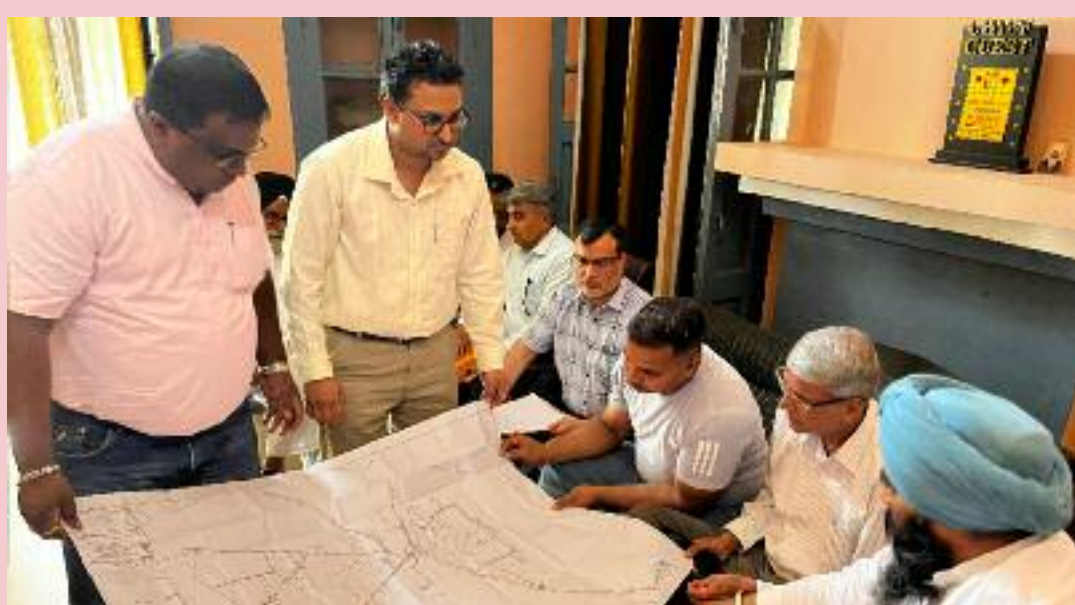
ਸਾਫ਼ ਸ਼ਬਦਾਂ ਵਿੱਚ ਕਿਹਾ ਕਿ, ਉਦੇਸ਼ ਲੋਕਾਂ ਦੀ ਭਲਾਈ ਹੈ। ਜੇਕਰ ਕਿਸੇ ਵੀ ਪੱਧਰ 'ਤੇ ਲਾਪਰਵਾਹੀ ਜਾਂ ਵਿੱਲਮੁੱਲ ਵਿਵਹਾਰ ਸਾਹਮਣੇ ਆਇਆ,

ਅਧਿਕਾਰੀਆਂ, ਨਿਗਰਾਨ ਇੰਜੀਨੀਅਰ, ਕਾਰਜਕਾਰੀ ਇੰਜੀਨੀਅਰ, ਐਸ.ਡੀ.ਓ. ਅਤੇ ਹੋਰ ਕਾਰਜ ਸਾਧਕ ਅਫਸਰਾਂ ਦੀ ਹਾਜ਼ਰੀ 'ਚ ਹੋਈ ਇਸ ਮੀਟਿੰਗ ਦੌਰਾਨ, ਡਿਪਟੀ ਸਪੀਕਰ ਨੇ ਹਰ ਪ੍ਰੋਜੈਕਟ ਦੀ ਪ੍ਰਗਤੀ ਦੀ ਵਿਸਥਾਰ ਨਾਲ ਸਮੀਖਿਆ ਕੀਤੀ। ਉਨ੍ਹਾਂ ਨੇ ਅਧਿਕਾਰੀਆਂ ਨੂੰ ਨਿਰਦੇਸ਼ ਦਿੱਤੇ ਕਿ ਜਨਤਕ ਪੈਸੇ ਨਾਲ ਚੱਲ ਰਹੇ ਪ੍ਰੋਜੈਕਟਾਂ 'ਚ ਪਾਰਦਰਸ਼ਿਤਾ ਅਤੇ ਤੇਜ਼ੀ ਲਿਆਉਣੀ ਜ਼ਰੂਰੀ ਹੈ ਤਾਂ ਜੋ ਲੋਕਾਂ ਨੂੰ ਸਮੇਂ ਸਿਰ ਲਾਭ ਮਿਲ ਸਕੇ। ਡਿਪਟੀ ਸਪੀਕਰ ਰੋੜੀ ਨੇ