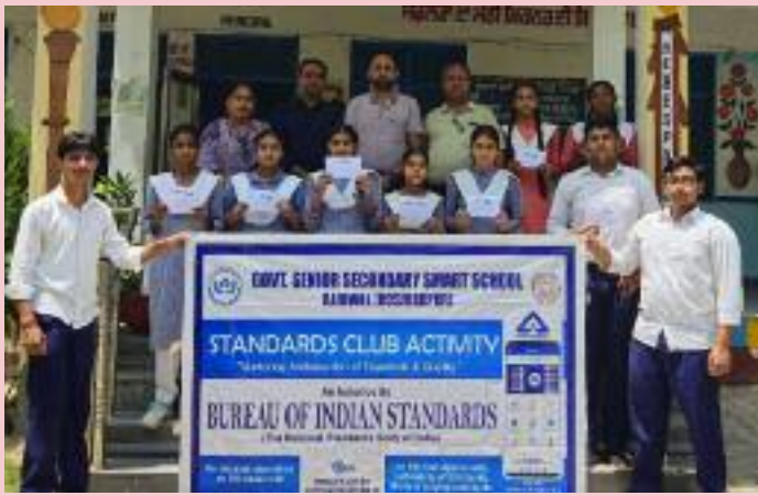
ਦੀ ਗੁਣਵੱਤਾ ਚੰਗੀ ਨਹੀਂ ਹੁੰਦੀ, ਉਹ ਕੁਝ ਸਮੇਂ ਲਈ ਬਾਜ਼ਾਰ ਵਿੱਚ ਆਪਣੀ ਜਗ੍ਹਾ ਬਣਾ ਲੈਂਦੀਆਂ ਹਨ ਪਰ ਬਾਅਦ ਵਿੱਚ ਉਨ੍ਹਾਂ ਨੂੰ ਬਾਜ਼ਾਰ ਤੋਂ ਹਟਾਉਣਾ ਪੈਂਦਾ ਹੈ। ਉਨ੍ਹਾਂ ਕਿਹਾ ਕਿ ਇਸ

ਟੈਸਟਿੰਗ ਰਾਹੀਂ ਰਾਸ਼ਟਰੀ ਅਰਥਵਿਵਸਥਾ ਨੂੰ ਕਈ ਤਰੀਕਿਆਂ ਨਾਲ ਲਾਭ ਪਹੁੰਚਾ ਰਿਹਾ ਹੈ। ਇਹ ਸੁਰੱਖਿਅਤ, ਭਰੋਸੇਮੰਦ ਗੁਣਵੱਤਾ ਵਾਲੇ ਉਤਪਾਦ ਪ੍ਰਦਾਨ ਕਰਦਾ ਹੈ। ਖਪਤਕਾਰਾਂ ਲਈ ਸਿਹਤ ਜੋਖਮਾਂ ਨੂੰ ਘੱਟ ਕਰਦਾ ਹੈ। ਨਿਰਯਾਤ ਅਤੇ ਆਯਾਤ ਵਿਕਲਪਾਂ ਨੂੰ ਉਤਸ਼ਾਹਿਤ ਕਰਦਾ ਹੈ। ਇਸ ਦੇ ਤਹਿਤ, ਬੱਚਿਆਂ ਨੂੰ ਪਤਾ ਲੱਗਦਾ ਹੈ ਕਿ ਸਿਰਫ ਗੁਣਵੱਤਾ ਵਾਲੇ ਉਤਪਾਦ ਹੀ ਬਾਜ਼ਾਰ ਵਿੱਚ ਟਿਕ ਸਕਦੇ ਹਨ। ਜਿਨ੍ਹਾਂ ਚੀਜ਼ਾਂ