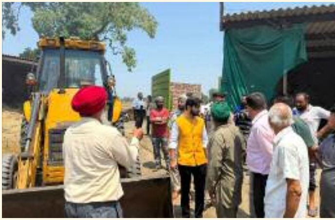
ਕਾਰਨ ਘਰ ਦਾ ਬਹੁਤ ਸਾਰਾ ਪਸ਼ੂ ਵੀ ਸੜ ਗਏ, ਜਿਸ ਕਾਰਨ ਸਾਮਾਨ ਸੜ ਕੇ ਸੁਆਹ ਹੋ ਗਿਆ। ਇਸ ਦੇ ਨਾਲ ਹੀ ਕਈ ਪਸ਼ੂ ਵੀ ਸੜ ਗਏ, ਜਿਸ ਕਾਰਨ ਸਾਮਾਨ ਸੜ ਕੇ ਸੁਆਹ ਹੋ ਗਿਆ। ਇਸ ਦੇ ਨਾਲ ਹੀ ਕਈ

ਮੁਲਾਕਾਤ ਕੀਤੀ ਅਤੇ ਘਟਨਾ ਵਾਲੀ ਥਾਂ ਦਾ ਮੁਆਇਨਾ ਕੀਤਾ। ਉਨ੍ਹਾਂ ਫਾਇਰ ਵਿਭਾਗ ਦੀ ਮੁਸ਼ਤੈਦੀ ਦੀ ਪ੍ਰਸ਼ੰਸਾ ਕਰਦੇ ਹੋਏ ਕਿਹਾ ਕਿ ਜੇਕਰ ਫਾਇਰ ਬ੍ਰਿਗੇਡ ਦੀਆਂ ਗੱਡੀਆਂ ਸਮੇਂ ਸਿਰ ਨਾ ਪਹੁੰਚਦੀਆਂ ਤਾਂ ਨੁਕਸਾਨ ਹੋਰ ਵੀ ਭਿਆਨਕ ਹੋ ਸਕਦਾ ਸੀ। ਫਾਇਰ ਬ੍ਰਿਗੇਡ ਨੇ ਮੌਕੇ 'ਤੇ ਪਹੁੰਚ ਕੇ ਮੁਸ਼ਕਲ ਹਾਲਾਤਾਂ ਵਿੱਚ ਅੱਗ 'ਤੇ ਕਾਬੂ ਪਾਇਆ ਅਤੇ ਕਈ ਪਰਿਵਾਰਾਂ ਨੂੰ ਸੰਭਾਵੀ ਖ਼ਤਰੇ ਤੋਂ ਬਚਾਇਆ। ਅੱਗ ਲੱਗਣ