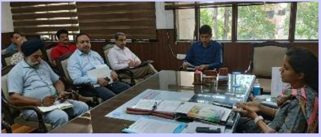
ਹਨ, ਜਿਸ ਨੂੰ ਸਖ਼ਤੀ ਨਾਲ ਰੋਕੇ ਜਾਣ ਦੀ ਤੁਰੰਤ ਲੋੜ ਹੈ। ਉਨ੍ਹਾਂ ਜ਼ਿਲ੍ਹਾ ਵਾਸੀਆਂ ਨੂੰ ਵੀ ਅਪੀਲ ਕੀਤੀ ਕਿ ਉਹ ਸੋਸ਼ਲ ਮੀਡੀਆ ਜਾਂ ਹੋਰ ਸਾਧਨਾਂ ਰਾਹੀਂ ਫੈਲਾਈਆਂ ਜਾ ਰਹੀਆਂ ਬੇਬੁਨਿਆਦ ਅਤੇ ਤੱਥਹੀਣ ਖ਼ਬਰਾਂ 'ਤੇ ਬਿਲਕੁਲ ਵੀ ਯਕੀਨ ਨਾ ਕਰਨ ਅਤੇ ਜੇਕਰ ਜ਼ਿਲ੍ਹਾ ਪ੍ਰਸ਼ਾਸਨ ਜਾਂ ਪੁਲਿਸ ਵਲੋਂ ਲੋਕ ਹਿੱਤ ਵਿੱਚ ਕੋਈ ਜਾਣਕਾਰੀ

ਜਾਗਰੂਕ ਫੈਲਾਈ ਜਾਵੇ। ਉਨ੍ਹਾਂ ਕਿਹਾ ਕਿ ਇਸ ਦੌਰਾਨ ਪ੍ਰਚਾਰ ਸਮੱਗਰੀ ਰਾਹੀਂ ਉਨ੍ਹਾਂ ਨੂੰ ਆਸਮਾਨ 'ਤੇ ਦਿਖਾਈ ਦਿੰਦੀ ਕਿਸੇ ਵਸਤੂ ਦੀ ਪਹਿਚਾਣ ਕਰਨੀ ਸਿਖਾਈ ਜਾਵੇ ਕਿ ਉਹ ਵਸਤੂ ਸੈਟੇਲਾਈਟ, ਜਹਾਜ਼, ਡਰੋਨ ਜਾਂ ਕੋਈ ਹੋਰ ਚੀਜ਼ ਹੈ। ਡਿਪਟੀ ਕਮਿਸ਼ਨਰ ਨੇ ਕਿਹਾ ਕਿ ਅਧਿਕਾਰੀਆਂ ਨੂੰ ਅਫਵਾਹਾਂ ਨੂੰ ਠੱਲ੍ਹ ਪਾਉਣ ਲਈ ਵਧੇਰੇ ਚੌਕਸੀ ਅਤੇ ਸਖ਼ਤੀ ਵਰਤਣ ਦੀ ਹਦਾਇਤ ਕੀਤੀ। ਉਨ੍ਹਾਂ ਕਿਹਾ ਕਿ ਕੁਝ ਅਜਿਹੇ ਮਾਮਲੇ ਧਿਆਨ ਵਿੱਚ ਆ ਰਹੇ ਹਨ ਕਿ ਕੁਝ ਸ਼ਰਾਰਤੀ ਕਿਸਮ ਦੇ ਅਨਸਰ ਜਾਣ-ਬੁੱਝ ਕੇ ਨਾਗਰਿਕਾਂ ਵਿੱਚ ਅਸੁਰੱਖਿਆ ਦੀ ਭਾਵਨਾ ਪੈਦਾ ਕਰਨ ਵਾਲੀਆਂ ਫੇਕ ਨਿਊਜ਼ ਅਤੇ ਤੱਥਹੀਣ ਸਮੱਗਰੀ ਨੂੰ ਸੋਸ਼ਲ ਮੀਡੀਆ 'ਤੇ ਅਪਲੋਡ ਕਰ ਰਹੇ