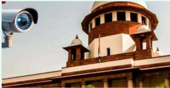
ਡਿਵੀਜ਼ਨ ਬੈਂਚ ਨੇ ਕਿਹਾ ਕਿ ਹਾਈ ਕੋਰਟ ਨੇ ਕਿਹਾ ਕਿ ਸਹਿ-ਨਿਵਾਸੀਆਂ ਜਾਂ ਸਹਿ-ਟਰੱਸਟੀ ਦੀ ਸਹਿਮਤੀ ਤੋਂ ਬਿਨਾਂ ਰਿਹਾਇਸ਼ ਦੇ ਕਿਸੇ ਵੀ ਹਿੱਸੇ ਦੇ ਅੰਦਰ ਸੀਸੀਟੀਵੀ ਕੈਮਰੇ ਲਗਾਉਣਾ ਉਨ੍ਹਾਂ