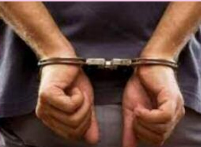
(ਭਾਰਤ ਦੀ ਪ੍ਰਭੂਸੱਤਾ, ਏਕਤਾ ਅਤੇ ਅਖੰਡਤਾ ਨੂੰ ਖਤਰੇ 'ਚ ਪਾਉਣ ਵਾਲੀਆਂ ਕਾਰਵਾਈਆਂ) ਤਹਿਤ ਮਾਮਲਾ ਦਰਜ ਕੀਤਾ ਗਿਆ ਹੈ।