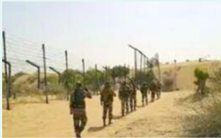
ਆਪਣੇ ਸਾਰੇ ਅਧਿਕਾਰੀਆਂ ਅਤੇ ਕਰਮਚਾਰੀਆਂ ਦੀਆਂ ਛੁੱਟੀਆਂ ਰੱਦ

ਹੈ। ਇਹ 8 ਮਈ ਤੋਂ ਅਗਲੇ ਆਦੇਸ਼ਾਂ ਤੱਕ ਜਾਰੀ ਰਹੇਗਾ। ਬੀਕਾਨੇਰ, ਕਿਸ਼ਨਗੜ੍ਹ ਅਤੇ ਜੋਧਪੁਰ ਹਵਾਈ ਅੱਡਿਆਂ ਤੋਂ 10 ਮਈ ਤੱਕ ਸਾਰੀਆਂ ਉਡਾਨਾਂ ਦੀ ਕਾਰਵਾਈ ਬੰਦ ਕਰ ਦਿੱਤੀ ਗਈ ਹੈ। ਵੀਰਵਾਰ ਨੂੰ ਜੈਪੁਰ ਹਵਾਈ ਅੱਡੇ ਤੋਂ 4 ਉਡਾਨਾਂ ਰੱਦ ਕਰ ਦਿੱਤੀਆਂ ਗਈਆਂ ਹਨ। ਇੰਡੀਗੋ ਏਅਰਲਾਈਨਜ਼ ਨੇ 10 ਮਈ ਤੱਕ ਬੀਕਾਨੇਰ ਵਿੱਚ ਆਪਣੀਆਂ ਸਾਰੀਆਂ ਉਡਾਨਾਂ ਰੱਦ ਕਰ ਦਿੱਤੀਆਂ ਹਨ। ਮੌਜੂਦਾ ਸਥਿਤੀ ਨੂੰ ਦੇਖਦੇ ਹੋਏ, ਉੱਤਰ-ਪੱਛਮੀ ਰੇਲਵੇ ਨੇ