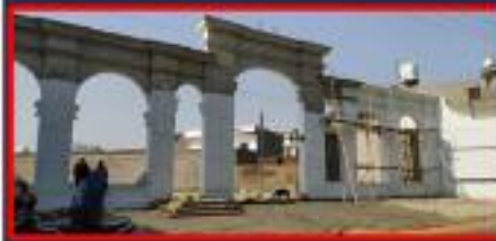
JETVAN BUDHA VIHARA Nakodar, Jalandhar, Punjab