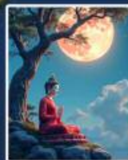
Tathagat Gautam Budh