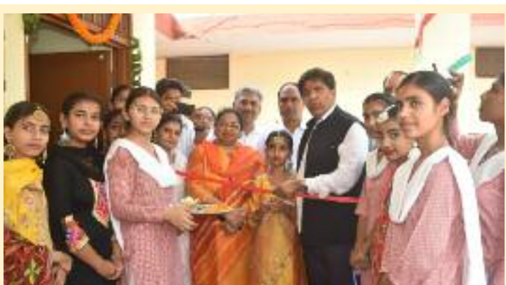
ਉਨ੍ਹਾਂ ਕਿਹਾ ਕਿ ਇਸ ਵਾਰ ਰੱਖਿਆ ਹੈ, ਜਿਸ ਤੋਂ ਪਤਾ ਸਰਕਾਰ ਨੇ ਸਿੱਖਿਆ ਲਈ 18 ਲੱਗਦਾ ਹੈ ਕਿ ਸਰਕਾਰ ਹਜ਼ਾਰ ਕਰੋੜ ਰੁਪਏ ਦਾ ਬਜਟ ਸਿੱਖਿਆ ਖੇਤਰ ਨੂੰ ਤਰਜੀਹ