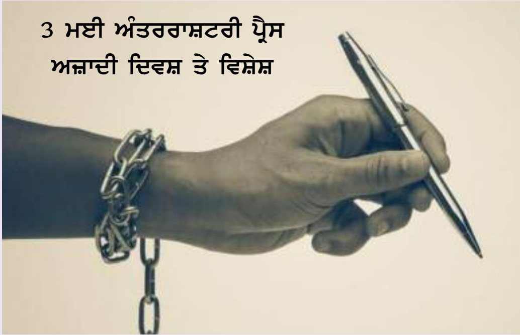
3 ਮਈ ਅੰਤਰਰਾਸ਼ਟਰੀ ਪ੍ਰੈਸ ਅਜ਼ਾਦੀ ਦਿਵਸ ਤੇ ਵਿਸ਼ੇਸ਼

ਡਿਊਟੀ ਦੌਰਾਨ ਕੈਦ ਕੀਤਾ ਜਾਂਦਾ ਹੈ, ਹਮਲਾ ਕੀਤਾ ਜਾਂਦਾ ਹੈ ਜਾਂ ਮਾਰਿਆ ਤੱਕ ਜਾਂਦਾ ਹੈ। ਇਹ ਹਮਲੇ ਨਾ ਸਿਰਫ਼ ਪੱਤਰਕਾਰਾਂ ਦੇ ਜੀਵਨ ਅਤੇ ਰੋਜ਼ੀ-ਰੋਟੀ ਨੂੰ ਖ਼ਤਰੇ ਵਿੱਚ ਪਾਉਂਦੇ ਹਨ ਬਲਕਿ ਲੋਕਤੰਤਰ ਅਤੇ ਮਨੁੱਖੀ ਅਧਿਕਾਰਾਂ ਦੇ ਬੁਨਿਆਦੀ ਸਿਧਾਂਤਾਂ ਨੂੰ ਵੀ ਕਮਜ਼ੋਰ ਕਰਦੇ ਹਨ। ਪ੍ਰੈਸ ਦੀ ਆਜ਼ਾਦੀ ਦੀ ਮਹੱਤਤਾ ਨੂੰ ਵੇਖਦੇ ਹੋਏ ਹੀ ਸੰਯੁਕਤ ਰਾਸ਼ਟਰ ਸੰਘ ਨੇ 1993 ਵਿੱਚ 03 ਮਈ ਦੇ ਦਿਹਾੜੇ ਨੂੰ ਪ੍ਰੈਸ ਅਜ਼ਾਦੀ ਦਿਵਸ ਵਜੋਂ ਘੋਸ਼ਿਤ ਕੀਤਾ ਸੀ। ਉਸਤੋਂ ਬਾਦ ਹੁਣ ਹਰ ਸਾਲ 03 ਮਈ ਨੂੰ ਪ੍ਰੈਸ ਅਜ਼ਾਦੀ ਦਿਵਸ ਮਨਾਇਆ ਜਾਂਦਾ ਹੈ। ਇਸ ਦਿਨ ਸਰਕਾਰਾਂ ਵਲੋਂ ਅਤੇ ਮੀਡੀਆ ਉਦਯੋਗ ਨਾਲ ਜੁੜੇ ਲੋਕਾਂ ਵਲੋਂ ਵਿਸ਼ੇਸ਼ ਤੌਰ ਤੇ ਪ੍ਰੈਸ ਦੇ ਕੰਮ ਕਾਰ ਸਬੰਧੀ ਵਿਚਾਰ ਵਟਾਂਦਰਾ ਕੀਤਾ ਜਾਂਦਾ ਹੈ ਅਤੇ ਪ੍ਰੈਸ ਨੂੰ ਨਿਰਪੱਖ ਅਜ਼ਾਦ ਰੂਪ ਵਿੱਚ ਕੰਮ ਕਰਨ ਲਈ ਠੋਸ ਨੀਤੀਆਂ ਬਣਾਈਆਂ ਜਾਂਦੀਆਂ ਹਨ। ਅੱਜ ਭਾਰਤ ਵਿੱਚ ਪ੍ਰੈਸ ਜਾ ਮੀਡੀਆ ਦਾ ਜ਼ਿਆਦਾ ਤਰ ਹਿੱਸਾ ਬਿਜ਼ਨਸ ਪੱਖੋਂ ਵਿਚਰ ਰਿਹਾ ਹੈ ਬਹੁਤ ਸਾਰੇ ਚੈਨਲ ਜਾਂ ਅਖ਼ਬਾਰ ਰਾਜਨੀਤਕ ਜਾਂ ਵਪਾਰਕ ਲੋਕਾਂ ਦਾ ਹਿੱਸਾ ਬਣਦੇ ਜਾ ਰਹੇ ਹਨ ਅਤੇ ਉਨ੍ਹਾਂ ਦਾ ਮੁੱਖ ਮਕਸਦ ਪ੍ਰੈਸ ਜਾ ਮੀਡੀਆ ਨੂੰ ਵਪਾਰਕ ਤੌਰ ਤੇ ਇਸਤੇਮਾਲ ਕਰਨਾ ਹੈ। ਇਹੋ ਜਿਹੇ ਪੱਖ ਭਾਰੂ ਹੋਣ ਕਾਰਨ ਬਹੁਤ ਸਾਰੇ ਅਦਾਰੇ ਸਮਾਜਿਕ ਸਰੋਕਾਰਾਂ ਤੋਂ ਦੂਰ ਹੁੰਦੇ ਜਾ ਰਹੇ ਹਨ। ਮੀਡੀਆ ਨੂੰ ਸਮਾਜ ਨਾਲ ਜੁੜਕੇ ਆਮ ਲੋਕਾਂ ਦੀ ਆਵਾਜ਼ ਬਣਨਾ ਚਾਹੀਦਾ ਹੈ। ਕੁੱਝ ਸਾਲ ਪਹਿਲਾਂ ਤੱਕ