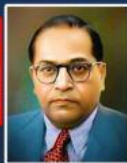
Baba Sahib Dr. Ambedkar

Jetvan Buddha Vihara Welfare Committee and Moh. Dr. Ambedkar Nagar (Nai Abadi) Nakodar are celebrating Buddha Purnama on Monday 12th May 2025 at 6 PM at Jetvan Buddha Vihara Nakodar. So everyone is being invited to participate in the program of Buddha Purnama.