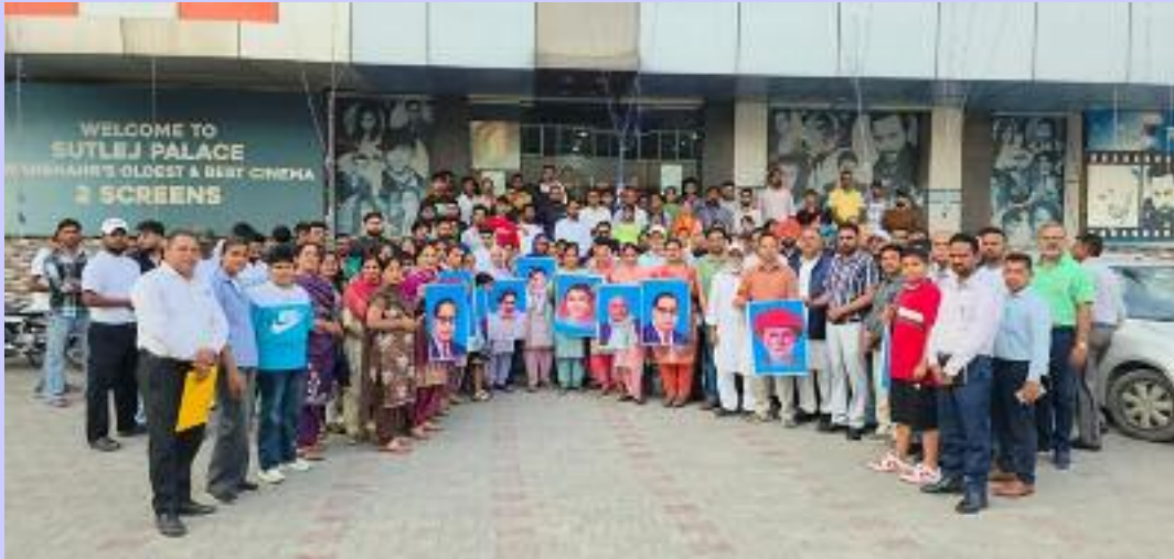
ਰਾਓ ਫੂਲੇ ਜੀ ਦੇ ਪਹਿਲੇ ਸ਼ਿਸ਼ ਸਵਿੱਤਰੀ ਬਾਈ ਫੂਲੇ ਜੀ ਹੋਏ ਔਰਤ ਹੋਣ ਦੇ ਬਾਵਜੂਦ ਦੇਸ਼ ਉਹਨਾ ਦੀ ਧਰਮ ਪਤਨੀ ਹਨ ਜੋ ਕਿ ਉਸ ਸਮੇਂ ਇਕ ਦੇ ਪਹਿਲੇ ਸ਼ਿਕਸ਼ਕ ਬਣੇ ਉਹਨਾ

ਵਾ ਰਾਓ ਫੂਲੇ ਜੀ ਅਤੇ ਸਵਿੱਤਰੀ ਬਾਈ ਫੂਲੇ ਜੀ ਦੇ ਜੀਵਨੀ ਉੱਤੇ ਫਿਲਮਾਈ ਗਈ ਇਹ ਫਿਲਮ ਜਿਸ ਵਿੱਚ ਬਹੁਜਨ ਸਮਾਜ ਨੂੰ ਜਾਗਰੂਕ ਕਰਨਾ, ਸੁਆ ਸ਼ਾਤ ਨੂੰ ਖਤਮ ਕਰਨਾ ਅਤੇ ਮੇਨ ਫੋਕਸ ਧੀਆਂ ਨੂੰ ਭੜਾਉਣ ਵਾਰੇ ਕੀਤਾ ਗਿਆ ਹੈ ਉਸ ਸਮੇਂ ਦੇ ਹਾਕਮਾਂ ਨਾਲ ਸਿਧੀ ਟਕਰ ਅਤੇ ਪਖੰਡ ਵਾਦ ਨੂੰ ਖਤਮ ਕਰਨੇ ਦੀ ਗਲ ਕਹੀ ਗਈ ਹੈ ਇਸ ਫਿਲਮ ਵਿਚ ਮਹਾਨ ਨਾਇਕ ਮਹਾਤਮਾ ਜੋਤੀ ਵਾ