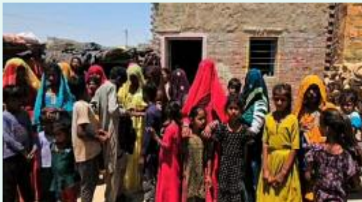
ਅਤੇ ਹੋਰ ਸਬੰਧਤ ਵਿਭਾਗਾਂ ਦੁਆਰਾ ਸਰਕਾਰੀ ਆਦੇਸ਼ਾਂ ਬਾਰੇ ਸੂਚਿਤ ਕੀਤਾ ਜਾ ਰਿਹਾ ਹੈ ਜਿਸ ਵਿਚ ਕਿਹਾ ਗਿਆ ਹੈ

ਵਿਚ ਦਾਖਲ ਹੋਏ ਪਾਕਿਸਤਾਨੀ ਨਾਗਰਿਕਾਂ ਨੂੰ ਦੇਸ਼ ਛੱਡਣ ਲਈ ਕੇਂਦਰ ਦੇ ਨਿਰਦੇਸ਼ਾਂ ਨੇ ਆਮ ਲੋਕਾਂ, ਖਾਸ ਕਰ ਕੇ ਥੋੜ੍ਹੇ ਸਮੇਂ ਦੇ ਵੀਜ਼ਾ ਵਾਲੇ ਲੋਕਾਂ ਵਿਚ ਦਹਿਸ਼ਤ ਪੈਦਾ ਕਰ ਦਿਤੀ ਹੈ। ਜੈਸਲਮੇਰ ਵਿਚ 6,000 ਤੋਂ ਵੱਧ ਪਾਕਿਸਤਾਨੀ ਨਾਗਰਿਕ ਲੰਬੇ ਸਮੇਂ ਦੇ ਵੀਜ਼ੇ 'ਤੇ ਰਹਿ ਰਹੇ ਹਨ, ਜਦਕਿ ਪੂਰੇ ਰਾਜਸਥਾਨ ਵਿਚ 20,000 ਹਨ। ਉਨ੍ਹਾਂ ਨੂੰ ਵਿਦੇਸ਼ੀ ਰਜਿਸਟ੍ਰੇਸ਼ਨ ਦਫ਼ਤਰ (FRO)