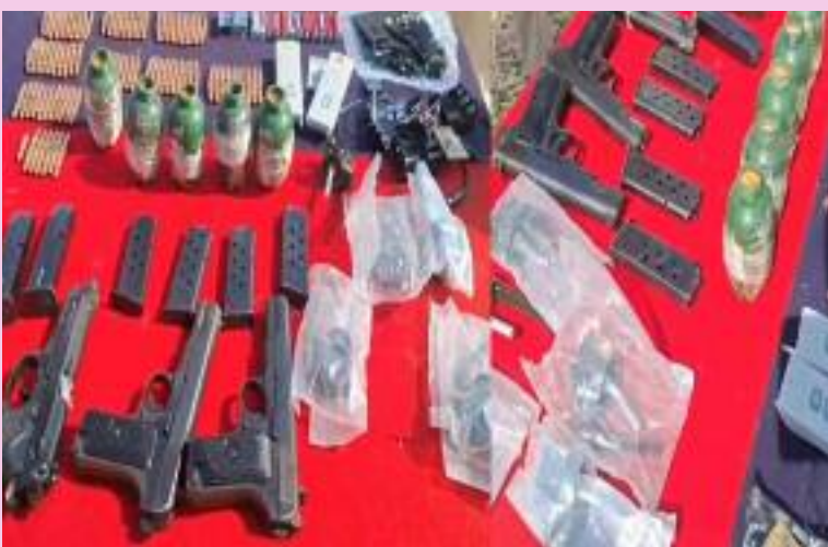
ਧਮਾਕਾ ਖੋਜ ਸਮੱਗਰੀ (ਆਰ.ਡੀ.ਐਕਸ), 2 ਬੈਟਰੀ ਚਾਰਜਰ ਅਤੇ ਦੋ ਰਿਮੋਟ ਬਰਾਮਦ ਹੋਏ ਹਨ। ਜਿਨ੍ਹਾਂ ਨੂੰ ਕਬਜ਼ੇ 'ਚ ਲੈ ਕੇ ਅਗਲੇਰੀ ਕਾਰਵਾਈ ਸ਼ੁਰੂ ਕਰ ਦਿੱਤੀ ਹੈ।

ਅੰਮ੍ਰਿਤਸਰ । ਪੰਜਾਬ ਨੂੰ ਦਹਿਲਾਉਣ ਦੀ ਵੱਡੀ ਸਾਜ਼ਿਸ਼ ਨੂੰ ਨਾਕਾਮ ਕੀਤਾ ਗਿਆ। ਬੀਐਸਐਫ਼ ਤੇ ਅੰਮ੍ਰਿਤਸਰ ਪੁਲਿਸ ਨੇ 4.5 ਕਿਲੋ ਆਰਡੀਐਸ ਬਰਾਮਦ ਕੀਤਾ ਹੈ। ਜਾਣਕਾਰੀ ਮੁਤਾਬਕ ਬੀ.ਐੱਸ.ਐੱਫ਼. 117 ਬਟਾਲੀਅਨ ਨੇ ਪੁਲਿਸ ਨਾਲ ਮਿਲ ਕੇ ਸਾਂਝੇ ਤੌਰ 'ਤੇ ਚਲਾਏ ਅਭਿਆਨ ਦੌਰਾਨ ਵੱਡੀ ਮਾਤਰਾ ਵਿਚ ਅਸਲਾ ਅਤੇ ਆਰ.ਡੀ.ਐਕਸ. ਬਰਾਮਦ ਕੀਤਾ ਹੈ। ਇਹ ਬਰਾਮਦਗੀ ਪਿੰਡ ਸਾਹੋਵਾਲ ਨੇੜਲੇ ਇੱਕ ਕਿਸਾਨ ਦੇ ਕਣਕ ਦੇ ਖੇਤਾਂ 'ਚ ਹੋਈ ਹੈ। ਬਰਾਮਦਗੀ ਦੌਰਾਨ ਦੋ ਵੱਡੇ ਪੈਕਟਾਂ ਵਿਚੋਂ 5 ਹੈਂਡ ਗ੍ਰਨੇਡ, 5 ਪਿਸਤੌਲ, 8 ਮੈਗਜ਼ੀਨ, 220 ਜ਼ਿੰਦਾ ਕਾਰਤੂਸ, 4.50 ਕਿਲੋ