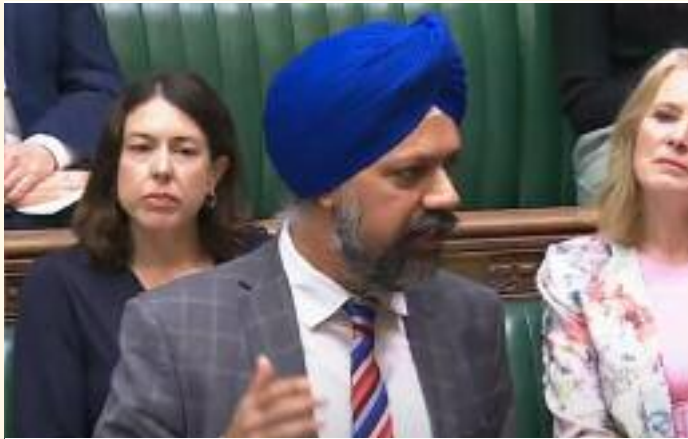
ਸੰਸਦ ਨੂੰ ਸੰਬੋਧਨ ਕਰਦੇ ਹੋਏ ਪਗੜੀਧਾਰੀ ਸਿੱਖ ਮੈਂਬਰ ਪਾਰਲੀਮੈਂਟ ਸ ਤਰਮਨਜੀਤ ਸਿੰਘ ਢੇਸੀ।

ਅੱਤਵਾਦੀ ਹਮਲੇ ਦੀ ਨਿੰਦਾ ਕਰਦਿਆਂ, ਜਿੱਥੇ ਪੀੜਤ ਪਰਿਵਾਰਾਂ ਨਾਲ ਹਮਦਰਦੀ ਜ਼ਾਹਿਰ ਕੀਤੀ, ਉੱਥੇ ਭਾਰਤ ਸਰਕਾਰ ਨੂੰ ਦੋਸ਼ੀਆਂ ਨੂੰ ਸਖਤ ਸਜ਼ਾਵਾਂ ਦਿਵਾਉਣ ਦੀ ਅਪੀਲ ਵੀ ਕੀਤੀ। ਸ ਢੇਸੀ ਨੇ ਸੰਸਦ ਨੂੰ ਸੰਬੋਧਨ ਕਰਦਿਆਂ ਕਿਹਾ ਕਿ ਜਿੱਥੇ ਇਸ ਵੇਲੇ ਅਸੀਂ ਇਸ ਹਫ਼ਤੇ ਪੌਪ ਫ੍ਰਾਂਸਿਸ ਦੇ ਦੁਖਦਾਇਕ ਦਿਹਾਂਤ ਨਾਲ ਨਿਪਟ ਰਹੇ ਹਾਂ, ਉਥੇ