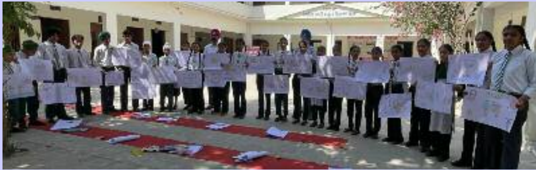
ਫਾਇਰ ਸੇਫਟੀ ਹਫਤੇ ਮੌਕੇ ਜਾਗਰੂਕਤਾ ਮੁਕਾਬਲੇ ਦਾ ਦ੍ਰਿਸ਼।

ਵਿਦਿਆਰਥੀਆਂ ਨੂੰ ਜਾਣਕਾਰੀ ਦਿੰਦਿਆਂ ਦੱਸਿਆ ਕਿ ਫਾਇਰ ਸੇਫਟੀ ਹਫਤੇ ਵਿੱਚ ਜਾਗਰੂਕ ਕਰਨ ਦਾ ਉਦੇਸ਼ ਕਣਕ ਦੀ ਵਾਢੀ ਅਤੇ ਗਰਮ ਰੁੱਤ ਮੌਕੇ ਹੋ ਰਹੀਆਂ ਅੱਗ ਦੀਆਂ ਘਟਨਾਵਾਂ ਨੂੰ ਘੱਟ ਕਰਨਾ ਹੈ। ਉਨ੍ਹਾਂ ਸਲਾਹ ਦਿੱਤੀ ਕਿ ਹਾੜੀ ਫਸਲਾਂ ਦੇ ਪੱਕਣ ਵਕਤ ਕਿਸਾਨ ਵੀਰਾਂ ਨੂੰ ਬਿਜਲੀ ਦੀਆਂ ਤਾਰਾਂ, ਟਰਾਂਸਫਾਰਮਰ ਦੇ ਨੇੜੇ ਸੁੱਕੇ ਘਾਹ/ਕਣਕ ਨੂੰ ਕੱਟਣਾ, ਪਾਣੀ ਦੇ ਖਾਲ ਭਰ ਕੇ ਰੱਖਣੇ, ਵਿੱਲੀਆਂ ਤਾਰਾਂ ਦੀ ਜਾਣਕਾਰੀ ਬਿਜਲੀ ਵਿਭਾਗ ਨੂੰ ਦੇਣਾ ਅਤੇ ਐਮਰਜੈਂਸੀ ਨੰਬਰ