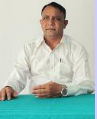
ਮਨਰੇਗਾ ਨੂੰ ਆਨਲਾਈਨ ਟ੍ਰੇਨਿੰਗ ਵੀ ਦਿੱਤੀ ਗਈ ਹੈ ਅਤੇ

ਪੱਤਰ ਮੀਮੋ ਨੰ: 01/101/2025/ਨਰੇਗਾ/2110-21320 ਮਿਤੀ 16/04/2025 ਰਾਹੀਂ ਯੋਗ ਮਨਰੇਗਾ ਮਜ਼ਦੂਰਾਂ ਦੀ ਪੰਜਾਬ ਬਿਲਡਿੰਗ ਐਂਡ ਅੰਦਰ ਕੰਸਟ੍ਰਕਸ਼ਨ ਵਰਕਰਜ਼ ਵੈੱਲਫੇਅਰ ਬੋਰਡ ਦੇ ਲਾਭਪਾਤਰੀਆਂ ਵਜੋਂ ਰਜਿਸਟ੍ਰੇਸ਼ਨ ਕਰਨ ਲਈ ਆਦੇਸ਼ ਦਿੱਤੇ ਗਏ ਹਨ। ਇਸ ਸਬੰਧੀ ਜ਼ਿਲ੍ਹਾ ਨੋਡਲ ਅਫਸਰਾਂ ਮਨਰੇਗਾ ਅਤੇ ਸਹਾਇਕ ਪ੍ਰੋਗਰਾਮ ਅਫਸਰਾਂ