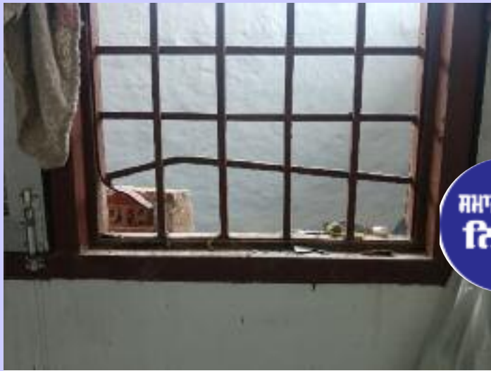
ਸਮਾਜ ਦੀਕਲੀ ਨਿਊਜ਼

ਫਿਲੌਰ/ਅੱਪਰਾ (ਦੀਪਾ) - ਬੀਤੀ ਰਾਤ ਚੋਰਾਂ ਵਲੋਂ ਪਿੰਡ ਦੁਸਾਂਝ ਕਲਾਂ ਦੀਆਂ ਤਿੰਨੋਂ ਬੈਂਕਾਂ ਵਿਚ ਚੋਰ ਚੋਰੀ ਕਰਨ ਆਏ। ਇਸ ਸਬੰਧੀ ਪੁਲਿਸ ਮੁਲਾਜ਼ਮਾਂ ਨੂੰ ਜਾਣਕਾਰੀ ਦਿੰਦੇ ਹੋਏ ਨੇੜੇ ਘਰਾਂ ਵਾਲਿਆਂ ਨੇ ਦੱਸਿਆ ਕਿ ਬੀਤੀ ਰਾਤ ਕਰੀਬ ਸਵਾਂ ਇੱਕ ਵਜੇ ਦੁਸਾਂਝ ਕਲਾਂ ਦੀ ਕੋਆਪਰੇਟਿਵ ਬੈਂਕ ਵਿੱਚ ਚੋਰੀ ਕਰਨ ਦੀ ਆਏ ਨੀਤ ਨਾਲ ਚੋਰਾਂ ਵਲੋਂ ਬੈਂਕ ਦੀ ਗਰਿੱਲ ਦਾ ਸ਼ੀਸ਼ਾ ਤੋੜਿਆ ਗਿਆ। ਚੋਰਾਂ ਵਲੋਂ ਜਦੋਂ ਗਰਿੱਲ ਨੂੰ ਸੱਬਲ ਨਾਲ ਤੋੜਿਆ ਜਾਂਦਾ ਸੀ ਤਾਂ ਲਾਗਲੇ ਘਰਾਂ ਵਾਲੇ ਜਾਗ ਪਏ। ਬੈਂਕ ਦੇ ਆਲੇ-ਦੁਆਲੇ ਦੇ ਲੋਕਾਂ ਨੇ ਆਪਣੇ ਘਰਾਂ ਦੀਆਂ ਲੈਟਾਂ ਜਗਾਂ ਦਿੱਤੀਆਂ। ਚੋਰ ਲੈਟਾਂ ਜਗਦਿਆਂ ਦੇਖ ਕੇ ਇੱਥੋਂ ਭੱਜ ਗਏ। ਇਸੇ ਤਰ੍ਹਾਂ ਅੱਡੇ ਦੀ ਐਸ. ਬੀ. ਆਈ ਬੈਂਕ ਦੀਆਂ ਵੀ ਗਰਿੱਲਾਂ ਤੋੜਿਆ ਗਈ ਪਰ ਕੋਈ ਸਮਾਨ ਚੋਰੀ ਨਹੀਂ ਹੋਇਆ। ਇਸੇ ਤਰ੍ਹਾਂ ਪੰਜਾਬ