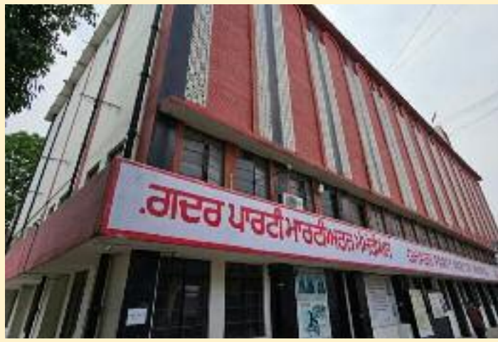
ਗਈ। ਅੱਜ ਪਹਿਲਗਾਮ ਕਤਲ ਕਾਂਡ ਦੇ ਕਾਰਨਾਂ ਉਪਰ ਉਂਗਲ ਰੱਖਣ ਅਤੇ ਹਕੂਮਤ ਦੀ ਜਵਾਬਦੇਹੀ ਤੈਅ ਕਰਨ ਦੀ ਬਜਾਏ ਲੋਕਾਂ

ਅਤੇ ਵਿਦਿਆਰਥਣਾਂ ਨੂੰ ਲਿੰਕ ਕਰਕੇ ਕਿਸੇ ਕਿਸਮ ਦੀ ਸਹਾਇਤਾ ਜਾਂ ਰਿਹਾਇਸ਼ ਦੀ ਜ਼ਰੂਰਤ ਪੂਰੀ ਕਰਨ ਦਾ ਵਿਸ਼ਵਾਸ ਦੁਆਇਆ ਹੈ ਦੇਸ਼ ਭਗਤ ਯਾਦਗਾਰ ਕਮੇਟੀ ਦਾ ਕਹਿਣਾ ਹੈ ਕਿ ਮੁਲਕ ਦੀ ਆਜ਼ਾਦੀ ਲਈ ਜਾਨਾਂ ਵਾਰਨ ਵਾਲੇ ਦੇਸ਼ ਵਾਸੀਆਂ ਨੇ ਧਰਮ, ਫਿਰਕੇ, ਬੋਲੀ, ਰੰਗ ਅਤੇ ਇਲ-ਅਕਬਰੀ ਕੌਛੜ ਨੇ ਆਜ ਕਮੇਟੀ ਤਰਫੋਂ ਲਿਖਤੀ ਬਿਆਨ ਜਾਰੀ ਕਰਦਿਆਂ ਆਪਣੇ ਜਾਰੀ ਕੀਤੇ ਫੋਨ ਨੰਬਰਾਂ ਉਪਰ ਨਿਰਦੇਸ਼ ਕਸ਼ਮੀਰੀ ਵਿਦਿਆਰਥੀਆਂ