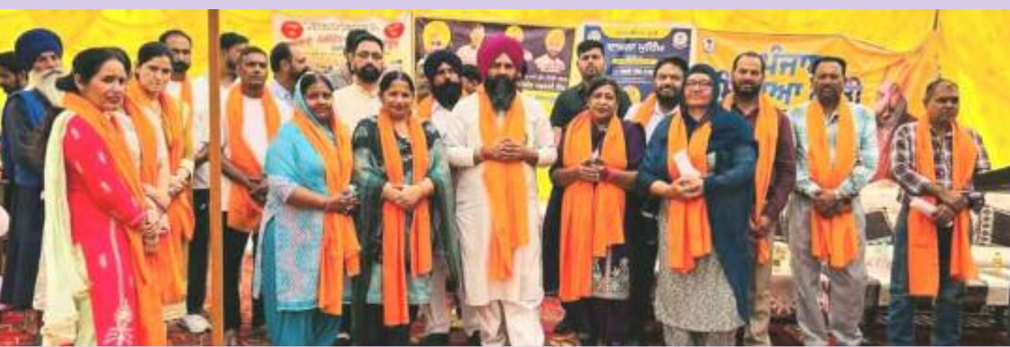
ਮੰਨਦੇ ਹੋਏ ਰਿਕਾਰਡ ਵਿਕਾਸ ਕਰਵਾਇਆ ਹੈ ਜਿਸ ਸਦਕਾ ਸਰਕਾਰੀ ਸਕੂਲਾਂ ਦੇ ਵਿਦਿਆਰਥੀ ਹਰੇਕ ਖੇਤਰ ਵਿੱਚ ਉੱਚੀਆਂ ਮੱਲਾਂ ਮਾਰ ਰਹੇ ਹਨ। ਉਨ੍ਹਾਂ ਕਿਹਾ ਕਿ ਸਿੱਖਿਆ ਕ੍ਰਾਂਤੀ ਸਾਡੇ ਸੂਬੇ ਦੀ ਤਰੱਕੀ ਦਾ ਆਧਾਰ ਬਣੇਗੀ ਤੇ ਸਰਕਾਰੀ ਸਕੂਲਾਂ ਚੋਂ ਪੜ੍ਹ ਕੇ ਆਮ ਘਰਾਂ ਦੇ ਬੱਚੇ ਵੱਡੀਆਂ ਉਚਾਈਆਂ ਨੂੰ ਛੂਹਣਗੇ। ਇਸ ਮੌਕੇ ਉਨ੍ਹਾਂ ਕਿਹਾ ਕਿ ਪੰਜਾਬ ਸਰਕਾਰ ਵੱਲੋਂ ਹੁਣ ਤੱਕ 54 ਹਜ਼ਾਰ ਨੌਜਵਾਨਾਂ ਨੂੰ ਸਰਕਾਰੀ ਨੌਕਰੀਆਂ ਪ੍ਰਦਾਨ ਕਰਕੇ ਕੀਰਤੀਮਾਨ ਸਥਾਪਿਤ ਕੀਤਾ ਗਿਆ ਹੈ। ਇਸ ਮੌਕੇ ਉਨ੍ਹਾਂ ਨੇ ਹੋਣਹਾਰ ਵਿਦਿਆਰਥੀਆਂ ਨੂੰ ਵਿਸ਼ੇਸ਼ ਤੌਰ 'ਤੇ ਸਨਮਾਨਿਤ ਵੀ ਕੀਤਾ। ਇਸ ਮੌਕੇ ਪਿੰਡਾਂ ਦੇ ਪੰਚਾਇਤ ਮੈਂਬਰ ਅਤੇ ਸਿੱਖਿਆ ਵਿਭਾਗ ਦੇ ਅਧਿਕਾਰੀ ਵੀ ਮੌਜੂਦ ਸਨ।

ਵਿਕਾਸ ਕਾਰਜਾਂ ਦੇ ਉਦਘਾਟਨ ਦੌਰਾਨ ਰੱਖੇ। ਉਨ੍ਹਾਂ ਸਰਕਾਰੀ ਪ੍ਰਾਇਮਰੀ ਸਕੂਲ ਸਤਨੌਰ ਵਿਖੇ ਚਾਰਦੀਵਾਰੀ, ਸਰਕਾਰੀ ਪ੍ਰਾਇਮਰੀ ਸਕੂਲ ਸਲੇਮਪੁਰ ਵਿਖੇ ਕਲਾਸਰੂਮ, ਸਰਕਾਰੀ ਪ੍ਰਾਇਮਰੀ ਸਕੂਲ ਕਿੱਤਣਾ ਵਿਖੇ ਚਾਰਦੀਵਾਰੀ ਅਤੇ ਸਰਕਾਰੀ ਪ੍ਰਾਇਮਰੀ ਸਕੂਲ ਮੋਰਾਂਵਾਲੀ ਵਿਖੇ ਕਲਾਸਰੂਮ ਦਾ ਉਦਘਾਟਨ ਕੀਤਾ। ਡਿਪਟੀ ਸਪੀਕਰ ਨੇ ਕਿਹਾ ਕਿ ਮੁੱਖ ਮੰਤਰੀ ਭਗਵੰਤ ਸਿੰਘ ਮਾਨ ਦੀ ਅਗਵਾਈ ਵਿੱਚ ਸੂਬਾ ਸਰਕਾਰ ਨੇ ਮਾੜੀ ਸਥਿਤੀ ਵਿੱਚ ਪਹੁੰਚੇ ਸਰਕਾਰੀ ਸਕੂਲਾਂ ਤੇ ਸਿਹਤ ਸੰਸਥਾਵਾਂ ਨੂੰ ਤਰਹੀਜ਼ੀ ਖੇਤਰ