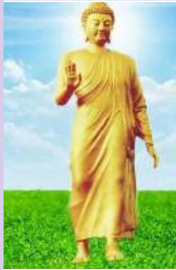
ਤਥਾਗਤ ਗੌਤਮ ਬੁੱਧ।