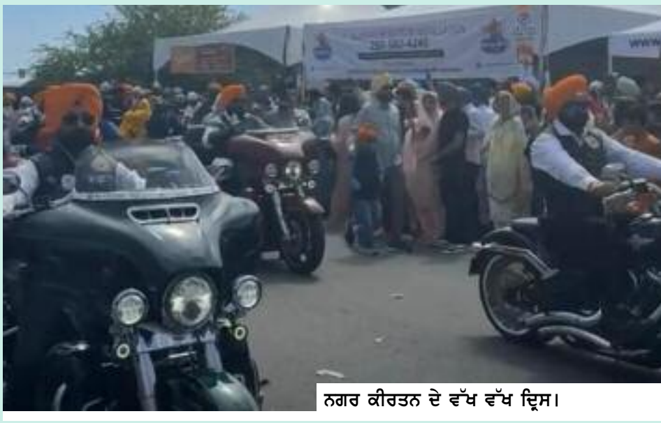
ਨਗਰ ਕੀਰਤਨ ਦੇ ਵੱਖ ਵੱਖ ਦ੍ਰਿਸ਼।