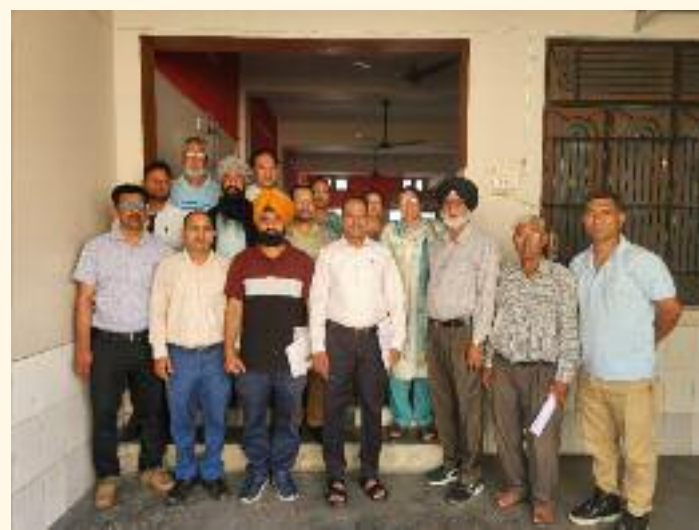
ਗਿਣੀ ਮਿੱਥੀ ਸਿਆਸੀ ਪੱਧਰ ਤੇ ਪਰਦਾਫਾਸ਼ ਕਰਕੇ ਸਾਜਿਸ਼ ਹੈ ਜਿਸਦਾ ਵੱਡੇ ਵਿਰੋਧ ਕਰਨ ਦੀ ਲੋੜ

ਕੁਤਾਹੀ ਲਈ ਭਾਰਤ ਸਰਕਾਰ ਅਤੇ ਇਸ ਦੀਆਂ ਖੁਫੀਆ ਏਜੰਸੀਆਂ ਜ਼ਿੰਮੇਵਾਰ ਹਨ। ਸੁਸਾਇਟੀ ਆਗੂਆਂ ਨੇ ਜਾਰੀ ਇੱਕ ਪ੍ਰੈਸ ਬਿਆਨ ਰਾਹੀਂ ਪੀੜਤ ਪਰਿਵਾਰਾਂ ਨਾਲ ਗਹਿਰਾ ਦੁੱਖ ਪ੍ਰਗਟ ਕਰਦਿਆਂ ਕਿਹਾ ਕਿ ਇਹ ਫਿਰਕੂ ਕਤਲੇਆਮ ਮਹਿਜ ਅੱਤਵਾਦ ਦੀ ਘਟਨਾ ਨਹੀਂ ਬਲਕਿ ਕਸ਼ਮੀਰ ਦੇ ਲੋਕਾਂ ਦੀ ਆਰਥਿਕਤਾ ਤੇ ਅਮਨ ਸ਼ਾਂਤੀ ਦੇ ਮਾਹੌਲ ਨੂੰ ਬਰਬਾਦ ਕਰਨ ਅਤੇ ਦੇਸ਼ ਵਿੱਚ ਵੱਡੀ ਪੱਧਰ ਤੇ ਹਿੰਦੂ ਮੁਸਲਿਮ ਫਿਰਕੂ ਦੰਗੇ ਫਸਾਦ ਕਰਵਾਉਣ ਦੀ ਇਕ