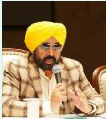
ਜਾਂਦੀ, ਉਹ ਅਕਾਲ ਤਖ਼ਤ ਦੇ ਕਾਰਜਕਾਰੀ ਜਥੇਦਾਰ ਵਜੋਂ ਵੀ