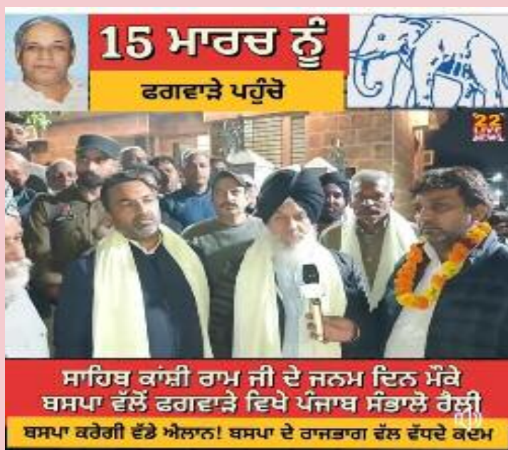
ਸਾਹਿਬ ਕਾਸ਼ੀ ਰਾਮ ਜੀ ਦੇ ਜਨਮ ਦਿਨ ਮੌਕੇ ਬਸਪਾ ਵੱਲੋਂ ਫਗਵਾੜੇ ਵਿਖੇ ਪੰਜਾਬ ਸੰਭਾਲੋ ਰੈਲੀ ਬਸਪਾ ਕਰੋਗੀ ਵੱਡੇ ਐਲਾਨ! ਬਸਪਾ ਦੇ ਰਾਜਭਾਗ ਵੱਲ ਵੱਧਦੇ ਕਦਮ

ਮਾਵਾਂ, ਭੈਣਾਂ, ਧੀਆਂ, ਨੂੰ ਅਪੀਲ ਕਰਦਾ ਹਾਂ ਕਿ 15 ਮਾਰਚ ਨੂੰ ਫਗਵਾੜਾ ਵਿਖੇ ਪੰਜਾਬ ਸੰਭਾਲੋ ਰੈਲੀ ਵਿੱਚ ਸ਼ਾਮਲ ਹੋਕੇ ਸਾਹਿਬ ਕਾਸ਼ੀ ਰਾਮ ਜੀ ਸੱਚੀ ਸ਼ਰਧਾਂਜਲੀ ਭੇਟ ਕਰੋ ਅਤੇ ਸੰਕਲਪ ਕਰੋ ਕਿ ਇਨ੍ਹਾਂ ਸਰਕਾਰਾਂ ਨੂੰ ਬਦਲ ਕੇ ਬਸਪਾ ਦੀ ਸਰਕਾਰ ਬਣਾਉਣਗੇ। ਮੈਂ ਇਸ ਮੌਕੇ ਤੇ ਸਭ ਭਰਾਵਾਂ ਪੱਤਰਕਾਰਾਂ, ਲੇਖਕਾ, ਯੂ ਟਿਊਬ ਵਾਲੇ ਵੀਰਾਂ, ਦੁਕਾਨਦਾਰਾਂ, ਚੈਨਲਾਂ ਵਾਲੇ ਵੀਰਾਂ ਭੈਣਾ, ਮਜ਼ਦੂਰਾਂ ਕਿਸਾਨਾਂ ਅਤੇ ਮੱਧ ਵਰਗ ਦੇ ਲੋਕਾਂ ਨੂੰ ਮੇਰੀ ਅਪੀਲ ਹੈ ਕਿ ਇਸ ਵਾਰ ਬਸਪਾ ਨੂੰ ਮੌਕਾ ਦਿਓ ਅਤੇ