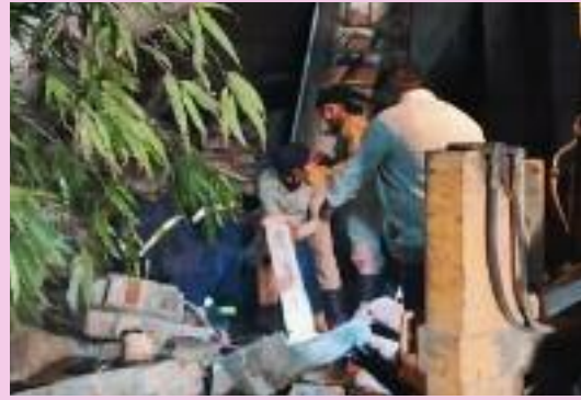
ਮਿਲੀ ਹੈ। ਮੈਂ ਪ੍ਰਸ਼ਾਸਨ ਨੂੰ ਤੁਰੰਤ ਹਾਲਾਤ ਦਾ ਜਾਇਜ਼ਾ ਲੈਣ ਲਈ ਨਿਰਦੇਸ਼ ਜਾਰੀ ਕੀਤੇ ਹਨ। ਬਚਾਅ ਟੀਮਾਂ ਪਹੁੰਚ ਗਈਆਂ ਹਨ ਅਤੇ ਉਹਨਾਂ ਨੇ ਆਪਣਾ ਕੰਮ ਸ਼ੁਰੂ ਕਰ ਦਿੱਤਾ ਹੈ। ਮਲਵੇ ਹੇਠ ਦੱਬੇ ਕਰਮਚਾਰੀਆਂ ਦੇ ਜਲਦ ਸੁਰੱਖਿਅਤ ਬਾਹਰ ਆਉਣ ਅਤੇ ਤੰਦਰੁਸਤ ਹੋਣ ਦੀ ਕਾਮਨਾਂ ਕਰਦਾ ਹਾਂ।"

ਸ਼ਨਿੱਚਰਵਾਰ ਸ਼ਾਮ ਨੂੰ ਲੁਧਿਆਣਾ ਵਿੱਚ ਇੱਕ ਵੱਡਾ ਹਾਦਸਾ ਵਾਪਰ ਗਿਆ। ਫੋਕਲ ਪੁਆਇੰਟ ਦੇ ਫੇਸ 8 ਵਿੱਚ ਮਲਟੀਸਟੋਰੀ ਬਿਲਡਿੰਗ ਅਚਾਨਕ ਡਿੱਗ ਪਈ। ਮੌਕੇ 'ਤੇ ਮੌਜੂਦ ਲੋਕਾਂ ਦਾ ਕਹਿਣਾ ਹੈ ਕਿ ਇਸ ਬਿਲਡਿੰਗ ਦੇ ਹੇਠਾਂ ਅੱਧਾ ਦਰਜਨ ਦੇ ਕਰੀਬ ਵਿਅਕਤੀ ਦੱਬੇ ਹੋਏ ਹਨ। ਜਾਣਕਾਰੀ ਤੋਂ ਬਾਅਦ ਪੁਲਿਸ ਪਾਰਟੀ ਮੌਕੇ ਤੇ ਪਹੁੰਚੀ ਅਤੇ ਬਚਾਅ ਕਾਰਜ ਸ਼ੁਰੂ ਕੀਤੇ। ਇਸ ਹਾਦਸੇ ਤੋਂ ਬਾਅਦ ਰੈਸਕਿਊ ਜਾਰੀ ਹੈ। ਸ਼ਹਿਰ ਦੇ ਵੱਖ-ਵੱਖ ਇਲਾਕਿਆਂ 'ਚ ਫਾਇਰ ਬ੍ਰਿਗੇਡ ਦੀਆਂ ਟੀਮਾਂ ਵੀ ਹਾਦਸੇ ਵਾਲੀ ਥਾਂ ਤੇ ਜਾਣ ਲਈ ਰਵਾਨਾ ਹੋ ਚੁੱਕੀਆਂ ਹਨ। ਬੋਆਇਲਰ ਫਟਣ ਦਾ ਸ਼ੱਕ ਪ੍ਰਗਟਾਇਆ ਜਾ ਰਿਹਾ ਹੈ। 'ਲੁਧਿਆਣਾ ਵਿਖੇ ਇੱਕ ਫੈਕਟਰੀ ਦੀ ਇਮਾਰਤ ਡਿੱਗਣ 'ਤੇ ਮੁੱਖ ਮੰਤਰੀ ਭਗਵੰਤ ਮਾਨ ਨੇ ਦੁੱਖ ਪ੍ਰਗਟਾਇਆ ਹੈ। ਉਨ੍ਹਾਂ ਨੇ ਟਵੀਟ ਕਰਕੇ ਲਿਖਿਆ ਹੈ ਕਿ "ਲੁਧਿਆਣਾ ਵਿਖੇ ਇੱਕ ਫੈਕਟਰੀ ਦੀ ਇਮਾਰਤ ਡਿੱਗਣ ਦੀ ਖ਼ਬਰ