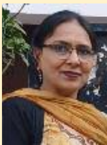
ਅਮਨ ਢਿੱਲੋਂ ਕਮੇਲ ਬਾਬਾ ਬਕਾਲਾ

ਜੇ ਵੀ ਉਸ ਨਾਲ ਹਸ ਕੇ ਬੋਲੇ ਦਿਲ ਦੀ ਘੁੰਡੀ ਕੋਲ ਜਾ ਖੋਲ੍ਹੋ, ਬਿਨਾ ਕਿਸੇ ਲਾਲਚ ਤੋਂ ਔਰਤ ਦਿਲ ਦੀ ਦੌਲਤ ਉਸ ਤੇ ਲੁਟਾਵੇ!